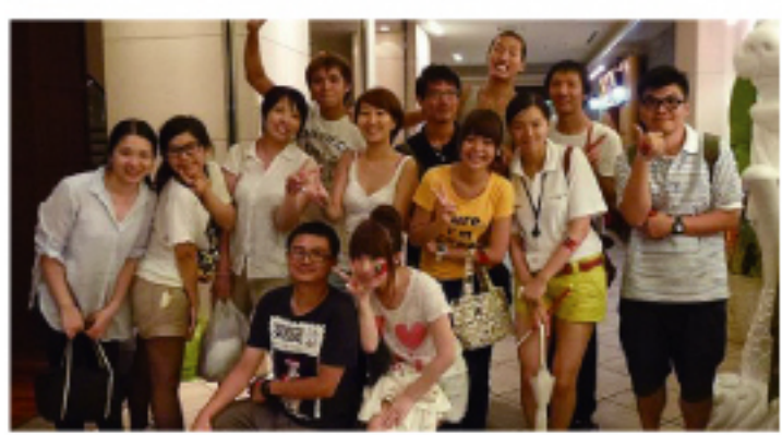
參與台灣祭打工的台灣留學生們。感謝同學們兩天來的辛勤付出，辛苦了！

主辦單位安排的節目例如有：電音三太子，配合「保庇」等幾首快歌現場熱舞，吸引了許多日本的男女老少的圍觀，甚至有許多台灣的留學生也驚呼，即使在台灣也不容易看見這些表演。另外，還有東京中華學校帶來的舞龍舞獅表演，高雄小姐的熱歌勁舞、原住民的山地舞表演以及抽獎活動，精彩的表演和高潮不斷的抽獎活動，成功的帶動了現場的氣氛。