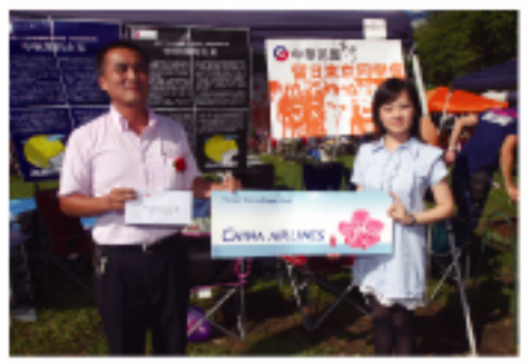
華航送出東京台北來回機票掀起活動高潮