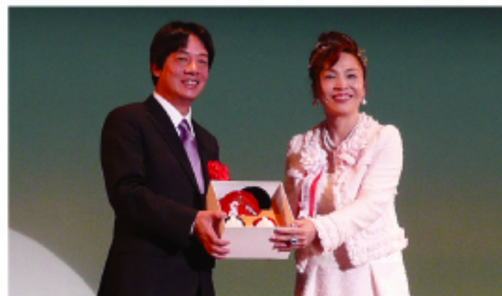
台南市市長賴清德訪大阪

民主，經濟上我們從落後的開發中國家變成先進國家。世界上有117個國家承認中華民國護照，給予免簽證的待遇。中華民國能有今天是海外華僑支持協助、共同努力的成果。