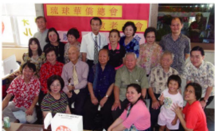
敬老會出席人員合影

【本報訊】為配合我國重陽節及日本「敬老日」節日，發揚我國敬老尊賢之優良傳統並促進老一輩僑民與年輕世代僑民之聯繫交流，駐那霸辦事處協理轄內最大僑會「琉球華僑總會」於9月11日(星期日)舉辦敬老會及保齡球競賽活動，獲僑民踴躍參與，