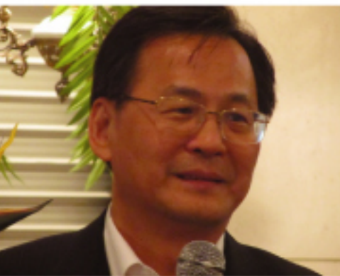
經濟部次長黃重球

外關於節能方面，台灣的優勢製造產業將如何配合未來的節能趨勢與日本廠商進行合作，日方的應對政策又為何、將如何著力，也將成為本次會談的主題。