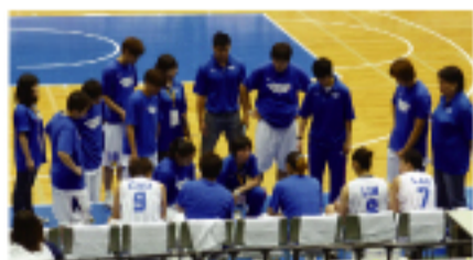
台灣女籃隊比賽之一景