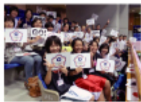
大村市立櫻原國中同學及家長專程來場加油助陣

【本報訊】中華女籃隊隊員一行於8月下旬抵日參加「第24屆亞洲盃女籃賽」，在經過激烈的競爭之後拿下第四名。比賽名次依序為冠軍中國大陸隊、韓國、日本分列亞、季軍。在七天之賽程中，中華隊打贏印度及黎巴嫩兩隊。