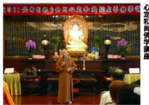
心定和尚佛學講座