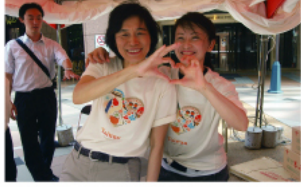
台灣觀光局設攤與大家同樂 照片左方為觀光局局長黃怡平