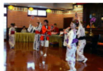
佛光山青年表演歌舞