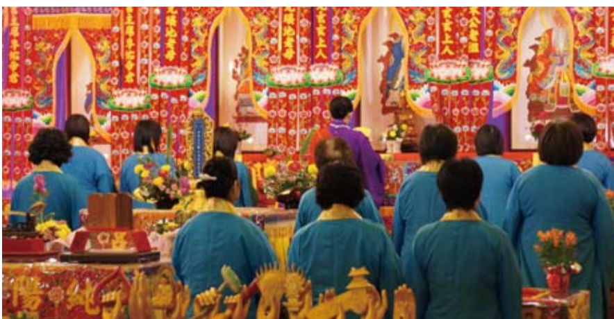
中著紫衣者為玄門法師

【本報訊】源自台灣台中，位於千葉縣的日本大道院純陽宮於11月底舉辦為期4天祈福超渡法會。此場法會籌備多時，11月24日從台灣來了百餘名信徒。當天下午「扶鸞」濟世儀式登場，第二天除有由玄門法師主持為期三天的誦經儀式之外，還有除靈儀式。第三天則為無極混元三聖大天尊、呂仙祖的誕辰慶祝。第四天的最後儀式為帝釋天的祈福儀式。整個法會於11月27日落幕。加上當地的日本及台灣信徒，約數百名信徒參加這場盛會。