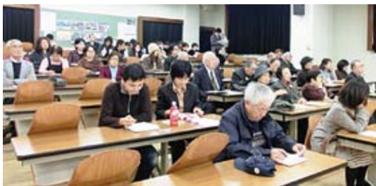
影展還沒開始，民們就已提早來到現場

【本報訊】11月22日，財團法人全國建設研修中心舉辦了一場迷你影展「從動畫學習 天災和我們的生活」，以紀念創立50週年。上映的電影有悼念在1969年伊勢灣強颶中罹難的五千多人的《伊勢灣颶風物語（伊勢灣台風物語）》、描述在奈良時代協助伊丹台地（現兵庫縣）農民墾荒建設的和尚「行基」貢獻的《救人建國的和尚（人をたすけ国をつくったお坊さんたち）》，以及紀念日