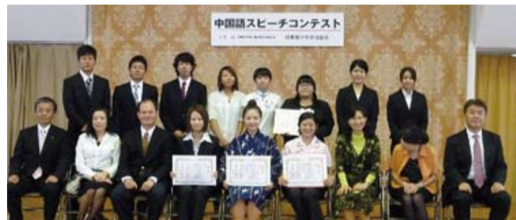
前排中為2011年中國語演講比賽沖繩大會獲獎同學

【本報訊】由日本航空・日華青少年交流協會主辦，交流協會及駐那霸辦事處擔任後援的「2011年中國語演講比賽沖繩大會」於11月19日在那霸市國場大廈盛大舉行，有琉球大學、沖繩大學、