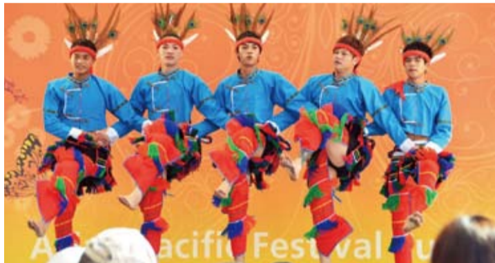
原鄉舞蹈團於JR博多車站前演出，展現精湛原住民歌舞

【本報訊】日本向來是台灣最重視的觀光市場，而其中福岡機場是日本前往台灣旅遊最方便之航點之一。台灣觀光局為促進九州地區訪台市場暨宣傳2012年為「台日觀光促進年」，於10月6日組成台灣觀光代表團前來福岡及熊本等地辦理觀光業者說明會暨交流會，10月8日至10日參加「2011福岡亞洲嘉年華會」，辦理台灣觀光推廣活動。