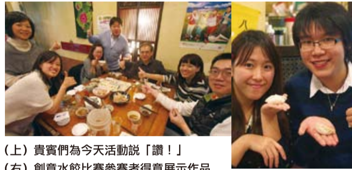
(上) 貴賓們為今天活動說「讚！」