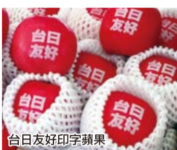
台日友好印字蘋果

【本報訊】遭日本三一一大地震及福島核電廠輻射外洩影響，日本東北地區各大產業都被外界貼上「受輻射污染」的標籤，其中影響最大的，莫過於東北地區的農畜產品。「東北產的東西還能不能吃？可否進口？」的日本國內外