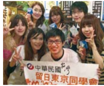
創意水餃比賽得獎者合影

除了基本的白菜水餃及泡菜煎餃的留學生，真的是千載難逢的好機會。期望明年還能有這種說明會，讓更多的留學生受惠。