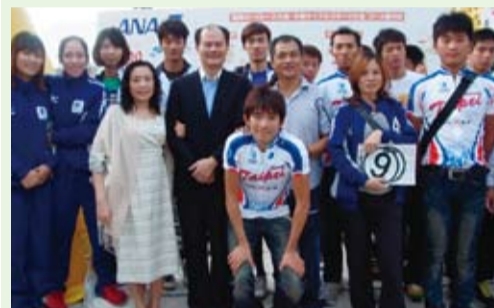
代表團教練及選手合影

【本報訊】由NPO法人Tour De Okinawa協會、北部廣域市町村圈事務組合及日本自行車競技聯盟主辦、沖繩縣協辦的「2011環沖繩亞洲巡迴公路賽」於11月12~13日在沖繩縣名護市開跑，「中華台北」代表團也赴沖繩參賽。這次訪沖選手及加油團共約170人，為歷年來最多，駐那霸辦事處特於11月11日派員赴機場迎接，並餽贈運動飲料為代表團加