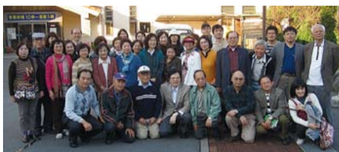
留日大學教師聯誼會及中國語文學會會員

有名的紅葉林，今年因受天氣異常影響，樹葉還沒有變紅，大家邊散步邊聊天，享受自然森林浴。隨後往靜岡縣的「大仁百笑湯」泡溫泉，室內室外加起來有十幾種湯可泡，消除了積年的疲勞。店家招待大家喝一杯香醇的咖啡後，當然就少不了大肆採購各種名產了。