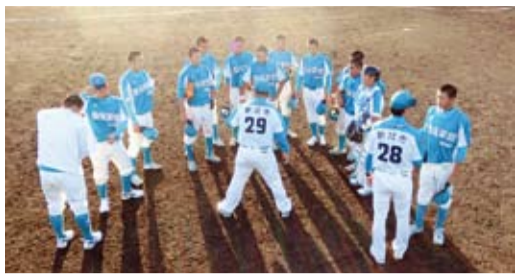
台灣青棒隊與靜岡縣進行友好交流