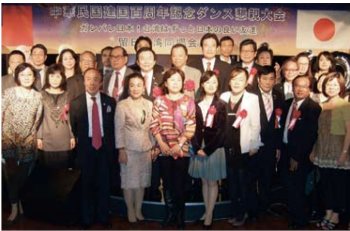
受邀嘉賓和主辦單位合影

【本報訊】中華民國留日同鄉會於11月12日國父誕辰紀念日熱鬧舉辦建國百年慶祝舞會，參加人員全體盛裝出席，除了品嚐美食美酒外，也在流洩著各國舞曲的舞池中盡情舞蹈。這次慶祝建國百年舞會共有250人出席，每位出席者都在熱舞、欣賞非洲鼓表演和旅日歌手舞ちゃん演唱助興，以及參加最後將現場氣氛帶至高潮的抽獎活動下，共享建國百年的喜氣。