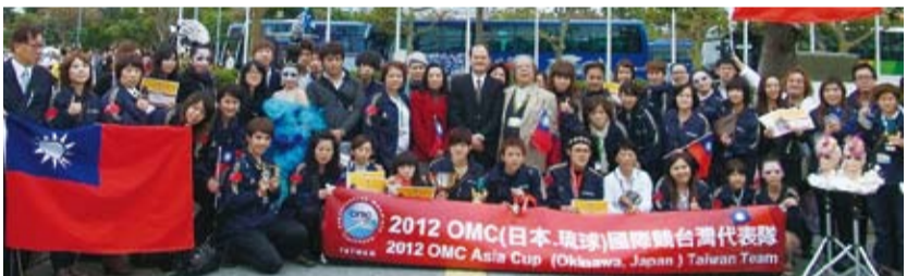
粘處長夫婦在頒獎會場與我代表團員合影