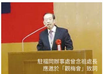
駐福岡辦事處會祖處長應邀於「觀梅會」致詞