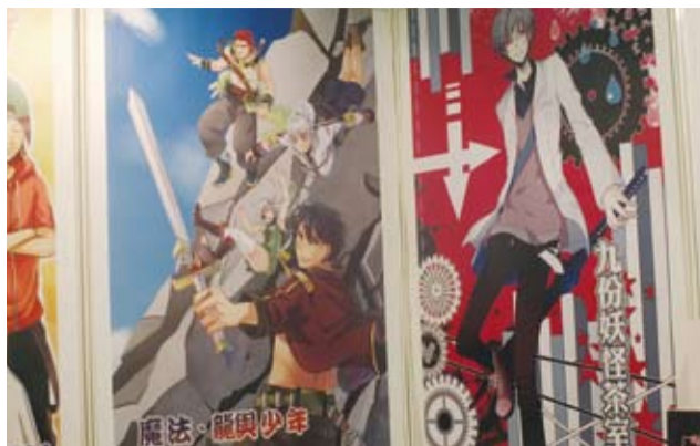
漫畫展在台熱潮年年加溫

【本報訊／台北報導】台灣最大的動漫展覽活動－漫畫博覽會，已正式邁入第十三屆，每年均吸引國內外數十萬人前來參觀，參觀人潮、參展廠商及展覽規模也逐年成長，並成為亞洲地區最重要的動漫展覽活動之一，今年主題為「FUN青春 SHOW活力」，今年暑假勢必再度成為青少年討論焦點。