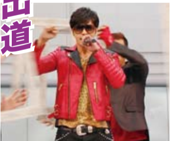
台灣「舞王」羅志祥勁歌熱舞，引起歌迷們尖叫連連