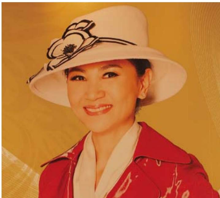
帽子歌后鳳飛飛讓人永遠懷念

而鳳飛飛平易近人，完全沒有大牌明星的架式，這是眾所皆知，因此也有平民天后的稱號。鳳飛飛生前出過81張的唱片，縱橫歌壇40多年，是個家喻戶曉的歌手。翻開舊有的記憶，其實她的辛勞不為人知，而在她心酸的