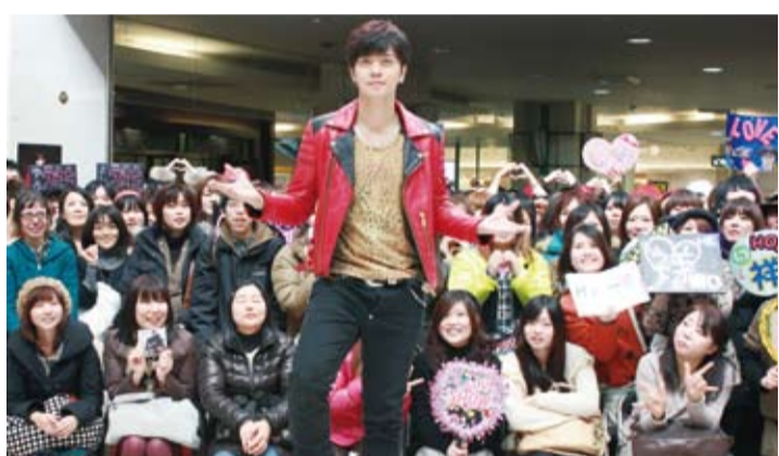
羅志祥在演唱結束和歌迷們合影