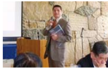
盧聰明教授專題演講