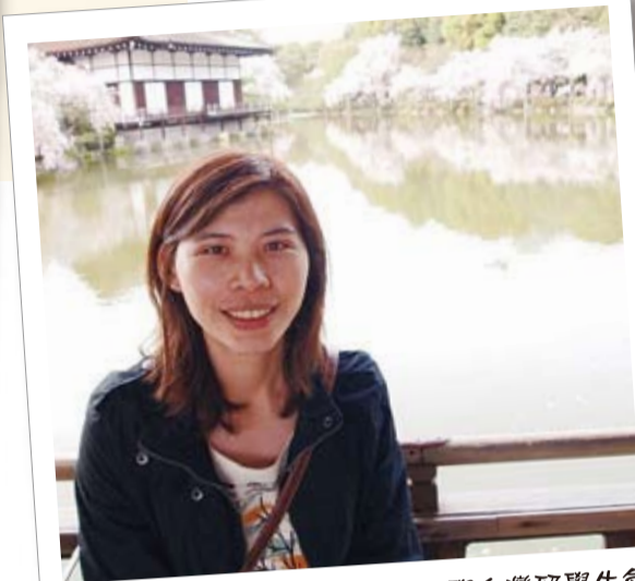
關西大學台灣留學生會