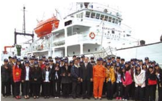
粘處長與「漁訓2號」全體師生及船長合影

間因釣魚台主權及專屬經濟海域（EEZ）重疊問題，致常有漁事糾紛發生，馬總統曾指示釣魚台處理原則為「主權在我、擱置爭議、平等互惠、共同開發」，盼台日雙方和平理性處理此項爭議問題；粘處長另期勉同學努力學習，將來成為我國漁業生產及海洋資源