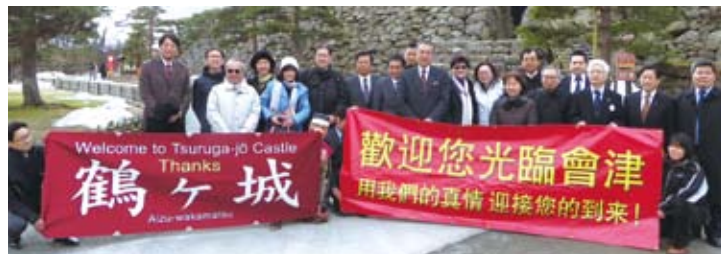
福島視察團在鶴城前合影留念