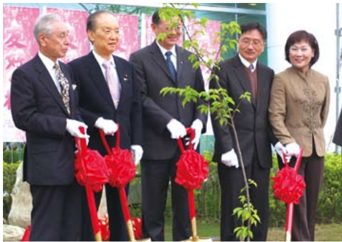
植櫻儀式(左起友好會會長田繁、前日本首相海部俊樹、文山區區長蔡培林、世新校長賴鼎銘、市議員厲耿桂芳)

島視察就像是他的「畢業旅行」，到福島之後，他認為福島一切正常，唯獨缺乏觀光客，因此馮代表表示很高興能藉此機會到福島，加強台灣與福島的交流。