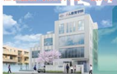
新校舍的外觀(立地:東京都新宿区)

留學課程12年10月生・短期課程隨時招募中！ 經驗豐富的教師陣容・優良學校・獎學金制度・短期留學也OK！