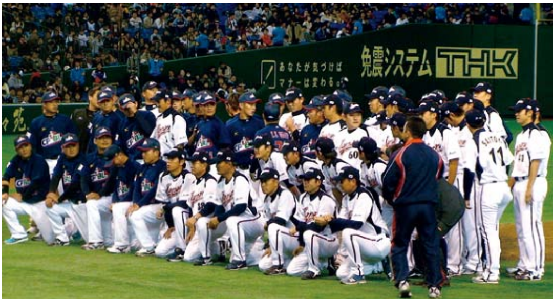
台灣職棒代表隊和日本武士隊合影留念

比賽開打前兩小時，巨蛋外頭就已聚集大批排隊人龍，攜家帶眷進場觀戰的球迷為數眾多，吸引了超過三萬五千名球迷來場觀戰，販售日本聯隊「武士隊」紀念品的攤位在半小時內，大部份的商品就被球迷一掃而空。這場「東日本大震災復興支援棒球友誼賽」共有兩場賽事，第一場的比赛為日本國內業餘棒球選手對大學棒球選手，傍晚的比赛就是中華職棒代表隊對日本武士的國際友誼賽。大會收入不僅將捐贈賑災，更招待宮城縣、岩手縣、福島縣等受到重創的災區居民12000人前來觀戰，此外，日本棒球機構在大會結束後舉