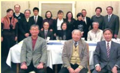
與會人員合影留念

謝各僑會在去年中華民國建國100年時配合代表處所舉辦之各項慶祝活動，也希望千葉中華總會續予支持，並表示駐處僑民緊急聯絡網資料庫系統也建置完成，請該會協助籲請當地會員及僑民能主動提供聯絡資訊，倘遇緊急突發事件，能將相關訊息於第一時間通知我旅日國，新年餐會進行約3小時圓滿結束。