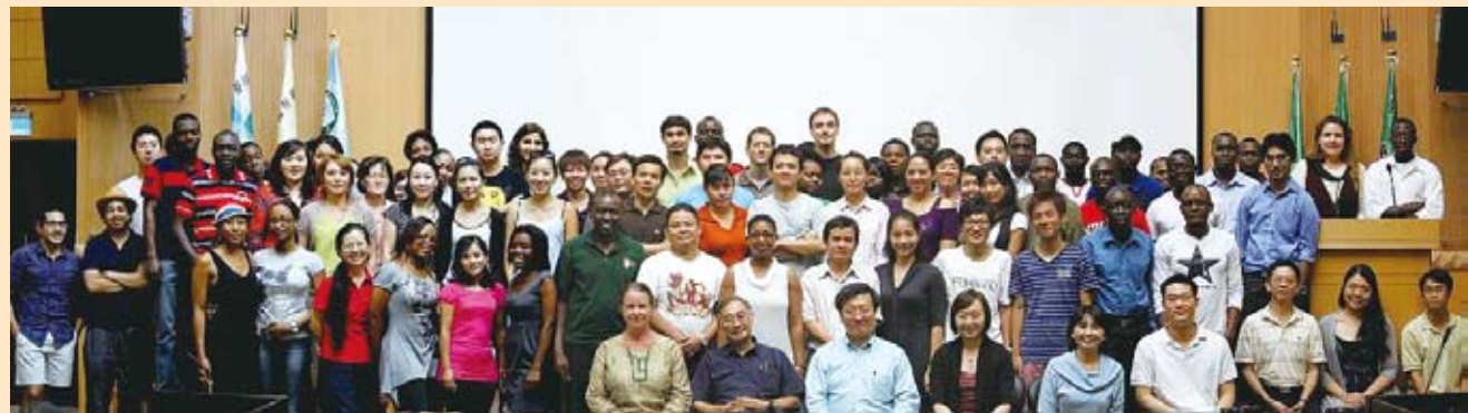
【北医大の国際生徒の集合写真】

本校は、積極的に海外からの生徒募集を行っています。このため、外国人生徒数も年々伸長し、現在では三百余名に達しております。優秀な外国人生徒を奨励するため、本校では数多くの奨学金を外国人生徒に提供しています。国合会医務管理修士課程奨学金、台湾奨学金のほか、本校は奨学補助金を提供し、最高額の奨学金は月2万5千台湾ドルプラス毎学期5万台湾ドルの優秀研究生奨励金で条件も良いです。奨学金情報詳細は本校国際事務処ホームページまで。