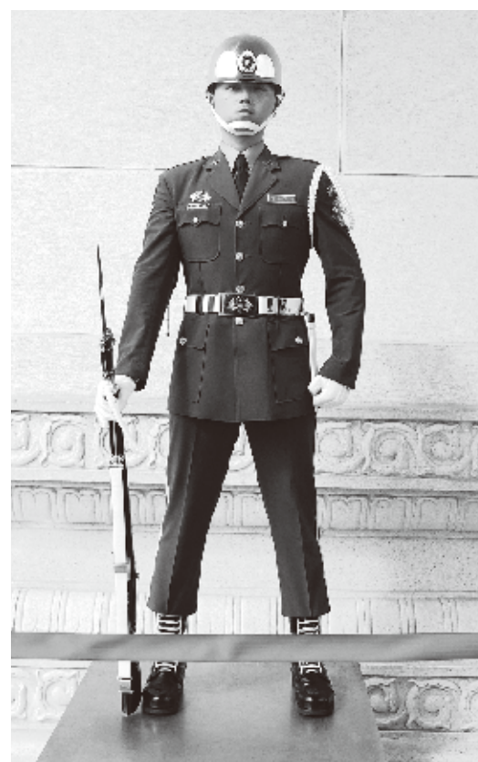
瞬きひとつせず立つ門番

重みと台湾人の気骨を感じさせられる。改めて戦いの中で生まれた歴史を肌で感じ取れるスポットだ。主にバスで訪問する観光客は多いが、正面のスペースに駐車する時間が決められていて、時間経過とともに警察の取り締まりも厳しい。限られた時間を厳粛な気持ちで礼拝したいスポットだ。アクセスは地下鉄劍潭駅から約1.5キロ徒歩で15分程度。圓山駅から大直駅からも行く事は可能だ。