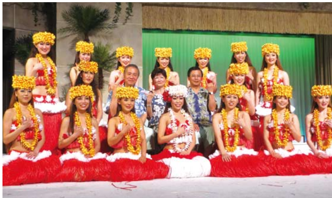
いわき市をアピールするフラガールと記念の一枚

3月12日(月)夜、日本の駐台湾大使館に相当する交流協会台北事務所が台北市内のホテルで主催した東日本大震災追悼・復興レセプションで、馬英九総統は、台湾当局が福島県全域に出した渡航自粛勧告について、「東京電力福島第1原発の半径30キロ圏内と計画的避難区域を除き、勧告を解除する」と宣言した。