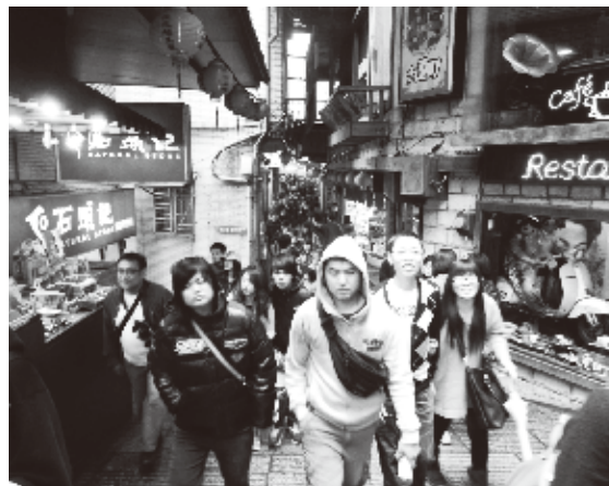
細い坂道を多くの観光客が歩いている

九份は子供のころ見た夢の町のように。ただの懐古趣味ではない、人の心の奥底にあるものを刺激する。