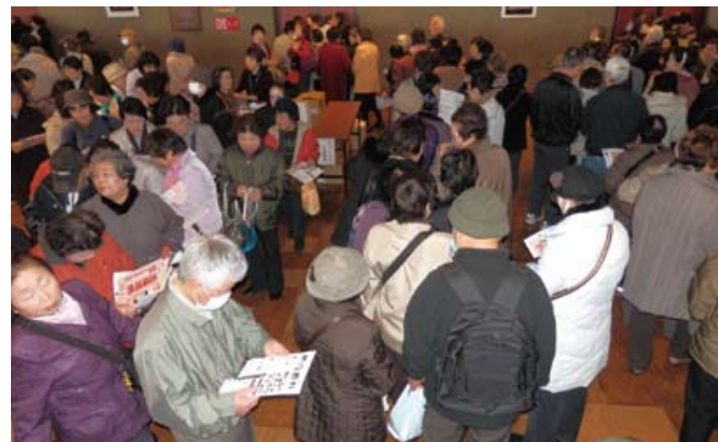
開場前から詰めかけた大勢のお客さん