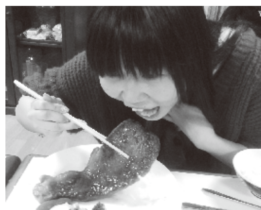
顔より大きい那須牛ステーキを堪能

訪問当日は雨。足元の悪い中、那須へ家族4人で出発した。現地までは震災の爪痕を見ながら一般道路で走行。途中、茨城の道の駅に立ち寄り、通常に5分の1程度の来場者との事だった。そしてそのまま那須へ直行した。 那須は那須山からの吹き降ろしで、気温2℃で寒い歓迎を受けた。午後3時に西郷荘に到着!!木立の中の静寂なところに位置し、那須での数多い別荘地の中では、古い旅館のイメージだ。家族4人で配膳からすべて行っており、家族的な雰囲気、旅館というより親しみやすい民宿的な感じを受けた。ご主人の人柄からもそのように感じた。震災後の観光客激減でも、丁寧な娘さんたちの振る舞いもよく、頑張っていた。 すぐにお風呂に入ったが、温泉は源泉かけ流しで24時間入浴可能。お客様も少ない時間で、ゆったりと日々の疲れをとれる温泉であったので、夕食まで2度も入浴してしまった。 夕食は小鉢等家庭的な料理であるが最後の那須牛のステーキには子供たちもビックリ!!!私にはボリュームがありすぎて、全て完食することは不可能