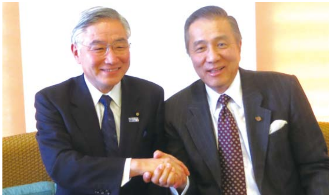
馮寄台代表(右)と参議院議員・岩城光英氏