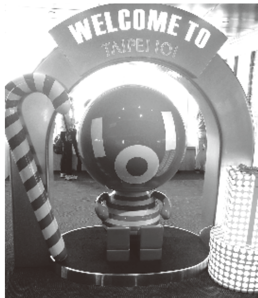
ダンパーベイビー

営業時間は月曜日から日曜日まで午前9時から午後10時。9時15分が最終入場時間。