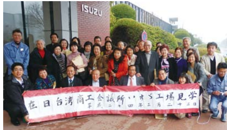
見学会に参加した会議所といすゞ自動車スタッフの皆さん