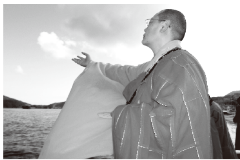
散華をする満潤法師

未曾有の被害をもたらした東日本大震災から1年。3月11日には、各地で慰霊祭が行われた。