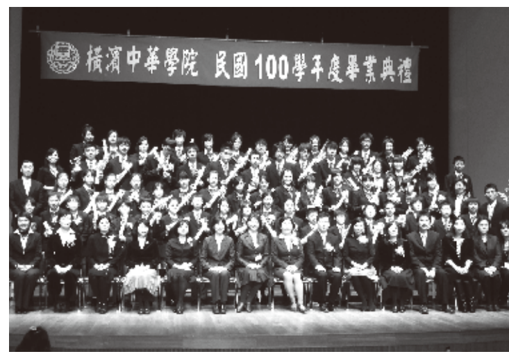
卒業生と教師の皆さん