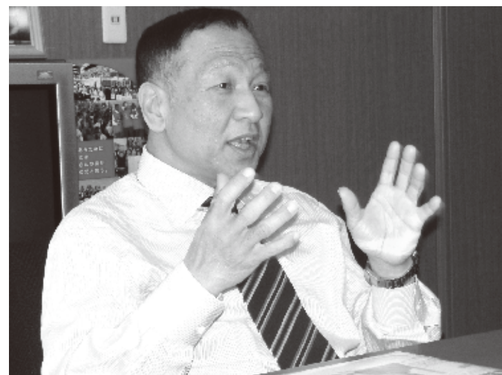
大江康弘参議院議員

巨額の義援金を台湾より受けながら正式なお礼をせず、献花問題では代表処副代表に冷淡な行いをした日本政府。このような状況でも、台湾国民は寛容に日本を遇してくれている。現況を踏まえ今後、日本政府はどうすればよいのか。親台議員のなかでも、第一人者である大江康弘参議院議員に日本のとるべき道を伺った。