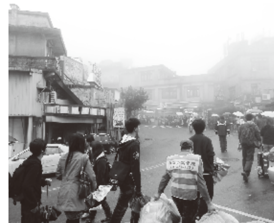
一年の半分以上をガスに包まれている九份