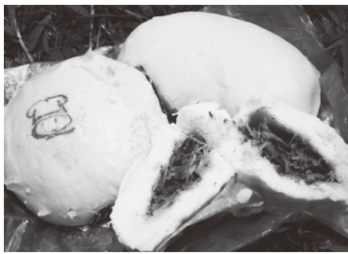
肉まんバリエーション。中央のものはビーフン入り

を包みにねりこんだ具なしの菓子パンふうのもの。あんまんならぬ、ごまペースト入りなどなど。数えあげれば、きりがありません。 ところで日本で肉まんが食べられるようになったのは諸説ある。1915年に神戸の中華料理店「老祥記」が豚餡頭を売りだしたという説と、1927年に中村屋が中華餡頭を売り出したという説がある。 日本も台湾も、いずれの国もフレキシブルな国民性を持つのだが、肉まんのバリエーションのくりひろげかたは、それぞれ別の経緯があった。台湾は中華料理のアレンジ。いっぽうの日本では、肉まん自体が舶来ものであるだけに、変わりようも突飛である。台湾人から見れば不思議に思われるだろうが、たとえばカレーまん。さらにはピザまんまで。聞いたところによれば、こんな品も売られたことがあるらしい。チーズラザニアまん、ハンバーグまん。プリンまん? ミルクキャラメルまん!? 聞いているうちに、何の料理か分からなくなってしまうではないか。この発想、日本人の得意とする、舶来ものの日本式消化方法だろうか。たとえば舶来のパンと伝統のあんを合わせて発明された、あんパンや、同様の原理でできたカレーうどんなどと、同じ発想と思われる。 バリエーションの方向は違えど、アレンジ上手な日本と台湾。肉まんは中華圏から日本への影響であるならば、逆に肉まんケースを