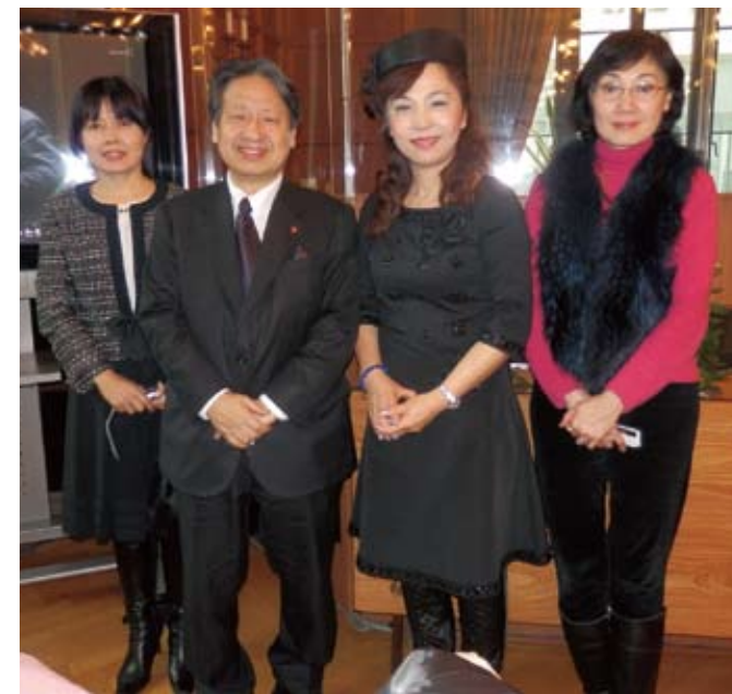
衆議院議員、辻恵氏(左から2人目)を囲んで