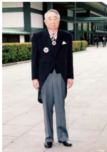
張榮發總裁

張總裁曾在創業初時，受到日本丸紅商社的貸款資助，心存感謝的張總裁，便開始致力於日本經貿發展及扮演台日外交關係的推手。1969年張總裁在東京設立長榮海運公司服務據點，1972年正式成立「長榮