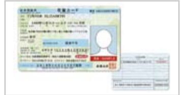
居留卡範本

《4》持居留簽證入境日本之外籍人士，可於成田、羽田、中部及關西機場入境時，在護照上加蓋上陸許可印章，申領居留卡；自其他機場入境者，於向市、區役所申報住所後，由入國管理局郵送。