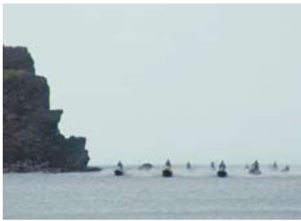
台灣水上摩托車協會一行抵達與那國島

台灣花蓮市及日本沖繩縣與那國町為慶祝雙方締結友好姐妹市30週年，於4月29日至5月1日共同盛大舉辦「尚洋“花”與情“摩”力太平洋」水上摩托車跨洋活動。花蓮市公所及「台灣水上摩托車安全推廣協會」一行共75名人員分別搭乘了35部水上摩托車及1艘隨行船「多羅滿1號」，於4月29日上午9時自花蓮港集合出發，歷經約7小時航程橫渡太平洋150公里後順利抵達與那國町久部良港展開交流活動。駐那霸辦事處處長粘信士伉儷亦應邀前往參加當地町公所舉辦之相關歡迎儀式。