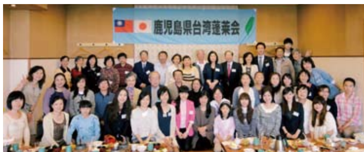
鹿兒島縣台灣蓬萊會成員合照

協助周知鹿兒島地區僑民，當日除受理申辦護照4件、文件證明1件外，並有諸多僑民及留學生詢問領務相關問題，氣氛熱絡，與會者對政府之「為民服務」政策，深為肯定。