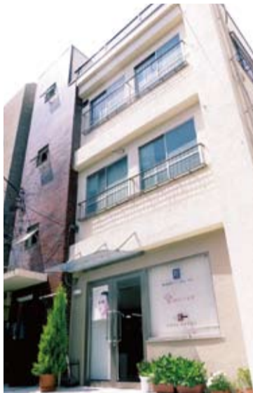
台灣新聞社東京本社大樓

為促進中古屋的流通，除了不動產業，同時也要聽取裝潢業，住宅設備等廣泛業界的意見。如何將房屋建商總合企業的機能向上，如何訓練增加消費者需求的事業者之類的構思等都相當之重要。其實與不動產有所關連的專門資格者，包含了不動產企業技能者，不動產鑑定士等等，這些替建築物評價的專門人材是少之又少。如果不再讓建築物的價值只是停在建築物建立的年數裡，務必急需訓練這些可以正面評價的專門人材才是上上之策。