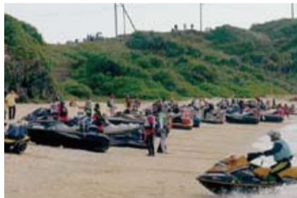
台灣水上摩托車隊陸續抵達久部良港

一行人員於當(29)日下午4時抵達與那國島久部良港時，受到與那國町町長外間守吉率當地人士以中文熱情高呼「歡迎、歡迎」的迎接儀式，現場有NHK電視台、朝日新聞、八重山每日新聞記者到場拍攝採訪。