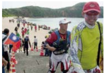
台灣水上摩托車協會一行接受當地町民歡迎

翌(30)日上午團員及與那國町舉行環境生態保護交流研討會，交換彼此對環境生態保護之觀點及具體作法；研討會後在與那國町人員的引導下，參觀與那國町海岸線的環境生態保護，並體驗與那國町的民俗與文化後，結束此次交流活動。團員於進行油料補給準備後，預定5月1日上午搭乘水上摩托車返航花蓮港。