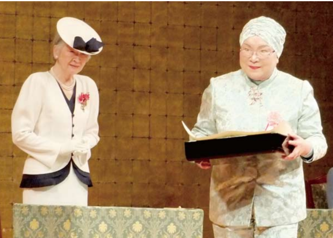
日本皇后美智子(左)、總統府國策顧問蔡雪泥(右)