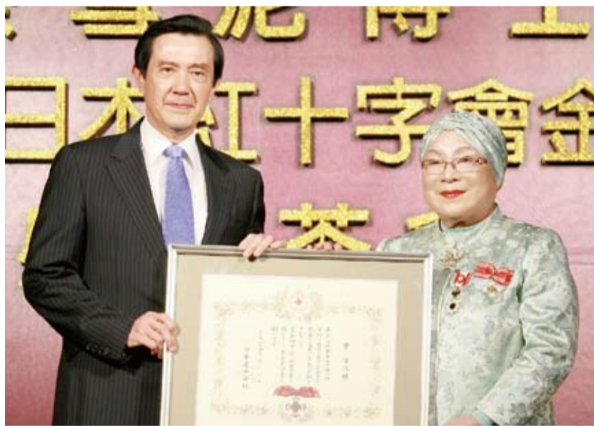
馬英九總統與蔡雪泥博士合影

此外，蔡雪泥於2001年首次獲頒日本紅十字會金色有功勳章，由寬仁親王妃信子殿下親自頒贈。她並在2004年獲頒「UCHINA第1號終身民間大使」榮譽，及在2006年成為素有日本「小諾貝爾獎」之稱的全國日本學士會學術獎國際獎項得主。