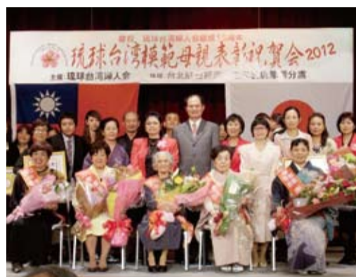
粘處長應邀與模範母親獲選者合影

之友好交流及實質關係；眾議員下地幹郎於致詞時，特別強調日本應對我國官民一體支援日本311賑災之義舉以具體作為表達感謝。繼由粘處長致詞表示值此「琉球台灣婦人會」成立十五週年之際，除衷心表示祝賀之意外，期待該會今後繼續扮演台沖文化交流橋樑角色，繼指出本年1月14日我國馬總統在多數民意支持下當選連任，本年5月20日將舉行就職典禮，繼續帶領我國朝「黃金十年」之方向前進；另指出台日間於去年9月簽署投資保障協定後，有利兩國企業進行經貿投資合作；11月簽署開放天空協議後，我國與鹿兒島、靜岡、富山、北海道航線陸續開航，本年4月14日台中-那霸航線甫舉辦首航儀式，象徵未來台日兩國人員交流往來將更加緊密。粘處長另強調，不論時代潮流如何演變，家庭及母親均為社會及