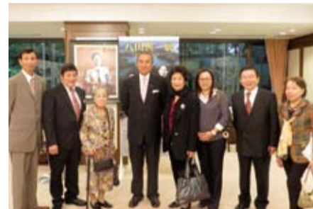
馮代表與當日到場之僑領們合影