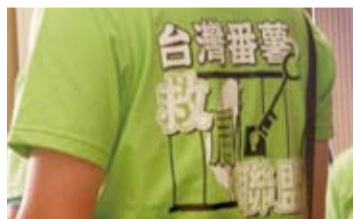
台灣番薯救扁聯盟T衫背面