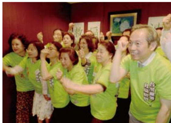
參會者們高呼口號：我是台灣人，我愛台灣，台灣加油！

【本報訊】在千葉縣開業的高本謹有院長醫師，為了營救陷身囹圄的台灣前總統陳水扁，於一個月前組織了「救扁同盟」，號召各行各業旅日華僑，盼以溫和、理性的方法，獲得圓滿解決。13