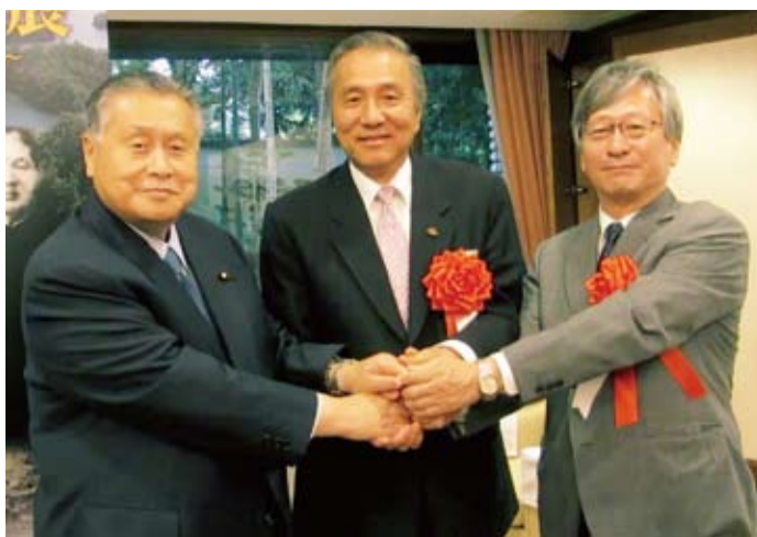
左起 日本前首相森喜朗、駐日代表馮寄台、交流協會理事長今井正

文化代表處馮寄台代表發起舉辦展覽會。5 月 8 日當天邀請了前日本首相森喜朗一同出席，來賓盛況空前。森喜朗在場也表示：對於同樣是石川縣出身的八田與一先生，長期以來一直受到台灣人的愛戴，感到相當的欣慰。同時也表示先前在電視上觀看春之園遊會，馮代表與日本天皇愉悅的對話，真的讓他覺得非常的感動。