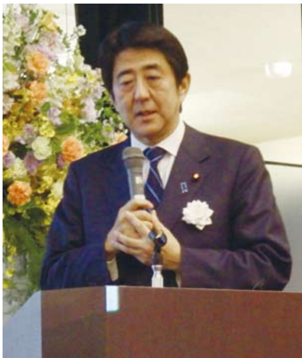
亜東親善協会の新会長に就任する安倍晋三元首相