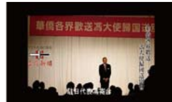
華僑各界歡送馮大使歸國送別會

【5/1～5/14にアップした動画】 http://www.youtube.com/user/taiwanpp