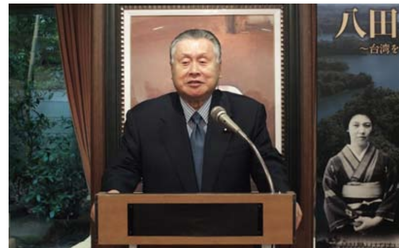
スピーチをする森喜朗元首相