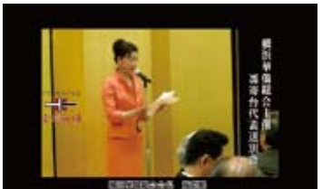
橫濱僑界 舉辦歌送會