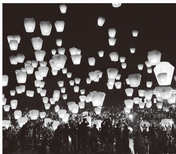
一斉に夜空に放たれる天燈

天燈と言えば毎年2月頃の元宵節に行われる「平溪国際天燈節」が有名だが、新北市十分では毎月1回、同市政府企画による合同天燈上げの観光イベント「十分好好玩～月月放天燈」が開催される。新北市政府によると、1回のイベントで上げる天燈は50個。毎回事前予約が殺到し、イベント当日にはキャンセル待ちの人数が現れるほどの盛況ぶりだ。