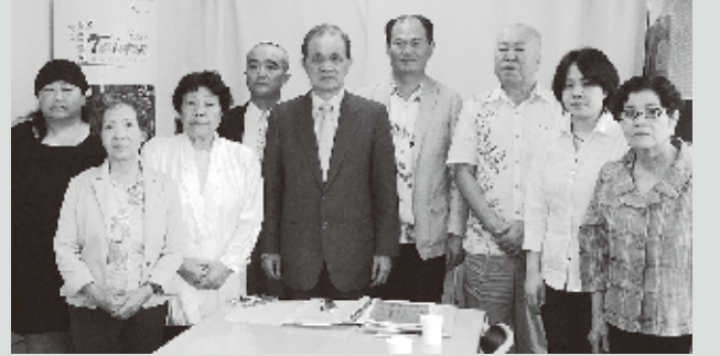
黄委員(左5)ら政府関係者と遺族たち

台湾の行政機関などを監督する監察院の黄煌雄委員ら台湾政府職員は5月13日、1947年の「2・28事件」に巻き込まれた沖縄県関係者の被害者遺族らと台北駐日経済文化代表處那覇分處で面会した。