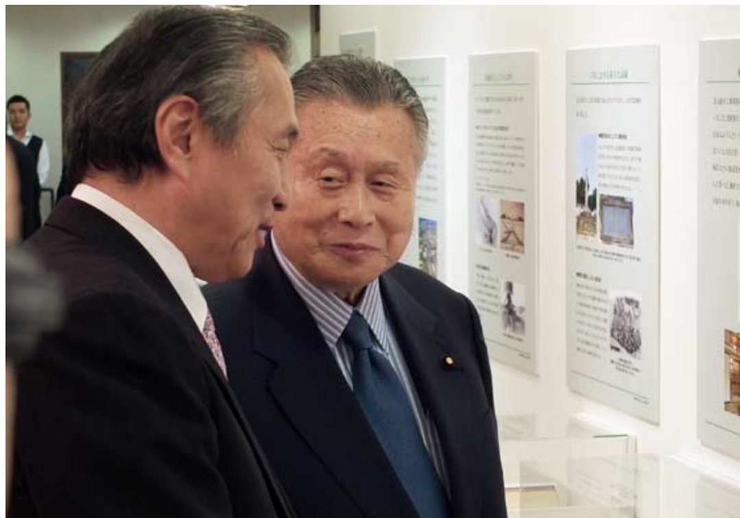
展示物を見学する森元首相と馮代表

5月9日から5月24日まで「八田與一展～台湾を愛した日本人～」が、台北駐日経済文化代表処公邸1階「芸文サロン」で開催されている。