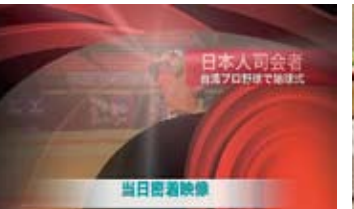
日本人即會者 / 台灣プロ野球地球式