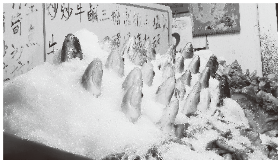
頭だけが出ている魚たち