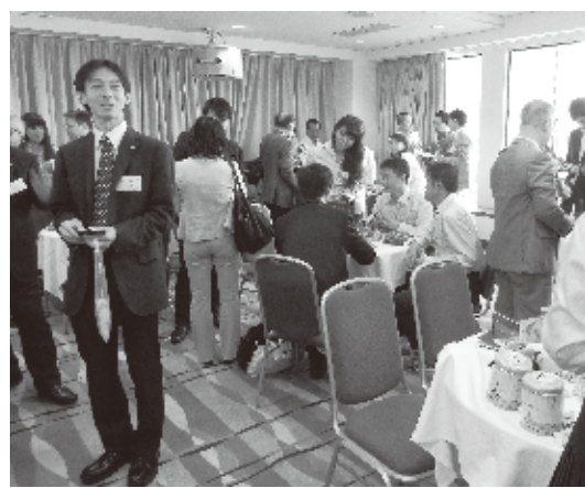
商談会が活発に行われた

台湾休閒農業發展協会が5月14日東京王プラザホテル(東京都新宿区)の最上階47階で、日本で初めての台湾休閒農場東京見学会を開催した。休閒農場とは、観光用の農場のことで、宿泊施設もあり、農業体験や動植物とのふれあひも体験できる。 台湾各地にある農場の中から、今回は台湾を代表する8つの農場の代表者ら約40人が来日した。台湾観光協会東京事務所後