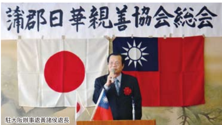
駐大阪辦事處黃諸侯處長

蒲郡日華親善協會於5月12日召開年度總會，駐大阪辦事處黃諸侯處長受邀出席。協會會長、前總務副大臣鈴木克昌眾議員藉此會議表示對台灣的感謝之意，去年311東日本大地震後，台灣人民的雪中送炭及踴躍愛心捐款，實為令人感動。當時為呼應台灣人民的積極協助，鈴木議員借秘書全力幫忙台灣捐贈抵日之醫療藥品及必需物質等貨櫃，並予分類送抵有需要之災區。此震災，增進了他對於促進台日關係之意志更加堅定。