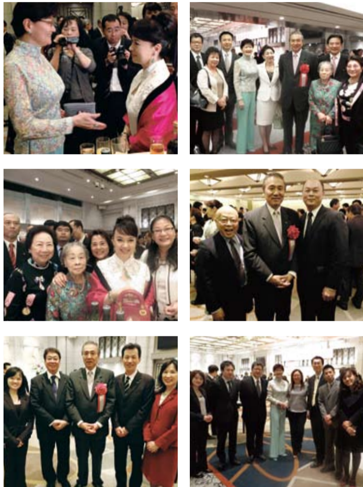
馮代表與在日華僑合照

中最高榮譽。他相信日本人的堅韌，一定會勇敢的渡過此震災。最後馮代表相信馬總統的帶領之下，台日關係必將持續穩固的發展。