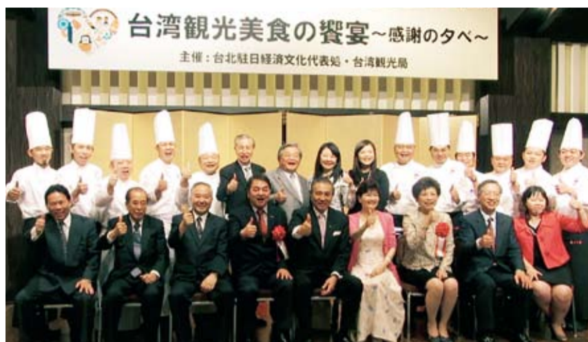
主辦單位台北駐日代表處、台灣觀光局及金牌廚師師父紀念合照

2011年若日本旅客超過125萬遊台，必定會帶領台灣金牌廚師來日本親自感謝日本旅行業界和媒體相關人士的承諾。更期許今年訪台日本旅客達到300萬人次。希望大家能夠一直支持台灣觀光業，為台灣再創旅遊新高。