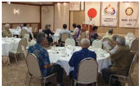
粘處長發表專題演講情形

在台日關係方面，馬總統於2008年執政以來台日關係發展迅速；2009年促成我國於札幌設辦事處、政治大學等5所院校，開設日本研究中心及實施台日打工度假簽證措施等；2010年簽署台日強化交流合作備忘錄，雙方設定15項加強交流領域；2011年日本國會通過海外藝術品保障法案後，我國故宮文物將於2014年6月首度來日在國立東京博物館展出；另2011年9月簽署台日投資保障協定、11月簽署開放天空協議後，加速台日新航線之開航等，