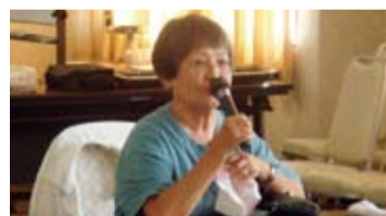
郭牧師娘 教育傳承