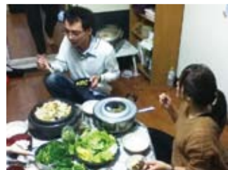
留學生大家一起吃飯 任何簡單的料理都變得非常好吃