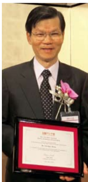
台灣中央研究院·翁啟惠院長

【本報訊】日本經濟新聞社為表揚對亞洲發展有所貢獻的人士，於5月23日在東京帝國大飯店舉行第17屆「日經亞洲獎」頒獎典禮。3位得獎人中其名單之一，為台灣中央研究院院長翁啟惠，亦是台灣獲得日經亞洲獎的第6位得主。翁院長是醣鏈化學領域研究的第一人，其研究成果對新藥及製造疫苗上具有極大之貢獻，榮獲科學技術獎。