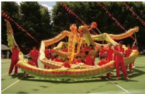
東京中華學校舞龍表演

【本報訊】東京中華學校為慶祝建校83週年，於6月10日舉辦運動會。在星期六還下著傾盆大雨，到星期日當天突然放晴，萬里無