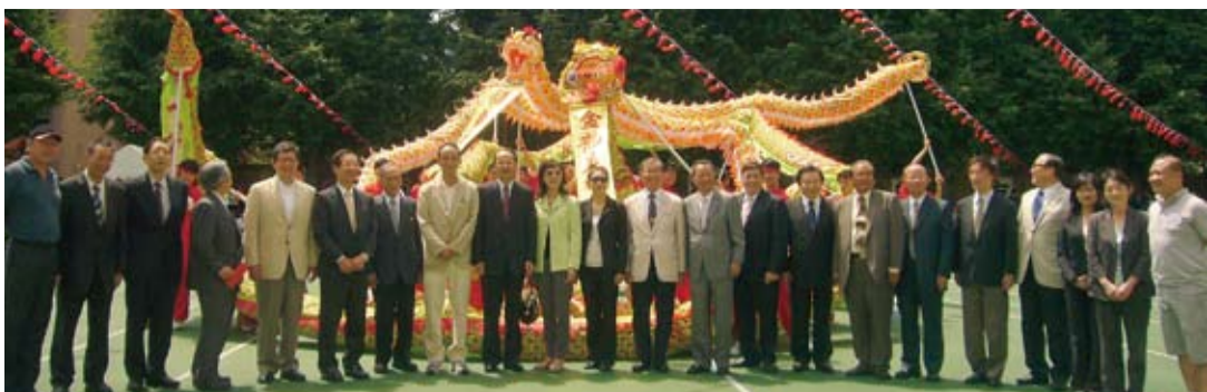
台北駐日經濟文化代表處代表沈斯淳賢伉儷偕僑領紀念合照