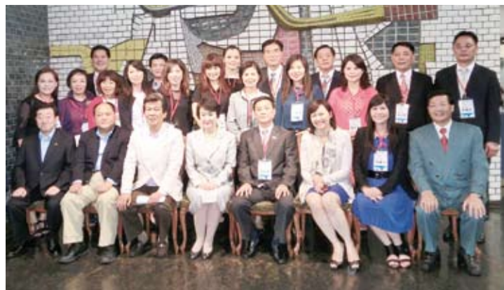
高雄市議會與橫濱市長及議員集體合影

高雄市議長許崑源及國民外交促進會會長陳麗娜等率領訪日團一行34名，於6月11日下午在駐橫濱辦事處處長李明宗陪同下抵達橫濱市政府及市議會進行首站之參訪，受到橫濱市長林文子、市議長佐藤茂及日華親善橫濱市會議員聯盟會長森敏明等熱烈歡迎。