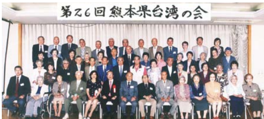
熊本縣台灣會出席人員全體合照