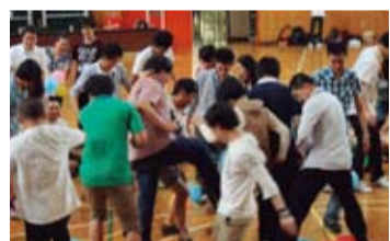
團體遊戲戰況激烈

卯足了全力在踩別組的氣球呢，沒參與的組員就在外圈裡面抓裡面的人的氣球，外圈的人一直看著內圈的大家一直在跳跳跳，讓大家笑的不亦樂乎！現在回想起來真的還蠻有趣的呢！