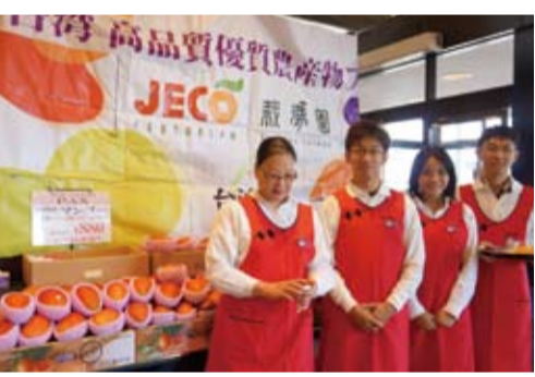
推廣台灣特產芒果會場

的台灣優質芒果表示美味也感到興趣，現場盛況熱烈。一連六天的博覽會後，7月16日株新亞商事接受記者會訪問。株新亞商事的員工及關係企業者皆到場出