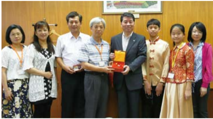
與吹田市副市長山中久德(右4)合影

成立於1996年的崇學國小國樂班，在全國比賽中獲獎無數，曾獲邀到中國演出。此次是第一次到日本演奏。一大早魏麗玲陪同葉校長及指揮黃清源拜會吹田市政府，由副市長山中久德接見。山中副市長簡介吹田市的歷史及特色，衷心歡迎崇學小學