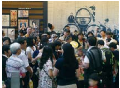
參觀朝日啤酒吹田工廠