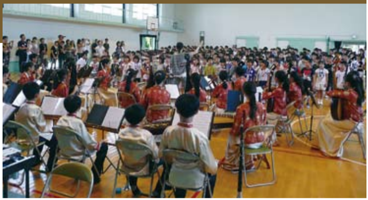
千里竹見小學全體師生以歌聲歡迎崇學國小

在體育館舉行的歡迎儀式，國領校長帶領小朋友以中文『大家好!』問候崇學國小師生，希望今天演奏、茶道體驗、營養午餐、校內打掃活動等一連串的活動，兩校小朋友能多交流，崇學國小師生能盡興而歸。日本小朋友以