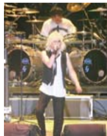
日本視覺系天團D'ERLANGER樂團壓軸登場，現場為之轟動

【本報訊／台北報導】2012年台灣貢寮海洋音樂祭，在一連五天的搖滾馬拉松之後，日本視覺系天團D'ERLANGER排在倒數第二壓軸，表演傑出，所有的樂迷為之瘋狂，讓整個現場high翻天。