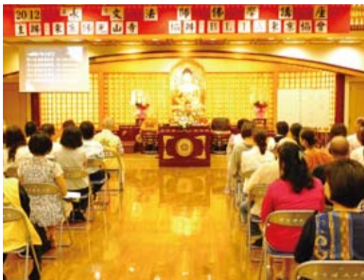
永文法師演講現場

「乃至在不歡喜的人面前」，都能正見以對感謝他的消災、鼓勵，並且祝福不歡喜的人。每天保有歡喜，「以竹影掃階不動；月穿潭底水無痕」，的禪定的境界，那就是般若。涅槃不是死亡，是不退失的歡喜，歡喜就是開悟。憑著信仰帶給自己的勇氣，讓自己走過人生逆