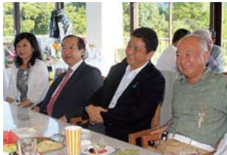
山口縣日台交流協會顧問現任參議院議員岸信夫(右二)

下共同合作擴大經濟效益。曾處長致詞時表示，台日兩國人民互信互助之精神誠為可貴，目前台日關係也是斷交40年以來最為良好的時候，並籲請與會人士今後