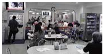
圖4、新宿東口捐血中心輕鬆悠閒的氣氛幾乎可以媲美咖啡廳或是便利商店!

接下來最厲害的地方要開始了! 請大家注意看圖中照片的左右兩端，這就是傳說中的”免費無限供