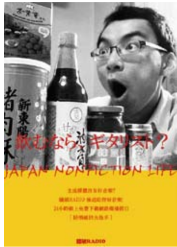
(請上網搜尋「陪酒吉他手」 24小時免費下載收聽網路廣播節目)

陪酒吉他手之JAPAN NONFICTION LIFE 免費!日本東京新宿 超省錢約會地點! 只要你血, 不要你錢! (*捐血一袋, 救人一命)