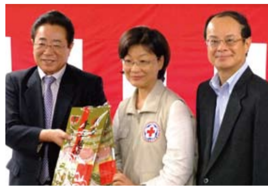
左起相馬市長立谷秀清，中華民國紅十字會會長王清峰，駐日經濟文化代表處代表沈斯淳

【本報訊】日本311震災後，於8月8日將台灣愛心捐款在災區福島縣相馬市援建的公營老人住宅-相馬井戶端長屋，舉行完工落成典禮。中華民國紅十字會總會會長王清峰、台北駐日經濟文化代表處代表沈斯淳、台北駐日經濟文化代表處秘書王建華、福島復興局局長諸橋喬明、日本赤十字社副社長大塚義治等人參與典禮。相馬市井戶端長屋，是特別針對災後獨居高齡者或銀髮夫婦規劃