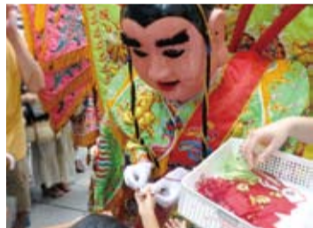
電音三太子發送三太子平安符