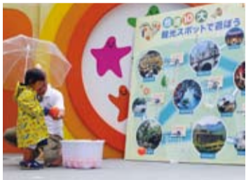
與小朋友進行投籃遊戲中