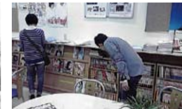
圖2、有雜誌也就算了，竟然連漫畫都有! 不愧是漫畫帝國日本啊!