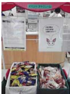
圖3、第一個免費的東西就是像這樣的小餅乾，請注意不要外帶喔!