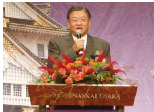
僑務委員會副委員長呂元榮