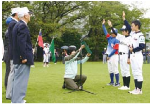
台日親善野球大會