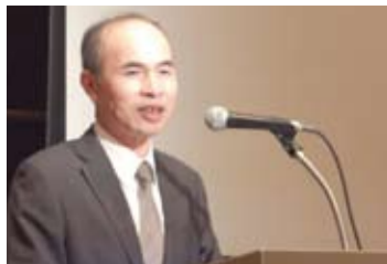
台北駐日經濟文化代表處余吉政副代表