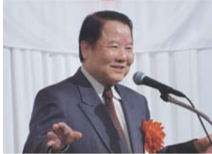
日本中華聯合總會名譽會長