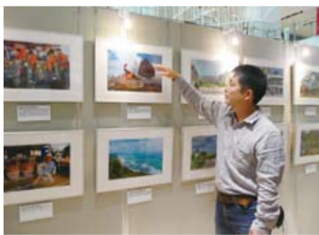
攝影師熊谷俊之向民眾解說作品

熊谷俊之表示，日本民眾可能常有機會在報章雜誌看到他所拍攝的小籠包或芒果冰，然而台灣最吸引他的其實是『人』。台灣