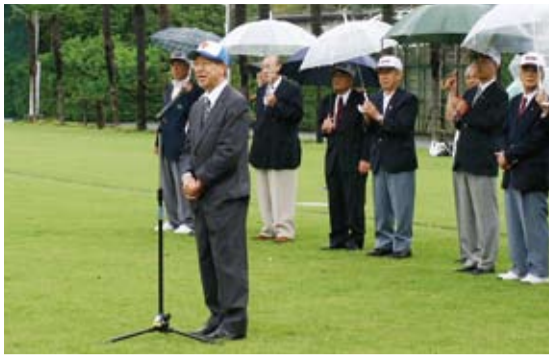
台北駐日經濟文化代表處副代表羅坤燦