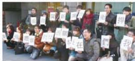
京阪神地區的留學生們手持標語表態支持反媒體壟斷

許多在海外各地的遊子為聲援台灣反媒體壟斷運動,包括在美國、埃及、中國等各地掀起「我在世界的角落,守護台灣新聞自由」的活動,大家以持標語拍照的方式,表達聲援,在日本的台灣留學生也分別在京都大學、名古屋大學、北海道大學等地舉行相關聲援活動。12月6日則在東