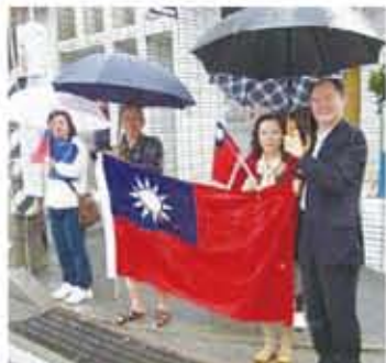
粘處長夫妻偕辦事處人員及僑民持國旗為台灣選手加油打氣