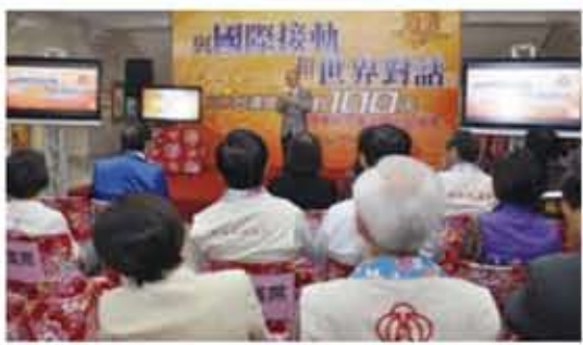
2013年台灣燈會榮譽主任委員省政府林政則主席參加記者會

【本報訊】由新竹縣主辦的「2013台灣燈會」，將於102年2月24日至3月10日，在竹北市高鐵新竹車站特定區舉行。日前，主辦單位特地選在燈會活動開始進入倒數100天的11月15日，舉辦「2013台灣燈會倒數100天暨台灣燈會紀念電台開台記者會」。新