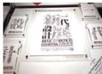
朱墨設計為2012年新一代設計展設計的海報