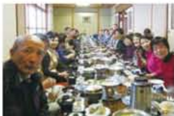
大家一起享用當季美食

首先，第一站來到靜岡縣伊東市的大室山，在千年前曾經爆發過的大室山現在是伊豆高原主要的自然景觀之一，也是伊豆高原的象徵。一行人登上大室山頂遠望天際，沿著火山口走了一圈，不僅看到了富士山，同時也眺望