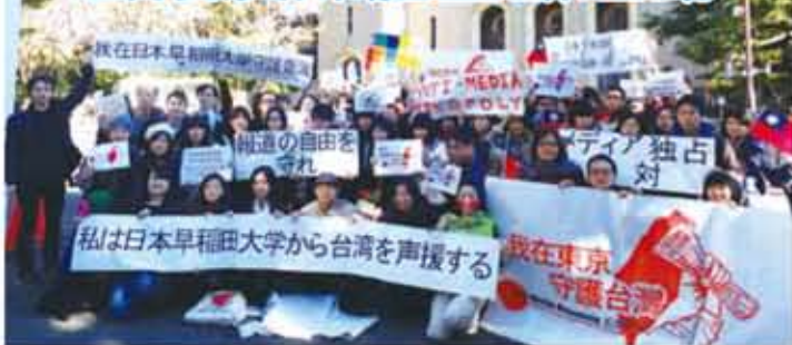
早稻田大學內聚集近60位在東京求學的台灣留學生,一同聲援台灣的反媒體壟斷運動