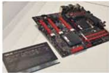
華碩電腦以ROG Maximus V Formula主機板獲選2012年的「Good Design Best 100」

獎後，再度獲得國際上的肯定。此外，今年同樣有傑出表現的華碩電腦，以BU400筆記型電腦和ROG Maximus V Formula主機板獲得「Good Design Best 100」，同時還有其他21項電腦、通訊產品獲得「Good Design Award」，代表出席的台灣代表吳宏傑和李宏諒（兩人皆為工業設計部產品設計專員）表示：今年可以獲得這麼多獎項，主要是因為華碩長期針對創新和研發花了很多時間，努力開發出讓使用者可以擁有更好的使用經驗和使用方式的產品，像這次獲獎的主機板，有點像魔術方塊的外型，就是為了讓使用者更容易組裝。