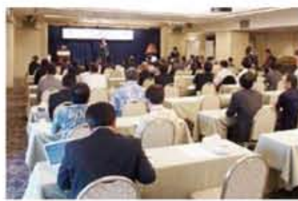
台琉論壇會場一景

這次台琉論壇中發表的專題包括「沖繩縣情報通信產業實施政策及未來方針」、「台灣NFC產業發展之課題與展望」、「行動NFC的市場趨勢和KDDI的施行方針」、「台灣之雲端服務與研發推動等」，此外，主辦單