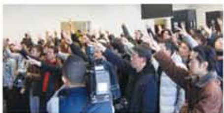
會場中有許多民眾特地前來參加猜拳活動

【本報訊】不管你對日本熟不熟悉,但你大概聽過「秋葉原」這個名詞,事實上它有著許多不同的含意,秋葉原是日本數一數二的電器街,同時也是宅男的天堂,更是動漫迷朝聖必到之地,還有不能忘記近年來超夯的AKB48正是發源於秋葉原,這些都是秋葉原多種面貌中的一種,總的來說,或許稱秋葉原為二次元文化發跡的地方更為恰當。