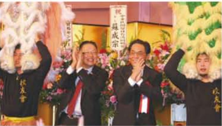
圖左起前賴會長、鄭會長與中華學校舞龍舞獅的互動