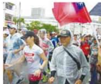
參賽選手起跑情形

【本報訊】由那霸市、南部市町村組合以及沖繩時報等單位共同舉辦，第28屆那霸馬拉松大會於12月2日在那霸市舉行，主辦單位特地於12月1日在那霸縣立武道館舉行開幕式，由那霸市長翁長雄志主持，駐那霸辦事處粘處長夫婦也應邀出席。