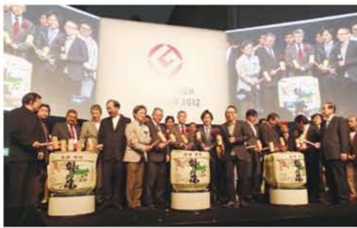
由審查委員長深澤直人和副委員長佐藤卓，帶領獲獎者和審查委員們一同預祝「Good Design Exhibition 2012」開幕

特別的是今年評審制度首度導入台灣、韓國兩地的就地審查制度，台灣的評審團則由名設計師