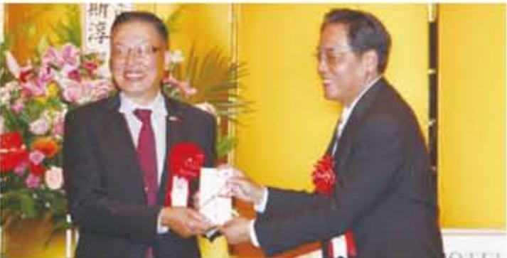
鄭會長贈前賴會長紀念品