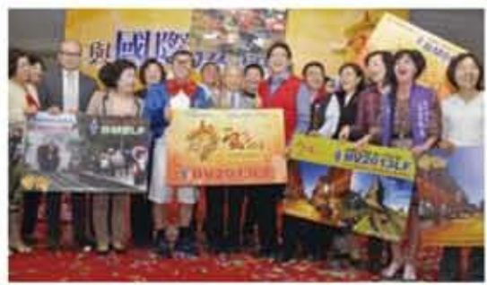
新竹縣各界邀請大家相約前來參與「2013台灣燈會」