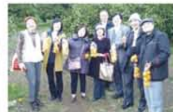
一同出遊的老師們留影紀念

到伊豆大島、天城山脈和伊豆半島遠近的风景。接著，大家前往「サンハトヤ大魚苑」餐廳享用秋季美食和泡海底溫泉(お魚風