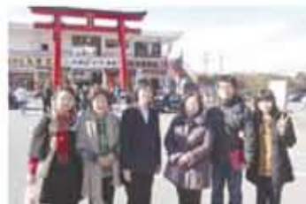
在採橘園裡親近大自然