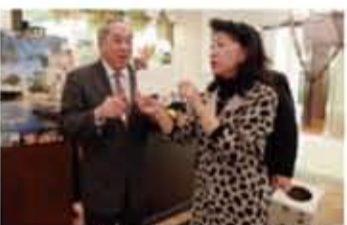
校長抽出台北日來回的機票大獎