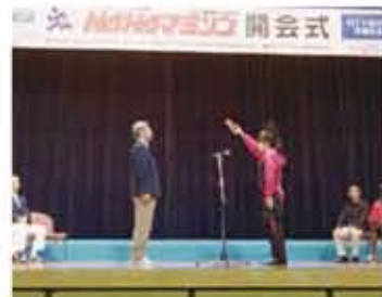
那霸市長翁長雄志市長(圖左)主持第28屆那霸馬拉松開幕式及選手代表宣誓