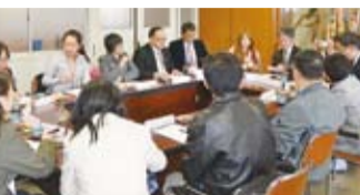
示範教學後的檢討座談會

國、中國、印尼等國家的大學生進行交流座談。此外，也前往大分縣、長崎縣、福岡縣境內參訪文教設施。