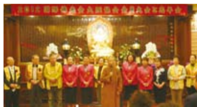
監寺永倫法師開示

阪佛光山得以與僑界互動、弘法、進行慈善服務。法師以七聖財『信、戒、慚、愧、聞、施、慧』及五福『長壽、富貴、康寧、好德、善終』向大家開示。