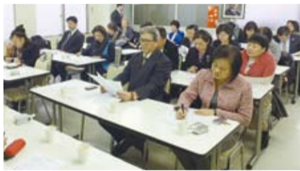
12月13日的總會籌備會議上來自大阪、沖繩等地的台商會理事皆出席參加

日本台灣商會聯合總會的成立是勢在必行，但現在距離總會創立時間所剩不多，如何集合所有事務繁忙的台商成員們，有效地在時間內完成改制的使命，這正考驗著所有各地區商會會長及僑界大老們的智慧以及組織能力。