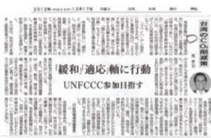
琉球新報刊登環保署署長沈世宏專文

例」，作為減碳行的法源依據。此外，馬英九總統也揭示：「打造低碳綠能環境」是國家發展五大支柱之一，其盼台灣能打造成「低碳綠能島」，並且在面對全球氣候變遷的狀況下，呼籲國際社會正視台灣希望參與聯合國氣候變化綱要公約（UNFCCC）的聲音與訴求，將台灣納入全球互助體系。而事實上，2011年11月在台灣舉辦的台琉論壇上，台沖雙方曾就共同合