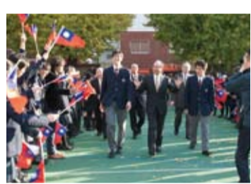
東京中華學校盛大歡迎校友王貞治返校訪問

演講會上王貞治表示：一定要重視團隊合作的精神，儘管現在還沒有找到夢想也沒關係，努力才是最重要的。一個人是沒辦法