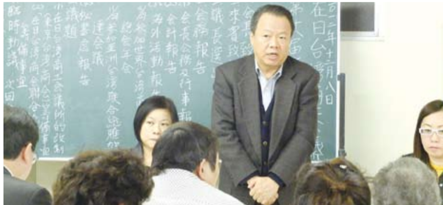
僑務部趙雲華部長列席參加12月8日的在日台灣商會議所理監事會

【本報訊】一直以來日本當地的台灣商會皆是各自為政，是由各地區成立商會來就近服務當地台商，但為了統合一窗口，來面對亞洲台灣商會聯合總會，因而有了組織改革的必要，進而牽動著各地區商會的組織結構，而且新成立的總會也必須具有足夠的號召力，可以讓各地區的商會集結。目前日本台灣商會聯合總會籌備委員會也希望能在明年4月順利成立總會，因此，在總會的成立與各地區分會的組織改革之下，現階段的台商組織猶如正處在兵分馬亂的戰國時期一般，只要稍有不慎，有可能徒勞無功。所以現在正處在牽一髮而動全身的關鍵時刻，各地區台灣商會勢必得更加團結，才能朝向整合為一的目標前進，讓日本台灣商會聯合總會成為更具規模及組織性的商會。