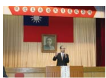
王貞治特別向學生提出團體合作的重要性

在社會上單獨生存的，所以一定得和其他人合作相處，或許現在台下的學生們不見得能聽懂我現在說的話，但經過1、2年之後，或許就能了解了也說不定。同時，也有許多學弟妹向王貞治提