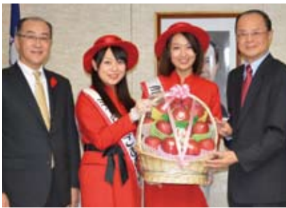
青森縣副知事與蘋果小姐一行人拜訪駐日代表處

道口感和品質，絕對具有世界頂級水準。」此外，佐佐木副知事也說明2012年青森縣知事三村申吾遠赴台灣推銷青森的蘋果，同時也參加12月16日在台北舉辦的台北馬拉松大會的FUN RUN活動，積極行銷青森蘋果。