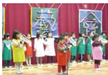
幼幼班的小朋友合作表演