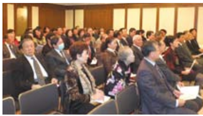
說明會上有多位僑團代表、僑務委員出席