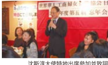
沈斯淳大使特地出席參加並致詞感謝世華會在日的辛苦耕耘