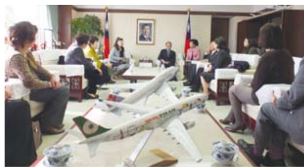
拜訪團一行人和沈斯淳大使一邊話家常，一邊討論台日交流的近況

沈大使也強調台日間剛簽署產業合作備忘錄，其中最重視的莫過於台日間中小企業的合作以及地方政府間的交流，沈大使表示：希望各地區的台商能多鼓勵當地政府知事或官員到台灣拜訪，像今年到10月為止就有9位正、副知事到台灣參訪，還有12月造訪台中的群馬縣知事，以及明年熊本縣和青森縣的知事也會去台灣參訪，或者也可以多推薦當地的學校到台灣進行修學旅行，多促進台日兩國之間體育或是文化的活動交流，以增進國民外交。