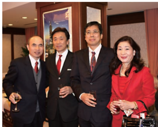
代表処余吉政副代表(左)と華僑団体の皆さん

面の交流促進(現在、台日間は毎週350便のフライトが実現)、第4は若者間の交流の促進(さまざまな分野の交流、修学旅行)を目指す。