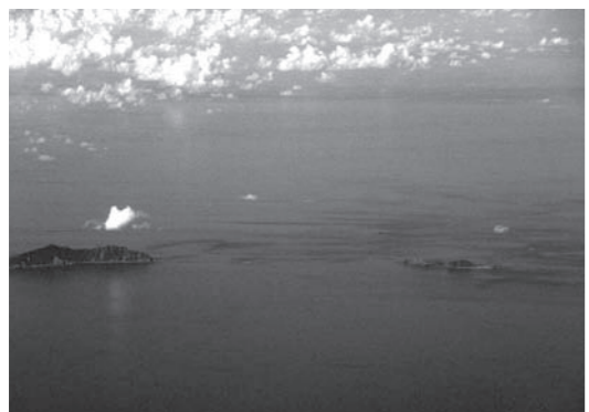
民間機から見た尖閣諸島 (写真)ウィキペディア

台湾の林永業外交部長は昨年12月24日、国会の委員会答弁で、懸案となっている日台漁業交渉の予備会合が年明けから2月頃になる見通しを示唆した。この日は具体的な日程を明らかにしなかったものの、水面下では日程調整していると補足した。