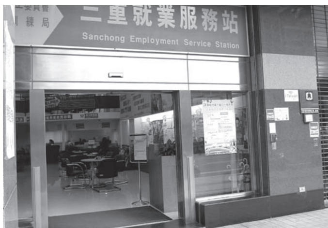
台湾の職業安定所「就業服務站」

行政院主計処が12月22日に発表した11月の台湾の失業率は、前月比0.06%減の4.27%となり(前年同月比0.01%減)、7月以