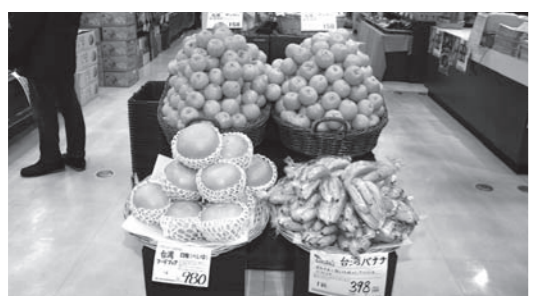
バナナ・ボンカン・べいゆ

台湾物産館(本店:笹塚)のオープンは2006年7月。親会社の池栄青果株式会社が台湾行政院農業委員会の東京でのアンテナショップ開設に際し、難易度の高い国際入札をクリアして委託運営事業の受注に成功した。背景には同社が台湾産マンゴーやパイナップルなどを長年にわたり、取り扱ってきたことがあった。