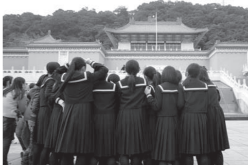
台湾へ修学旅行した熊本大津高校

大津高校関係者は「温暖な気候で天候にも恵まれ、順調に行程を消化することができた。街の中で台湾の人々が生徒達に親日的な態度で接してくれたことにも感謝したい。台北市内の自主行動では英語を使ってコミュニケーションを取る機会も生まれたため、語学の大切さを感じることもできた」と台湾で修学旅行を実施したことに対する収穫を語った。