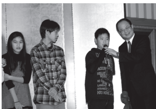
子どもたちにプレゼントを贈る沈斯淳代表

台北駐日経済文化代表処は、昨年の12月28日、「昭和の竜宮城」とも呼ばれた歴史ある宴会施設「目黒雅叙園」にて、忘年の集いを開催した。午後6時過ぎ、開宴の挨拶に立った沈斯淳代表は、大勢の代表処職員や関係者にねぎらいの言葉と新しい年に向けての抱負を語った。続いて羅坤燦副代表が乾杯の音頭を取った。