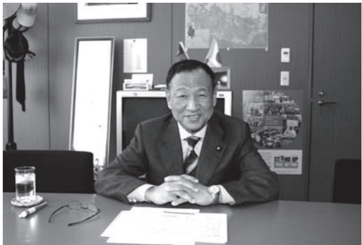
大江康弘参議院議員