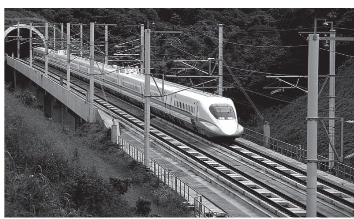
台湾高速鉄道700T型車両

高雄港に到着した第1編成はその後、12月26日から28日にかけてトレーラーにけん引され、時速33kmで高雄燕巢車両基地に輸送された。今後、安全面と性能面での試験や検査を行ない、今年7月の夏休みまでには営業運用に投入される計画だ。