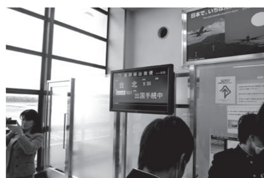
台湾へ向かう飛行機に搭乗する大津高校の生徒ら

達と交流会を開催。学校紹介のプレゼンテーション、バスケットボールや卓球のスポーツ交流試合、授業参観などを行い、親睦を深めた。その後、陸海空軍から選ばれた衛兵が忠烈祠の大門と大殿で行進しながら交代する衛兵交代式を見学。理数科はサイエンスパークを視察した。