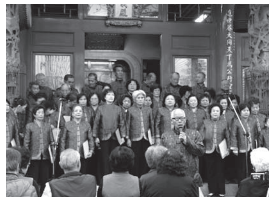
団体による詩の吟唱の様子

※台湾省政府…南投県は「台湾の臍」とも言われ、中央部に位置している関係で1950年代の一時、中華民国(台湾)の政府である台湾省政府が置かれていた。