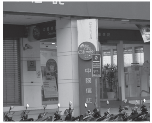
中国信託銀行(新北市内の支店)

中国信託HDの子会社、中国信託銀行は現在、第二地銀大手・東京スター銀行(旧東京相和銀行)の買収交渉を進めている。