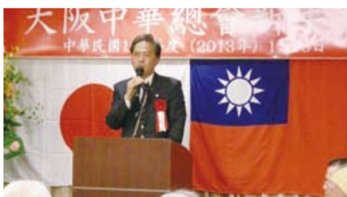
大阪府議會議長淺田均