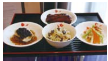
台北W飯店全球第一家中餐廳「紫艷」合作,為華航旅客量身訂做「時尚空中饗宴」第一季菜色

而針對經濟艙的旅客,華航也邀請國寶級的四大名廚,自2月起開始供應餐點,讓機上餐點更加多元化。