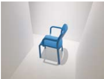
沒有標註多餘的作品解說，要觀展者從中自行體會，自己與藝術品的媒介關係