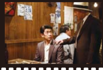
實力派演員永瀨正敏，演出片中棒球隊教練一角