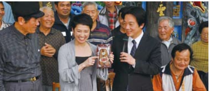
台南市長賴清德(右二)，贈送台南名產烏魚子給前來尋根的日本參議員蓮舫(左二)(照片提供：台南市政府)

【綜合報導】台裔日本民主黨參議員蓮舫及家人，於1月14日至17日到台灣進行私人訪問行程，並於16日在立法委員陳唐山的陪同下一起到台南白河，進行尋根之旅，期間台南市市長賴清德也抽空與蓮舫會晤。賴清德市長表示：蓮舫在日本參選國會議員，在東京曾獲得有史以來最高票得170多萬票，並曾擔任