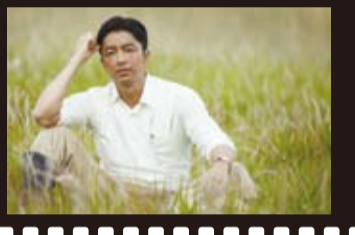
日本知名演員大澤隆夫在電影《KANO》中，飾演八田與一