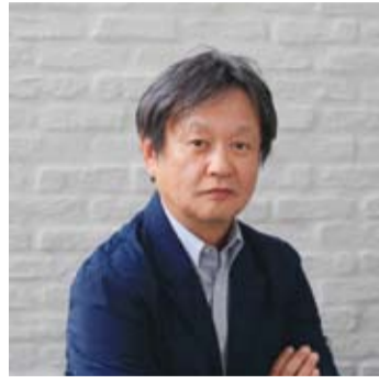
日本知名工業設計師 深澤直人