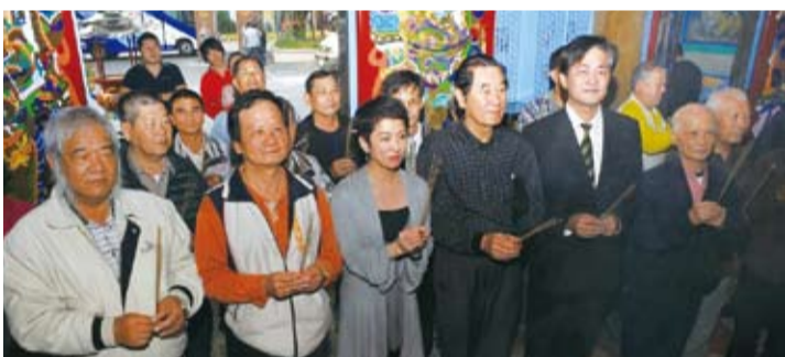
日本參議員蓮舫(左三)在立委陳唐山(左四)的陪同下，到白河福安宮參拜

由於該原作漫畫於2011年，在台灣發行時就深受讀者的喜愛，發行之初，更受到導演吳念真、作家張大春和在台發展的日本作家青木由香等人的推薦。而日前台灣導演蔡岳勳表示要將此劇翻拍成台灣版，此外也有台灣戲曲學院，近期將漫畫內容改編成舞台劇，預計將可以讓更多台灣觀眾體會到這部作品的魅力。