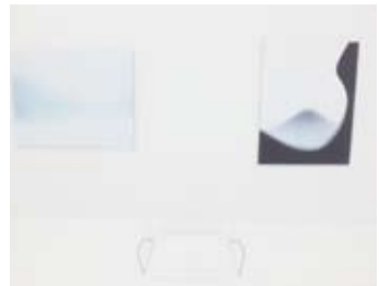
純淨潔白的展示空間，留給觀展者很大的想像空間