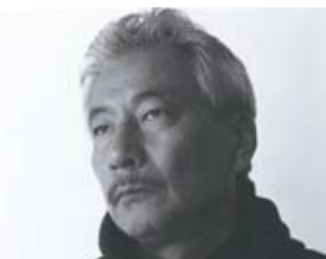
有「空氣設計師」之稱的攝影師藤井保