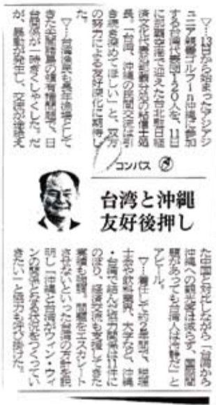
1月15日的沖繩日報上，刊登駐那霸辦事處處長的專訪

主張相關當事國應和平處理釣魚台問題，勿使東海紛爭擴大，並呼籲沖繩各界人士理解支持東海和平倡議的主張，創造雙贏關係。