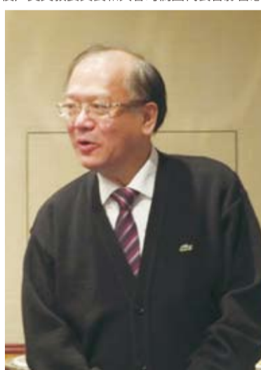
吳英毅委員長表示2月將再度訪日

首先，蘇成宗會長特別致詞感謝吳英毅委員長，在繁忙的行程中抽空來日參加活動，更期待吳委員長能再次抽空來日參訪。接著，吳英毅委員長也表示：因為蘇會長早在去年年中訪台時，便專程到僑務委員辦公室拜訪，並熱情提出邀約來日參加這次的68周年懇親大會，所以也特地安