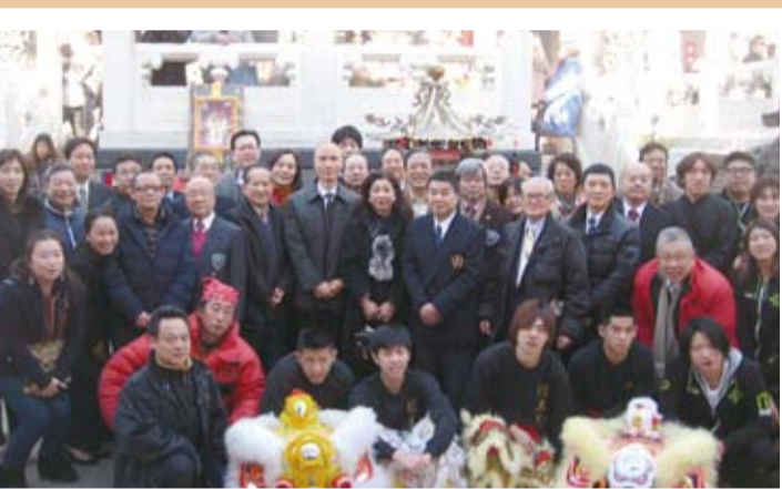
駐橫濱辦事處處長李明宗(左12、13)偕橫濱華僑總會會長施梨鵬(左15)及各僑團代表於橫濱關帝廟上香祈福

【本報訊】為迎接新的一年到來，橫濱地區有近千名華僑和日本遊客聚集於橫濱媽祖廟及橫濱中華學校操場齊聲倒數，而駐橫濱辦事處處長李明宗夫婦與辦事處同仁，也一同參加跨年晚會慶祝活動，隨後並於1月1日上午偕