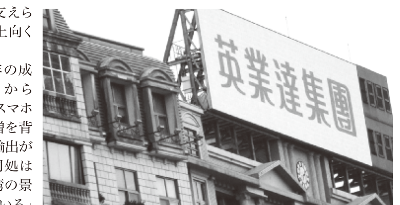
昨年はIT関連事業が低調だった

主計処では、今年通年の成長率を従来の3.15%から3.53%に上方修正した。スマホやタブレット端末の需要増を背景に、関連業界の投資や輸出が活発になると見ている。同処は「あらゆる経済指標が台湾の景気の力強い回復を示している」と強調。一方、世界経済の成長の勢いはなお弱い、との見解を示した。また、主計処は2013年のインフレ率見通しについても従来の1.27%から1.31%に引き上げた。