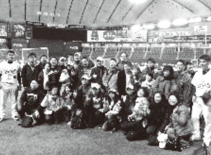
野球を通じた交流

かつての中華職棒 東京ドームで「日本対台湾」の代表戦を見ながら、台湾の野球に対する想いを想起していた。私自身、以前から中華職棒に注目していた。郭泰源や呂明賜は日本のプロ野球で活躍し、彼らは帰国後も、台湾プロ野球界を牽引する存在となった。私は学生の頃、台北や台中を旅行し、プロ野球の試合をテレビでも現場でも観戦したことがある。洪一中や林易增らが活躍。応援も華やか、夜市にも通じるきらびやかさである。林威助らに取材する機会も得た。林は日本で活躍する選手だが、国境を越えて活躍する選手存在にこそ、「台湾と日本の交流」の原点を見る気がした。 逆のパターンもある。高津臣吾や正田樹など日本のタイトルホルダー、スター選手が台湾でプレー。私は高津、正田、両投手ともに台湾の球場でインタビューを行ったが、海外ならではの開放感、異国だからこそ感