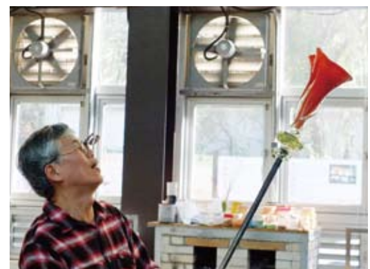
吹きガラスで作られた大きな花瓶

ため、新竹公園内には「ガラス工芸博物館」があり、新竹ガラスの歴史を今に伝えている。今回で9回目の開催となる「新竹市国際ガラス芸術祭」は、約2年に一度行なわれており、今年で19年目となる。