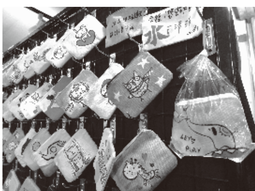
ペイントグッズは全てが水洗い可能。色落ちしない塗料を見つけるのに苦労したそう

多し」とし、また、士林夜市で屋台店舗を営むには2坪でひと月3万5千円の利用費が必要なこと、快適な環境が整っている中山地下街へ移転する事になったと言う。現在では常連客やシンガポール、香港、日本からの観光客も訪れ、お土産やプレゼントとして、複数個購入して行く人が多いと言う。また「観光客で言えば、士林夜市の方が数は多いが、地下街の方が購買意欲の高い人が多い」と言う発見があったことも明かしてくれた。