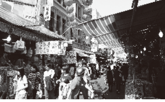
平日の午前中にも多くの買い物客で賑わう

乾物や珍味などの食料品や生活用品のお店が連なる台北市迪化街では、旧正月用品を買い求めにくる多くの人で賑わっている。一家団圓を重視する台湾では、旧正月に向けて多くの食料を準備し、家族で味わうという風習が存在し、この時期の迪化街は「年貨大街」とも呼ばれ、終日、買い物客が押し寄せている。今年の「年貨大街」は2月10日の旧正月に合わせて1月25日から行なわれている。迪化街のある地区は「大稻埕」と呼ばれ、日本統治時代以前には「艋舺」、「城内」と並び、台北の中心地的存在であった。縁結びの神様としても知られる城隍廟や、寧夏夜市もこの近くにあり、日本人観光客にもおなじみの場所だ。「年貨大街」期間中の賑やかさは東京のアメ横を彷彿とさせる。迪化街に足を踏み入れると、商品の陳列方法に圧倒される。店頭には大きな袋に入れられた食材が大量に置かれ、威勢のいい元気な店員さんが声をかけてくる。多くの食材が試食できるため、実際に味を確認してから買うことができる。台湾独特の乾物も多いため、新しい食材に出会うチャンスもある。ナッツを販売していた女性店員は「日本人のお客さんもたくさん来ていて。ピーナッツが好きみたいね」と話す。お勧めはと聞くと「わさび味のヘーゼルナッツはピリリとして美味しい」と答えてくれた。お菓子を買いに来たという台北在住の日本人女性は、カシューナッツとクルミを1kgずつ購入し、直切り交渉の結果「1160元を1000元にしてもらった」と喜びを語ってくれた。また、その様子を見ていた台湾人女性は「ささず女将さんに対して「この子に安くしたのなら、私にも安くしてよ」と声をかけ、店頭はひときわ賑やかになった。ドライフルーツを売る男性は「ドライアップルが美味しいよ」と言って試食を勧め、また「袋に入れてしっかりと空気を抜いておけば、常温でも3ヶ月は持つ」と教えてくれた。迪化街「年貨大街」は旧正月直前の2月8日まで行なわれ、旧正月の準備に急ぐ人々を迎え入れる。夜市とは違った台湾の庶民生活を体験できる場所である。