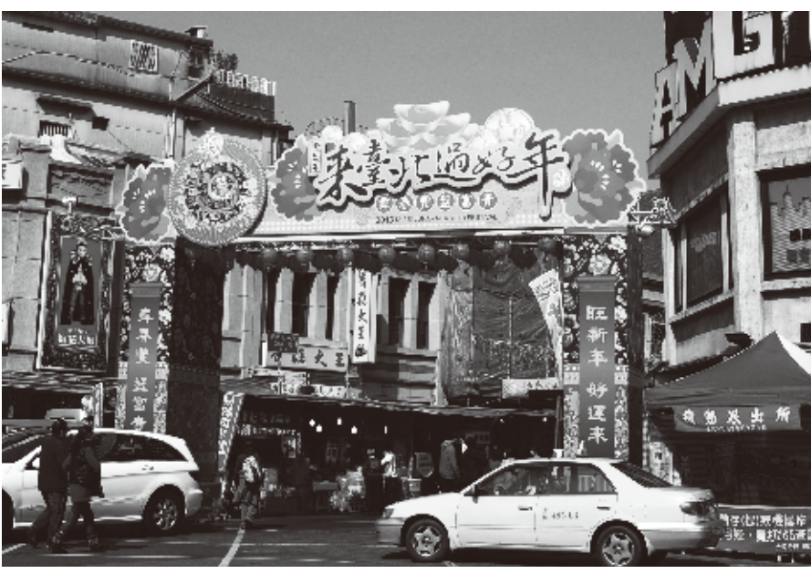
迪化街の入り口は南京西路にあり、MRT中山駅から徒歩10分ほど

乾物や珍味などの食料品や生活用品のお店が連なる台北市迪化街では、旧正月用品を買い求めにくる多くの人で賑わっている。一家団圓を重視する台湾では、旧正月に向けて多くの食料を準備し、家族で味わうという風習が存在し、この時期の迪化街は「年貨大街」とも呼ばれ、終日、買い物客が押し寄せている。今年の「年貨大街」は2月10日の旧正月に合わせて1月25日から行なわれている。迪化街のある地区は「大稻埕」と呼ばれ、日本統治時代以前には「艋舺」、「城内」と並び、台北の中心地的存在であった。縁結びの神様としても知られる城隍廟や、寧夏夜市もこの近くにあり、日本人観光客にもおなじみの場所だ。「年貨大街」期間中の賑やかさは東京のアメ横を彷彿とさせる。迪化街に足を踏み入れると、商品の陳列方法に圧倒される。店頭には大きな袋に入れられた食材が大量に置かれ、威勢のいい元気な店員さんが声をかけてくる。多くの食材が試食できるため、実際に味を確認してから買うことができる。台湾独特の乾物も多いため、新しい食材に出会うチャンスもある。ナッツを販売していた女性店員は「日本人のお客さんもたくさん来ていて。ピーナッツが好きみたいね」と話す。お勧めはと聞くと「わさび味のヘーゼルナッツはピリリとして美味しい」と答えてくれた。お菓子を買いに来たという台北在住の日本人女性は、カシューナッツとクルミを1kgずつ購入し、直切り交渉の結果「1160元を1000元にしてもらった」と喜びを語ってくれた。また、その様子を見ていた台湾人女性は「ささず女将さんに対して「この子に安くしたのなら、私にも安くしてよ」と声をかけ、店頭はひときわ賑やかになった。ドライフルーツを売る男性は「ドライアップルが美味しいよ」と言って試食を勧め、また「袋に入れてしっかりと空気を抜いておけば、常温でも3ヶ月は持つ」と教えてくれた。迪化街「年貨大街」は旧正月直前の2月8日まで行なわれ、旧正月の準備に急ぐ人々を迎え入れる。夜市とは違った台湾の庶民生活を体験できる場所である。