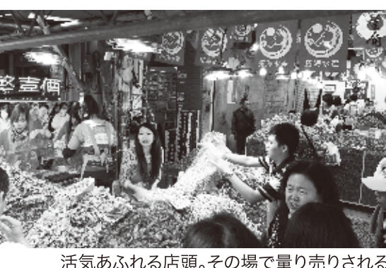
活気あふれる店頭。その場で量り売りされる