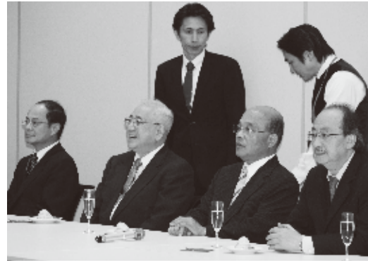
沈斯淳代表(左)と民進党民進党の蘇貞昌主席(右2人目)一行