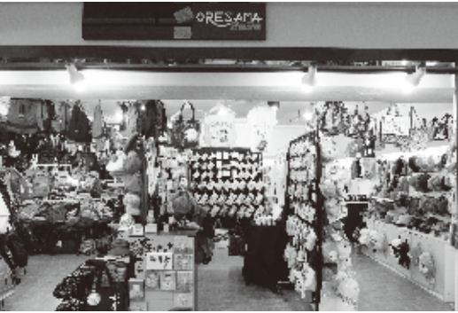
僅か2坪ほどの空間にびっしりと陳列された商品。この狭さも台湾ならではの

MRT台北駅と中山駅を繋ぐ中山地下街にある「Oresama創意倉庫」は、鮮やかで可愛い手描きのイラストが描かれたグッズを販売している雑貨店である。台湾に旅行で訪れると、街中で色とりどりの雑貨やアクセサリが売られているのを目にする事があるだろう。今回は、中でも個性的なペイントグッズで多くの人を引きつけるアーティストにインタビューし、ご自身の考え方や、台湾らしいビジネススタイルに関してお話を伺った。