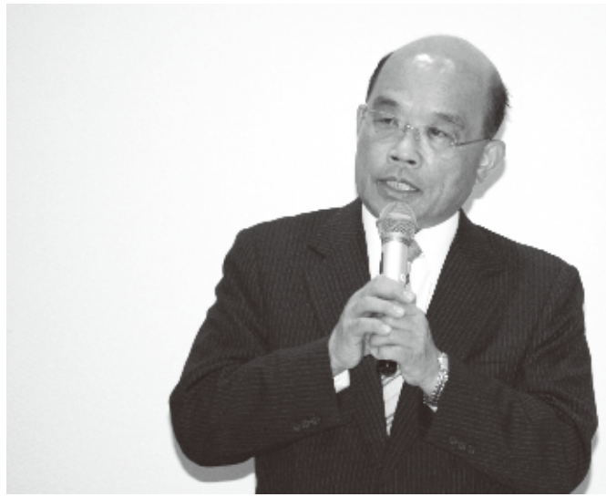
民進党の蘇貞昌主席

台湾の最大野党民進党の蘇貞昌主席一行は3日昼に来日し、翌4日、衆議院第一議員会館多目的ホールで「日華懇員懇談会」(日華懇)の平沼赳夫会長(日本維新の会)らと会談した。主に日台関係の緊密な連携の必要性などが話し合われた。日華懇は台湾との間で友好関係の促進をめざす日本の超党派