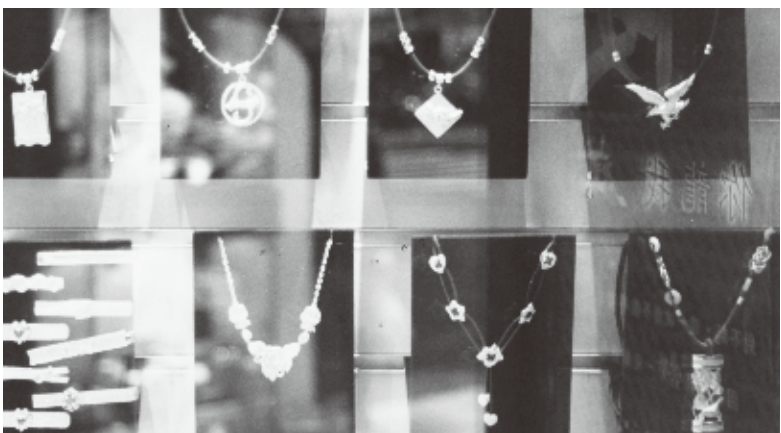
チョーカーの先を飾るのは豪華な黄金の宝飾

金(きん)が装飾にとどまらず、一大財産としての価値を持つことは、たとえばかつて香港の中国返還時に、香港人が金銀をまとめて身