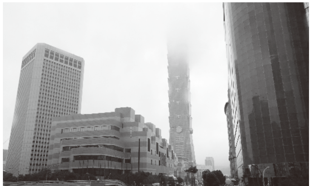
どんよりとした雲に覆われる台北101

台湾は中部の嘉義、東部の花蓮を通る北回帰線を境に、北部が亜熱帯気候、南部が熱帯気候に属している。緯度的にも沖縄本島より南に位置する台北は、冬でも暖かいというイメージを抱いている人もいるだろう。実際、2月第一週は好天に恵まれ、最高気温も25度前後と、汗ばむ陽気となった。しかし、それは晴れた日の場合であって、分厚い雲がひとたび太陽を覆い隠してしまうと、寒さとの戦いを強いられることになるのは意外と知られていない。