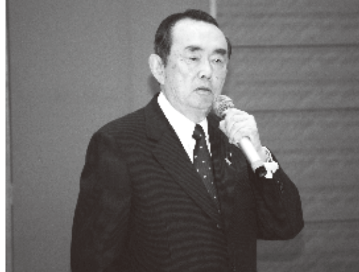
日華議員懇談会の平沼赳夫会長