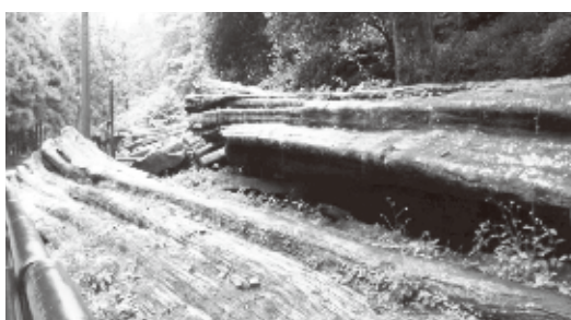
枯死した状態の神木

タイワンヒノキ(紅檜)の原生林としても知られる阿里山。以前は大量に伐採され日本にも運ばれていた。阿里山の紅檜は東京明治神宮の大鳥居や伊勢神宮など日本の神社仏閣にも使われている。訪れた観光客は連綿とした木々に心癒される。最近の「台湾ブーム」により、日本からの観光客は更に増加傾向にある。