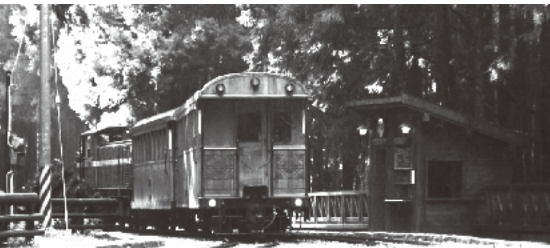
世界三大山岳鉄道の阿里山森林鉄道

阿里山は東アジア最高峰、玉山(3952m)の西方に連なる2000m超の山塊の総称。香り漂う樹齢数千年の巨木群歩道の散策や祝山などでの日の出見物が観光のメインだ。国家風景区(国定公園)に指定されており、そのうちの1400ヘクタールが「阿里山国家森林遊楽区」となっている。第二次世界大戦前の日本統治下では、玉山とともに「日本の国立公園」に指定されていた。阿里山は「鉄道、森林、雲海、日の出、夕霞」という五つの見所が有名だ。