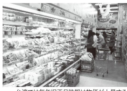
台湾では毎年旧正月時期は物価が上昇する(新北市内のスーパーにて)

これに対し政府・公平会は1月21日、「市場取引の秩序を守るため、すでにこの件で関係ある労働組合に対し、価格決定の際の規定を守るよう通知している。また、各種の正月商品