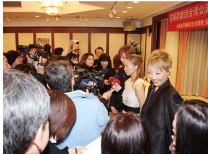
マスコミの質問に答える宝塚歌劇団の皆さん