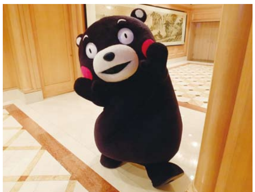
くまモン営業部長

熊本県は1月24日、観光の認知度向上と農林水産物等の販路開拓のため来台し、初日に航空会社に対する売り込みや現地旅行会