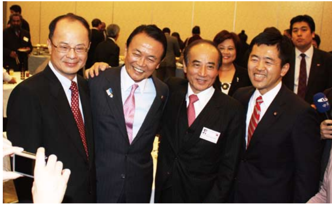
3月25日(前日)の歓迎会で、沈斯淳代表(左)、麻生太郎副総理(左二人目)

アジア・太平洋国会議員連合(APPU)年次総会に出席した超党派の台湾代表団(団長:王金平立法院長)は3月26日、日華議員懇談会(日華懇)が開催した歓迎会に台北駐日経済文化代表処の沈斯淳代表らとともに出席した。