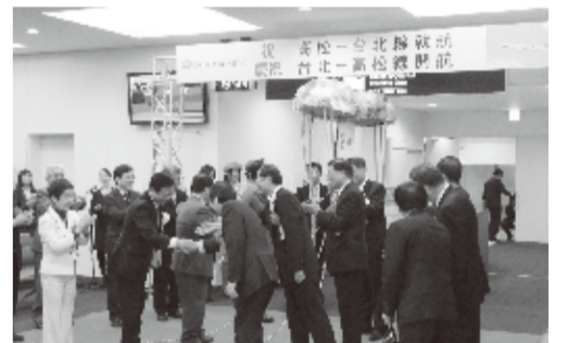
テープカットで就航を祝った

テープカットを行った後、チャイナエアライン孫社長から香川県浜田知事に記念品が手渡された。第1便の搭乗客132人には記念品が贈呈され、その後機内へと乗り込み、飛行機は台北へ向け出発した。運行機材はボーイング787-800で高松—台北間を約2時間40分で結ぶ。木、日の週2便のフライトで、高松を夜7時50分に出発、台北には夜9時30分に到着。帰りの台北発は午後3時15分で、高松には夜6時50分に到着する。