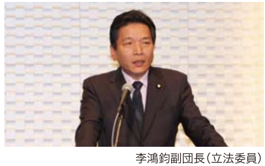
李鴻鈞副団長(立法委員)

WEBでもニュース記事が読めます http://blog.taiwannews.jp