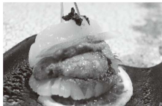
ウニとキャビアのホタテパーガー焼そば

交流協会は3月23日、台北市のブリーズセンターで「日本当地魅力大集合～在地美食inTaipei～」を開催した。このイベントには、昨年11月に開催した「B-1グランプリ第7回北九州大会」でゴールドグランプリを受賞した「八戸せんべい汁研究所」など東北6県の代表ご当地グルメを紹介する6団体も参加。作り立てのご当地グルメが来場者に無料で振る舞われた。 今回のイベントに参加したのは青森県八戸市「八戸せんべい汁研究所 八戸せんべい汁、岩手県岩手町「いわてまち焼きうどん連合隊 いわてまち焼きうどん」、秋田県横手市「横手やきそばサンライズ 横手やきそば」、宮城県石巻市「石巻茶色い焼きそばアカデミー 石巻焼きそば」、山形県河北町「かほく冷たい肉そば研究会 かほく冷たい肉そば」と福島県浪江町「浪江焼麺太国のみみえ