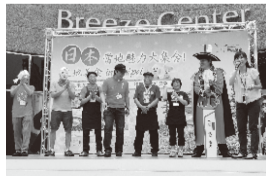
青森、岩手、秋田、宮城、福島の参加団体代表ら

交流協会は3月23日、台北市のブリーズセンターで「日本当地魅力大集合～在地美食inTaipei～」を開催した。このイベントには、昨年11月に開催した「B-1グランプリ第7回北九州大会」でゴールドグランプリを受賞した「八戸せんべい汁研究所」など東北6県の代表ご当地グルメを紹介する6団体も参加。作り立てのご当地グルメが来場者に無料で振る舞われた。 今回のイベントに参加したのは青森県八戸市「八戸せんべい汁研究所 八戸せんべい汁、岩手県岩手町「いわてまち焼きうどん連合隊 いわてまち焼きうどん」、秋田県横手市「横手やきそばサンライズ 横手やきそば」、宮城県石巻市「石巻茶色い焼きそばアカデミー 石巻焼きそば」、山形県河北町「かほく冷たい肉そば研究会 かほく冷たい肉そば」と福島県浪江町「浪江焼麺太国のみみえ