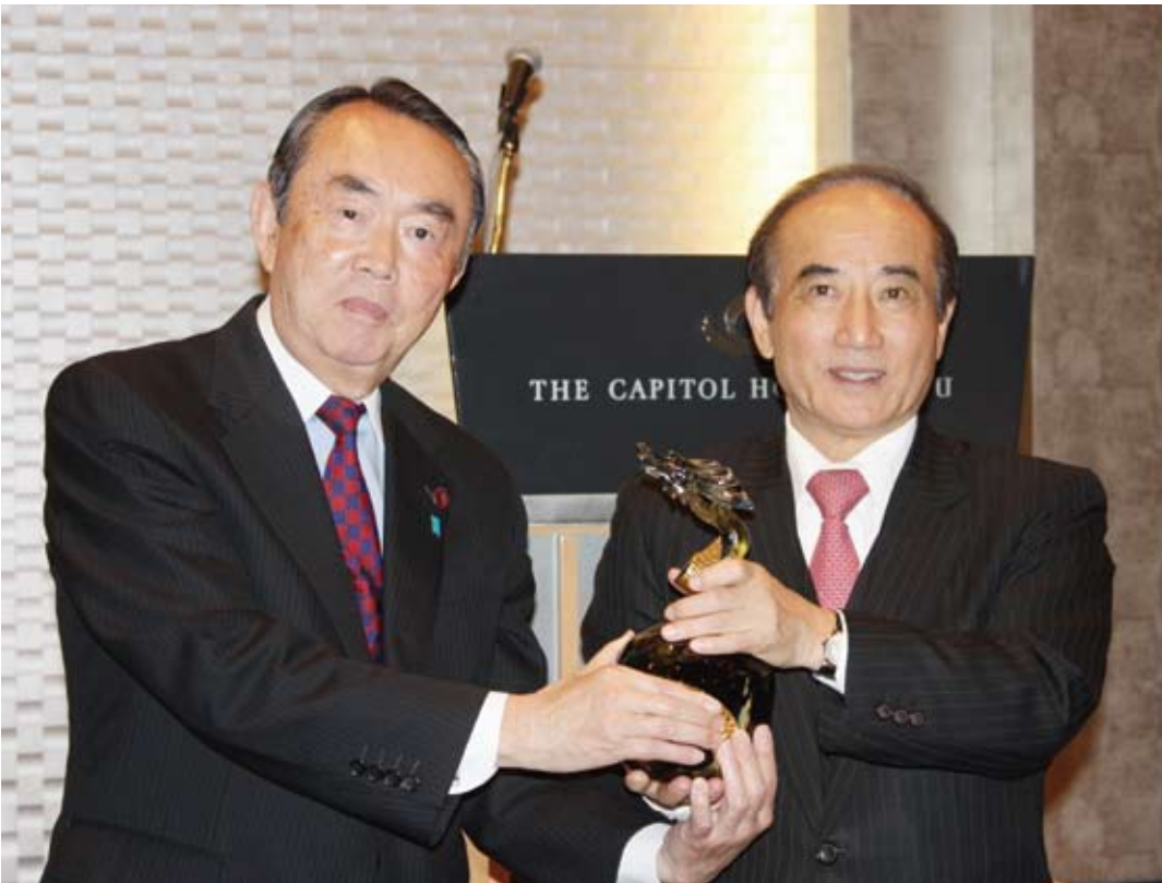
記念品交換を行う平沼超夫日華懇談会会長(左)と王金平立法院長(右)