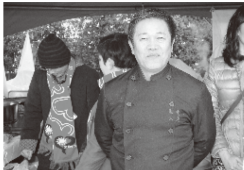
大阪「春節祭」京都華僑総会ブースで

で、元お茶屋の町家でいい物件があると。「ここでもう一回やってみるか」と考えたのが創作中華だったわけです。 Q創作中華とは A中華料理といっても同じじゃダメ。基本を勉強してきたもので、いろいろアレンジしてやってみよう。町家に中華はなかったんですね。ただ、京都の人は厳しくて、「あなたは中華街では通用するかもしれないけれども、京都では通用しません。日本料理、京料理を勉強しろ」と言われたわけです。分かってきたのは、関東は味が濃くて出汁が薄い。京都は味が薄いけれども出汁がきっちり出ているんですね。それと井戸水を使っていますね。そこで、初めて京都風のアレンジをしてやろうと思って。さらにアレンジを加えていくうちに次第に店の名前が知られるようになっていったわけです。 Q事業が拡大しているが A全国30店舗ぐらいをプロデュースしましたし、今もチェーン展開しています。また、投資案件が増えてきています。台湾、香港、中国の投資家がお店をやってくれと、台湾では今年11月、台北101の86階に500坪の僕のお店が出ます。そういう形で上海でもというふうに広がっています。 Q多くの顧問をしているが A料理の関係では、世界中餐厨交流協会 専科委員会副会、社団法人日本中国料理協会京都支部幹事、中華美食交流協会海外理事、台湾米其林厨師會(台湾ミシュラン)海外理事、台北市牛肉麵大使、世界中国料理連合会国際評議員、一般社団法人全日本・食学会理事などがあります。華僑関係では、中華民国僑務委員会僑務顧問、中華民国留日京都華僑総会副会長となっています。 Q著名人の来店について Aここまでにするのに16年かかっています。お陰様で政財界や芸能人の方なども見られます。ただ、サインもないし、写真も撮りません。お店のコンセプトは、かきこまてサービスするのはなく、町家ならではのアットホームなスタイルを大事にしようというものです。「お家でごはんを食べる形にしよう」と。ですからお客様は皆、同じように接客させていただいています。