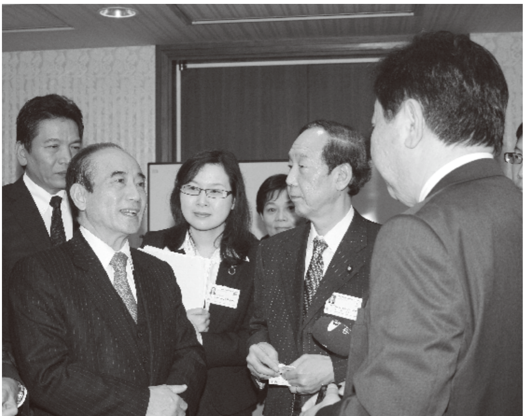
挨拶を交わす王金平立法院長(左)と野田佳彦前首相

APPUは1965年(昭和40年)に岸信介首相有志の提唱を受け、趣旨に賛同したアジア諸国により創設された「アジア国会議員連合」を前身としている団体。背景に当時のアジア地域の冷戦構造があり、議員外交の場を設けることによって自由と民主主義に基づくアジアの平和と安定を目的としていた。その後、加盟国が増えて太平洋島嶼国も加盟。1980年に「アジア・太平洋国会議員連合」(APPUPacificParliamentarians'Union)に名称を変更した。 APPUは理事会と年次総会から構成されており、今年は3月25日～27日の会期で行われた。これに参加するため、台湾の代表団一行が24日、来日した。超党派13人からなる一行の団長に王金平・立法院長(国会議員)