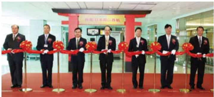
台北岡山首航剪綵儀式，圖左起為：移民署國境事務大隊隊長林興春、航空警察局局長黃富生、民航局副局長方志文、桃園機場公司董事長尹承蓬、日本交流協會副代表佐味祐介、財務部關務署台北關關務長陳錫鏞、長榮航空總經理鄭傳義