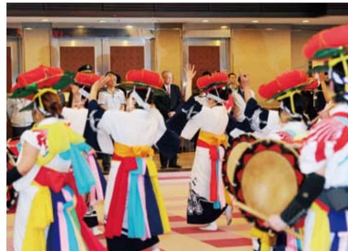
副總統出席「臺日鼓舞節」，欣賞臺日文化團的歌舞及擊鼓表演

現場除了精采的鼓舞表演外，主辦單位還安排了台灣小吃與日本B級美食的PK賽，和日本東北觀光物產展等活動，讓民眾在欣賞表演之餘，也能品嚐到台日兩地的美味小吃。