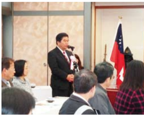
駐福岡辦事處戎義俊處長以締約見證人身分致詞祝勉雙方友誼長存