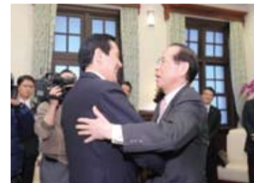
馬英九總統與日本交流協會會長大橋光夫互相擁抱

【本報台北報導】台日漁業會談於1996年首次召開以來，17年間歷經16次正式會議、多次預備會議及協商，在今年魚汛來臨之際出現重大突破發展。