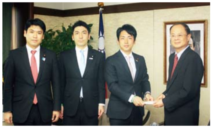
自民黨青年局局長小泉進次郎(右2)拜會駐日代表沈斯淳(右1)，並致贈慰問327南投地震災

駐日代表沈斯淳表示：這次327南投地震造成了人員傷亡，交通也因此受到影響，而政府當局也立即成立緊急應變小組，進行各項救災工作。沈代表並對自民黨青年局議員們捐贈善款的義行表示感謝。