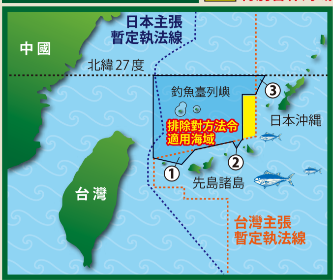
①~③為台灣漁民作業擴大海域，共計約1,400平方哩(約4,530平方公里)

在協議以外的北緯27度以北、先島諸島以南的海域，以及釣魚台列島12哩內的區域管理，也會落實在漁業委員會進行後續的協商。