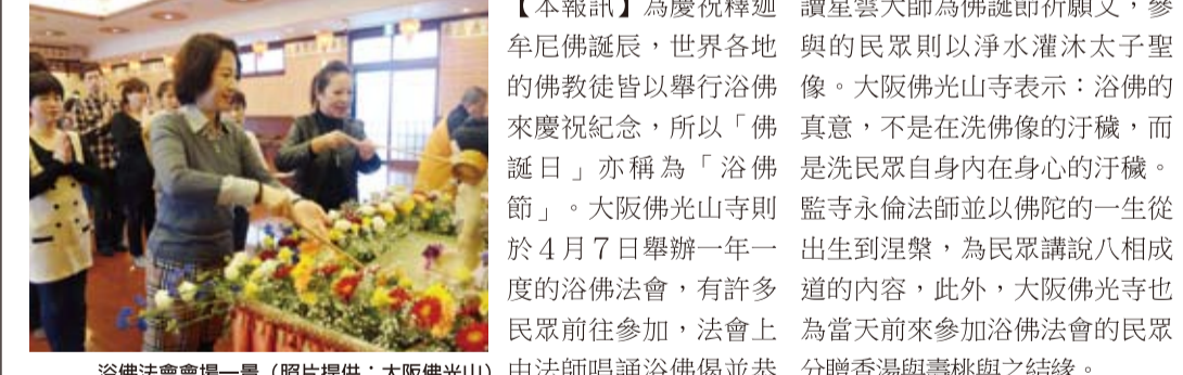
浴佛法會會場一景

【本報訊】為慶祝釋迦牟尼佛誕辰，世界各地的佛教徒皆以舉行浴佛來慶祝紀念，所以「佛誕日」亦稱為「浴佛節」。大阪佛光山寺則於4月7日舉辦一年一度的浴佛法會，有許多民眾前往參加，法會上由法師唱誦浴佛偈並恭