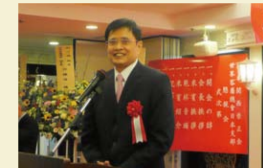
行政院客家委員會主任委員黃玉振