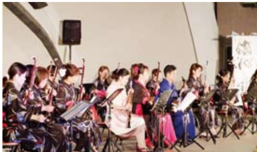
中西日合璧的演奏

【本報台北報導】日本中華藝術玲子樂坊國樂團13日在嘉義中正公園舉辦台日國際文化交流演奏會。玲子樂坊國樂團是以日本愛好二胡人士所組成的樂團，現場演奏優美的音樂令觀眾陶醉不已。