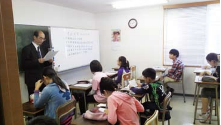
華語能力測驗除了有助於了解華語程度，也是華僑子弟申請「海外聯招會」回台入學的華語文能力參考標準

【本報訊】位於池袋的東京語文學院於4月7日舉辦台灣的中文檢定「華語文能力測驗」(TOCFL)預試，有來自週末中文學校的學生和各語言學校學中文的社會人士，近70位考生應試。