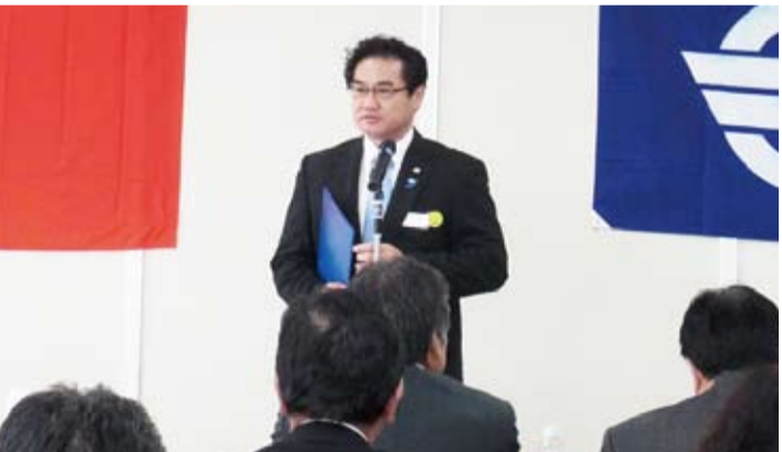
宜野灣市市長佐喜真淳致賀詞

粘處長則致詞表示：感謝吳屋議長等相關人士過去一年來熱心推動該連盟成立，宜野灣市議會是繼那霸市、宮古島市、豐見城市之後，轄區地方自治體第4號「琉台友好議員連盟」，可望帶動其他自治體仿效，並推動台沖之間的交流，進而達到締結姊妹市的目標。此外，粘處長也表示：台日漁業協定已順利於4月10日簽訂，該協議可充分體現政府提倡的「東海和平倡議」的精神，並實踐政府主張的擱置爭議、共享資源理念等，意義十分重大，因此粘處長也呼籲該議連全體成員理解並支持「東海和平倡議」。