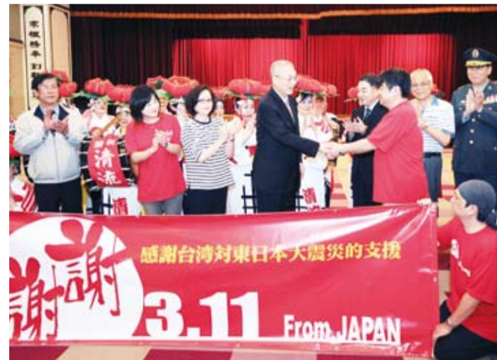
副總統期許臺日今後進一步擴大交流與合作