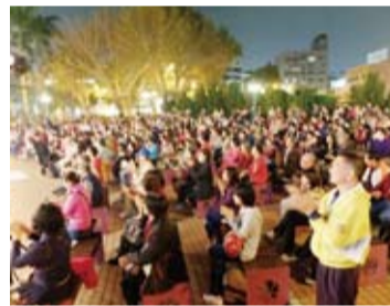
現場聚集許多觀眾到場觀看表演