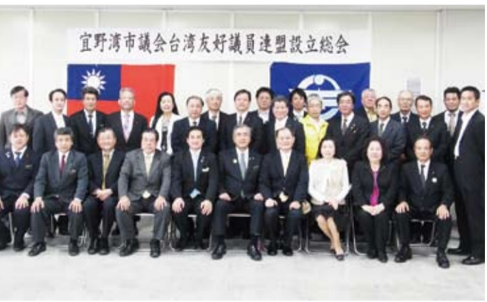
全體人員合影留念