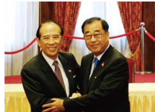
交流協會會長大橋光夫(左)與亞東關係協會會長廖了以(右)會長廖了以和日本交流協會會長大橋光夫在漁業會談後，即召開「台日漁業會談暨協議簽署儀式」。