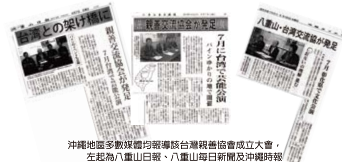
沖繩地區多數媒體均報導該台灣親善協會成立大會，左起為八重山日報、八重山每日新聞及沖繩時報

【本報訊】由石垣島當地熱心人士發起成立的「八重山・台灣親善交流協會」於4月5日正式成立，該協會成立主要是為了延續去年8月當地為紀念台灣墾荒移民而發啟建立顯章