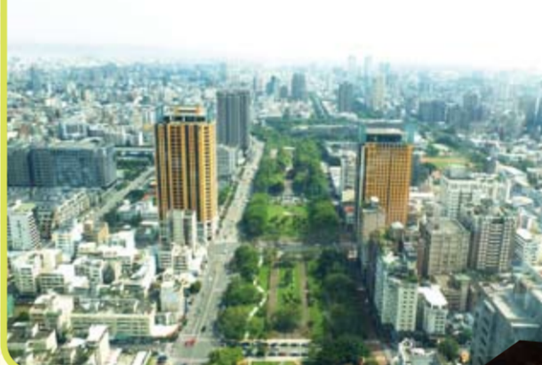
中央に伸びる緑地帯が草悟道