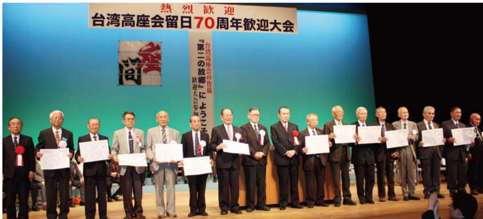
森喜朗元内閣総理大臣からの感謝状を手にする台湾高座会の元少年工の面々

台湾高座会留日70周年歓迎大会実行委員会(石川公弘委員長)主催の歓迎大会が神奈川県座間市立市民文化会館で5月9日、開催された。台湾から約250人の台湾高座会(※)の元少年工及び関係者が参加。日本からは日本高座会関係者1050人の合わせて約1300人が集った。今回の留日70周年歓迎大会の目玉企画は、李登輝元総統の講演と森喜朗大会会長(元内閣総理大臣)署名の感謝状贈呈だった。