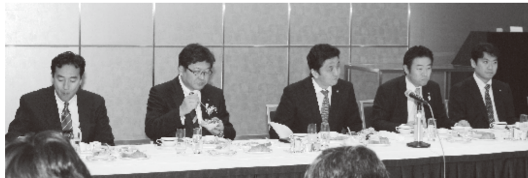
日台若手議連のメンバー(今年2月の民进党主席一行との朝食会の様子)

自民党の衆参両院からなる「日本・台湾経済文化交流を促進する若手議員の会」(略称:日台若手議連)は4月29日〜5月2日にかけて代表7人が訪台した。