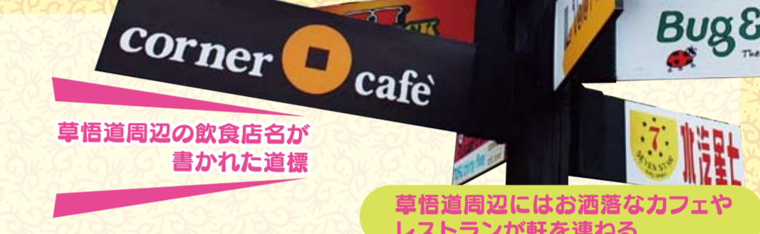
草悟道周辺の飲食店名が書かれた道標

ファンミーティングでは豪華プレゼントの抽選会やクイズ大会、記念写真の撮影なども行なわれた。また、テーマソングである「The Heart of Asia」が披露されると会場は大きく盛り上がった。最後には参加者全員との握手会も実施された。日本人女性は「去年のコンサートが中止になったので、久しぶりに会えて良かった」と喜びの感想を語ってくれたほか、別の日本人女性も「トークも面白くて格好良かった」と、興奮冷めやらぬ様子だった。また会場では今年7月20日、21日にも観光局による第2段イベントとショウ・ルオの誕生日パーティーイベントが行なわれることが発表され、「頑張って休暇をとります」と意気込むファンもいた。