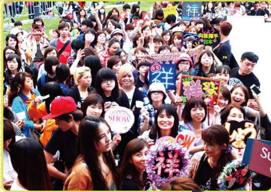
国内外から多くのファンが駆けつけた会場

台湾観光局は4月15日、台中市内で観光イメージキャラクター「ショウ・ルオ(羅志祥)」による特別観光イベント「台湾ロハスの旅〜アジアのハートを探せ〜」を実施した。平日にも関わらず日本からも多くのファンが詰めかけ、春爛漫の台中散策を楽しんだ。