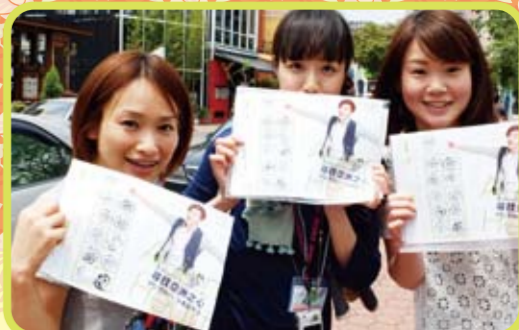
10カ所のスタンプを集めると観光局限定特製グッズが贈られた