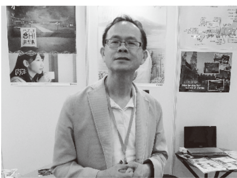
久順旅行社社代表取締役

今年で7回目を迎える台北国際春季旅行博が4月26日、台北世界貿易センター一館(台北市)で開催された。これは旧正月以降、台北で初めて開催される旅行博。国内外の旅行関連業者など600ブースが参加し、春から初夏にかけてのシーズンプランを来場者にアピールした。 交通部観光局の統計によると、2012年の台湾人出国者数は1024万人にのぼり、過去最高を記録した。これは台湾の全人口2300万人の国民の半数近くが出国したことになり、アウトバウンド需要の高い国家といえる。特に日本への旅行は一年を通じて高い人気を誇り、旅行会社各社は特別価格を提示するなど来場者の注目を集めていた。