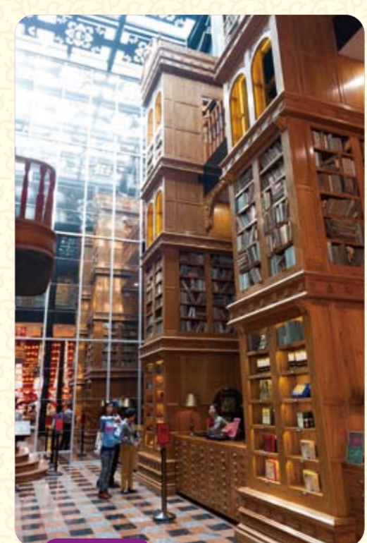
宮原眼科

台中市内では、現在MRTとバストランジットシステム(BRT)と呼ばれるバス高速輸送システムの整備が進められている。このほか水湳地区では2017年の完成を目指す台湾タワーの建設も計画されている。未来に向けて進化し続ける台中は、訪れる人を魅了すること間違いなし。是非訪れてもらいたい。