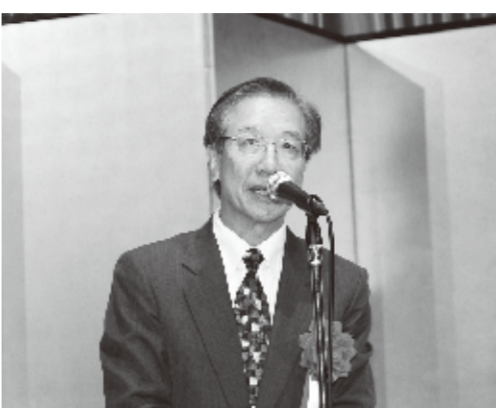
駐日代表処・羅坤燦副代表