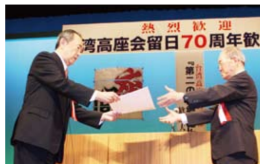
日華議員懇談会平沼赳夫会長から台湾高座会各区会代表者に感謝状が贈呈された

メインイベントである感謝状贈呈は、国会本会議のため遅れて駆けつけた平沼赳夫日華議員懇談会会長が代り、壇上の台湾高座会の各区会代表一人ひとりに感謝状を手