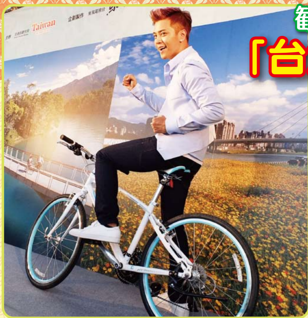
台湾観光イメージキャラクター ショウ・ルオ