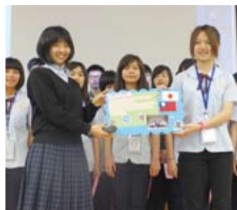
關西高中學生代表(右)贈送友好字板給日本學生代表(左)