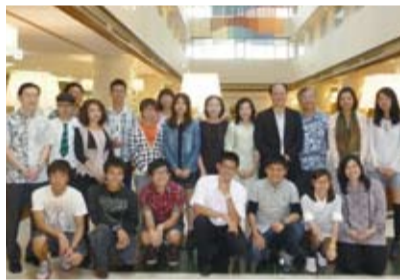
留學生與全體人員合影

【本報訊】駐那霸辦事處為向轄區內的僑團領袖和留學生，宣導總統馬英九提倡的「東海和平倡議」，並說明日前台日雙方簽署漁業協議的情形，分別於 5 月 10 日及 11 日兩天，舉辦兩場說明會，同時也利用這個大家相聚的機會，分別在會場上播放台灣紀錄片《司馬庫斯》和《不老騎士》，讓與會的僑團領袖和留學生們，可以更加了解台灣電影的發展成就、人文精神，以及政府重視文化軟實力發展的成果。