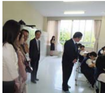
關西高中校長與學務主任一行人，在大妻嵐山中學暨高等學校校長的帶領下，參觀教學課程