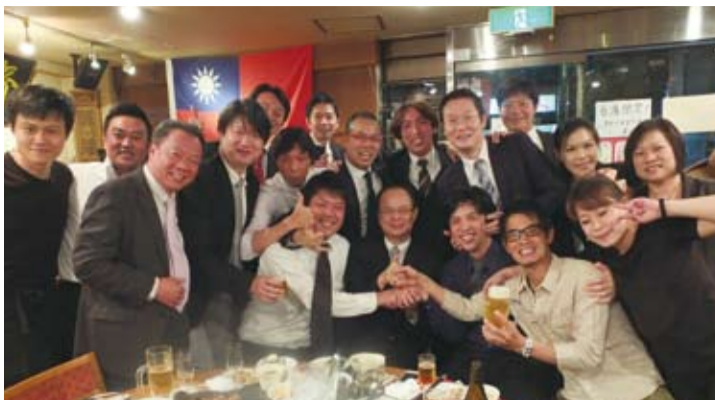
與會人員合影留念