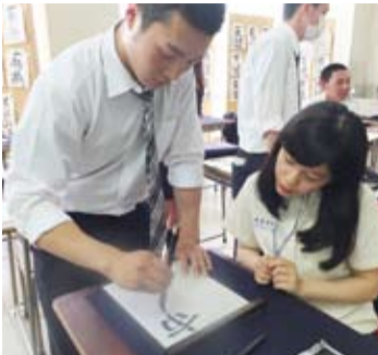
許久沒上書法課的同學們在日本同學的帶領下練習寫書法