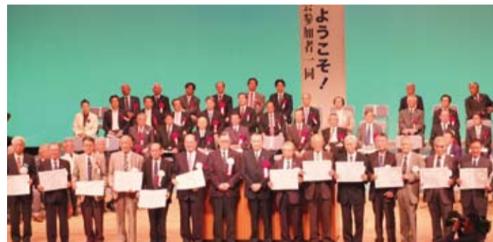
獲頒感謝狀的台灣高座會成員代表 10 年均會在日本舉辦大會，會員們皆已年過 80。

【本報訊】台灣高座會留日 70 周年歡迎大會，於 5 月 9 日在神奈川縣座間市立市民文化會館舉行，台灣方面有近 250 位成員及家屬專程到日本參加此次盛會，和約 1000 餘人與會的日本高座會關係者，讓現場座無虛席。駐日代表處副代表羅坤燦、大和市長大木哲、諾貝爾化學獎得獎者根岸英一等人也受邀到場，此外駐橫濱辦事處處長李明宗和諸多僑民也到場參加。而前總統李登輝原訂出席當天的演講活動，但由於身體不適，臨時取消訪日行程，讓不少與會者感到相當可惜，且此次歡迎大會的會長，前日本首相森喜朗也因公務缺席，讓原本注目度極高的大會活動，頓時政治星光黯淡了不少。