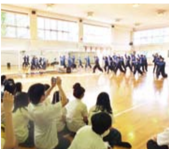
川口高校舞蹈社的學生以熱舞歡迎台灣學生的到訪