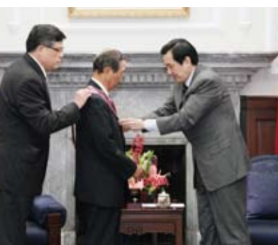
日本交流協會前理事長畠中篤(圖中)獲總統(右)頒授「大綬景星勳章」

畠中篤致詞表示接受總統頒贈勳章感到相當光榮，且對於台灣人民在日本311大地震後踴躍捐輸一事表達謝意，並強調日本人民永遠不會忘記台灣人民的協助。總統馬英九則表示：將台日關係定位為「特別夥伴關係」，並陸續和日方完成「台日合作交流備忘錄」、「台日投資協議」和「開放天空協定」等簽署，對台日關係的增進有莫大的幫助。而4月10日台日雙方順利簽署「台日漁業協議」，則足以表示日本政府對於「東海和平倡議」的支持。日後，台日雙方也將就文化、觀光等各層面積極進行交流。