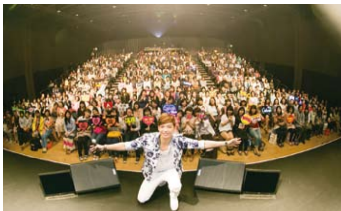
辰亦儒和全場粉絲合影留念

因為這次的粉絲見面會是以花朵和笑容為主題，所以辰亦儒也一連演唱多首和花朵有關的歌曲，當唱到飛輪海的《ONLY YOU》時，辰亦儒還趁機模仿了一下其它成員，讓會場頓時笑聲四起。此外在見面會上，辰亦儒也帶來自己在澳洲拍攝電影時拍下的私人照片和大家分享，並和全場粉絲玩遊戲、握手和合影，最後辰亦儒也表示：「有機會想辦一個日文歌為主的小型演唱會！」讓在場的歌迷、影迷們更加期待辰亦儒再次造訪日本。