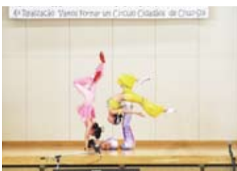
山梨台灣總會名譽會長鄭玉蘭提供View Hotel Group雜技團