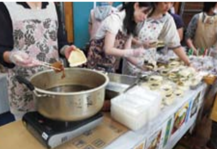
口味道地的刈包在園遊會上相當有人氣