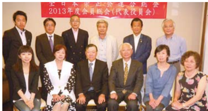
會員代表合影留念

【本報訊】全日本崇正會聯合總會為促進今後組織的活性化，於5月19日在大阪中華料理「大東洋」舉行2013年度會員總會，包括日本關東崇正會、日本關西崇正會、名古屋崇正會和沖繩崇正會等世界客屬總會日本支部，以及亞洲台灣客家聯合總會日本分會的會員們皆出席參加。