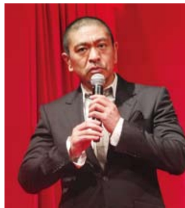
搞笑鬼才松本人志的前三部電影作品皆曾在金馬奇幻影展中上映

【本報訊】日本知名搞笑藝人組合「Down Town」中的松本人志，繼2007年的首部電影作品《大日本人》，2009年的《しんぼる》(台譯：睡衣男闖雞關)和2011年的《さや侍》(台譯：搞笑武士)等作品之後，今年10月將推出第4部電影作品《R100》。