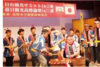
「惠利原早餅つき」表演