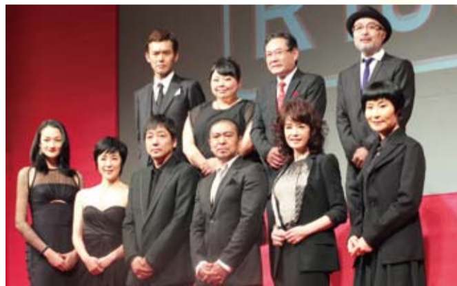
聚集日本一線演員的電影《R100》，今年10月在日上映