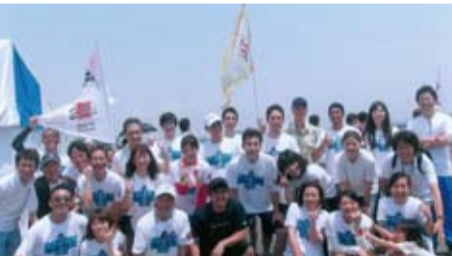
今年熱情參與龍舟競賽的成員合照

【本報訊】第20屆橫濱龍舟競賽於5月25日至6月2日，進行為期4天的賽事，其中26日進行的橫濱市長盃有近40支隊伍出賽，5度參加比賽的橫濱中華保育園不僅派出兩支隊伍參賽，駐橫濱辦事處亦派出兩名職員與橫濱中華保育園的隊伍一同