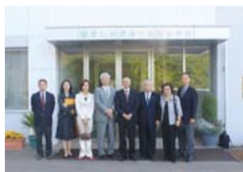
參訪日本東北學院榴岡高等學校