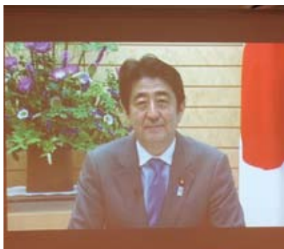
首相安倍晉三特別錄製影片致詞

台灣觀光協會副會長戴啓珩也在報告台灣赴日旅遊現況時指出：操作台灣的團體旅客時，包括宮崎駿三鷹之森美術館、東京