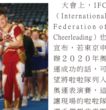
搖滾熊啦啦隊獲得男女混合舞伴技巧組銀牌