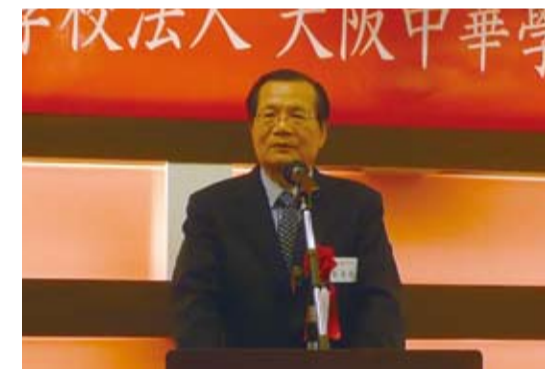
駐大阪辦事處處長黃諸侯

此期待大阪中華學校在羅理事長的領導下，可以成為學生等著排隊入學的一流名校，而今後國際化的發展勢在必行，大阪中華學校正是扮演推動大阪國際化的重要角色。大阪日華友好交流協會會長川合通夫則祝大阪中華學校校務昌隆，並呼籲籌備「學校遷徙委員會」做好準備，最後在副理事長連茂雄致閉幕詞後圓滿落幕。