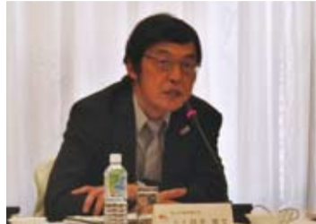
日本國土交通省觀光廳廳長井手憲文