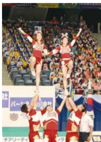
高難度的舉人動作，為搖滾熊啦啦隊在男女混合舞伴技巧組中贏得銀牌

在賽前迎賓晚會中，交通大學帶來一段結合舞龍舞獅、扯鈴和跳繩的舞蹈表演，展現台灣傳統文化，隊員們也帶著「台灣」字樣的徽章與其他國際隊伍交換，並和日本隊伍學習互相加油打氣的「應援團文化」。比賽場中，則可見到選手們在場中高舉「台灣」字樣的字板，並在場邊揮舞國旗，為選手們加油打氣。