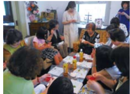
手作教室製作香包