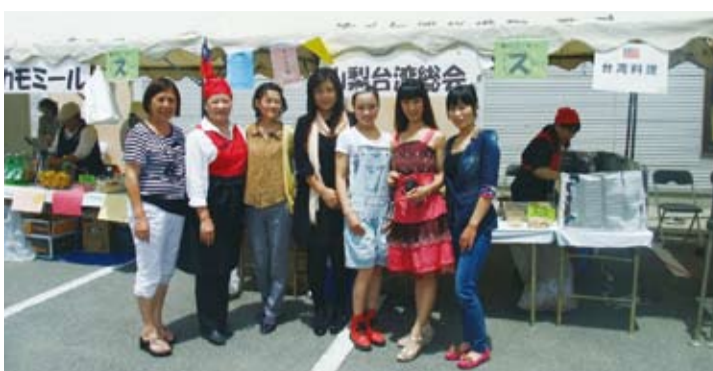
山梨台灣總會成員一同在台灣料理攤位前合影

山梨台灣總會自2003年成立以來，便經常舉辦老人院慰問表演、協助災害募款和與當地縣市民眾、學校進行國際文化交流等活動，並以身為山梨台灣僑胞的娘家，為旅日僑民努力，因此，山梨台灣總會執行部也表示：希望有更多鄉親參加山梨台灣總會，因為多一人多一份力量。