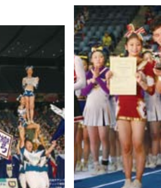
交通大學競技啦啦隊，手持「台灣」字板，完成高難度動作

大會上，IFC(International Federation of Cheerleading)也宣布，若東京申辦2020年奧運成功的話，可望將啦啦隊列入奧運表演賽，這讓現場的啦啦隊選手們都非常期待。