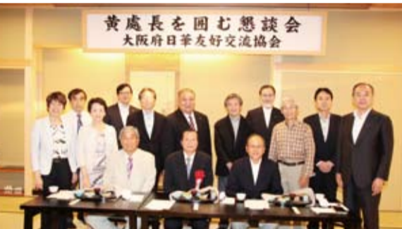
大阪府日華友好交流協會成員與黃處長(前排中)合影留念