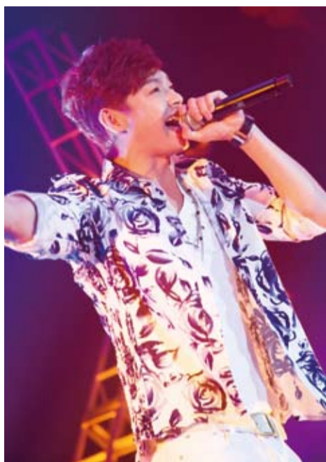
演唱多首歌曲的辰亦儒在見面會上也表示想在日本開演唱會

【綜合報導】飛輪海成員之一的辰亦儒日前專程來日，參加5月19日在東京日本橋三井Hall舉辦的粉絲見面會。見面會一開始即見到辰亦儒一邊唱著日本國民天團SAMP的百萬暢銷單曲《世界中唯一僅有的花》，一邊入場，沒多久直接走下台和粉絲近距離接觸，當場引起前方的粉絲尖叫不已。唱到中間不小心忘記歌詞的辰亦儒還不甘心地說：「彩排的時候明明唱得很完美！」