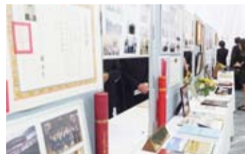
展示會上分成愛國、愛校、愛家、愛僑和展示遺作等幾個部分，陳列出照片和獎狀