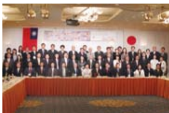
近40位觀光業相關人員到日參加此次觀光高峰論壇

日本首相安倍晉三則特地以影片留言向出席此次台日觀光高峰論壇的人員們表示：與日本共同享有民主、自由等共同價值的台灣是日本重要的夥伴，台日互訪觀光人口創下歷史新高之外，希望能讓更多人知道日本極具魅力的和食、動漫文化、時尚等所謂