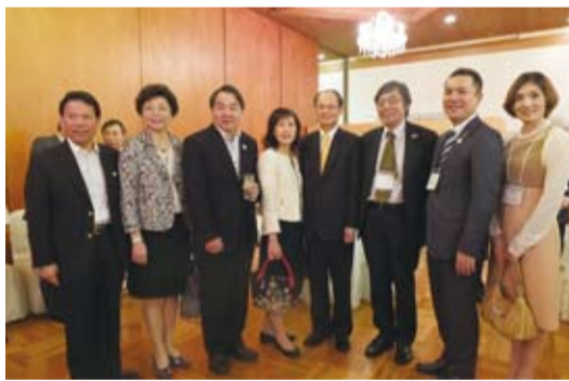
圖左起：觀光局東京辦事處主任江明清、台灣觀光協會會長賴瑟珍、觀光局局長謝謂君、駐日代表沈斯淳伉儷、日本國土交通省觀光廳廳長井手憲文和三重縣知事鈴木英敬

【本報訊】台日觀光高峰論壇於5月31日舉行前一日，主辦單位特別舉行了歡迎晚會，歡迎包括觀光局局長謝謂君、台灣觀光