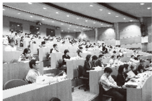
会場となった台湾大学法律学院霖沢館国際会議場