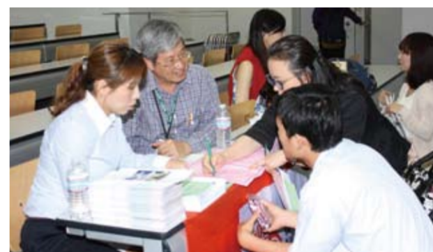
国立高雄師範大学のブースの様子(説明会)