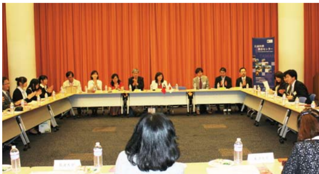
台湾・日本大学間国際交流懇談会の会場となった法政大学市ヶ谷キャンパス