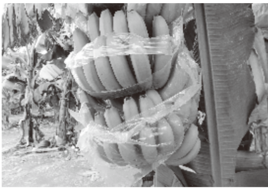
一房ごとにビニールに覆われたバナナ

一方、フルーツの品種改良も積極的に行われている。特に高雄市小港にある果物輸出業者フォルモサ物産が手がけるのは「夏雪」と呼ばれる新種のマンゴー。赤い外観が特徴の愛文マンゴー(アップルマンゴー)と比べ、「夏雪」は鮮やかな黄色の外観が目目を引く。最も特徴的なのは繊維質を感じさせない柔らかな舌触りで、口の中でとろけるほど。