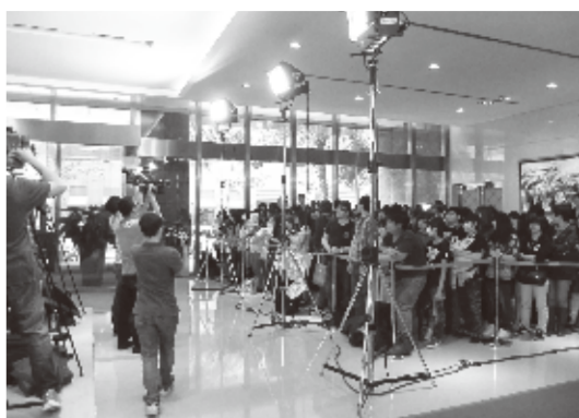
盛んになる日台商業

日本と台湾の間で様々な交流が活性化しているなか、国際見本市も続々と開催されている。4月にオートバイ、スクーター、エンジン等を一同に集めた「台湾国際オートバイ見本市(MOTORCYCLE TAIWAN)」。 特産品、土産品などを集めた「台北国際ギフト・文具見本市(Giftionery Taipei)」。 6月上旬には、コンピュータ、通信機器、ディスプレイなどを展示した「台北国際コンピュータ見本市(COMPUTEX TAIPEI)」が開催されたが、さらに年末に向けて多くの見本市が予定されている。 6月26日～29日まで開催された「台北国際食品見本市(FOOD TAIPEI)」は、生鮮青果、食肉、乳製品、酒、茶などを集めた総合食品見本市だ。食品業界関係者のみならず一般入場者の割合も多く、恒例行事となっている。 さらに8月1日には「台北コンピュータアプリケーション見本市(TICA)」が開催される。台湾が世界に誇るコンピュータシステムや周辺機器、ソフトウェア、画像処理システムなどが集結する。8月2日には、台中市が独自に見本市を開催、「台中国際銘茶・コーヒー見本市」「台中食品見本市」「台中バーカリー見本市」と名付けられ、台中が生んだ茶葉、コーヒー、水産品、加工