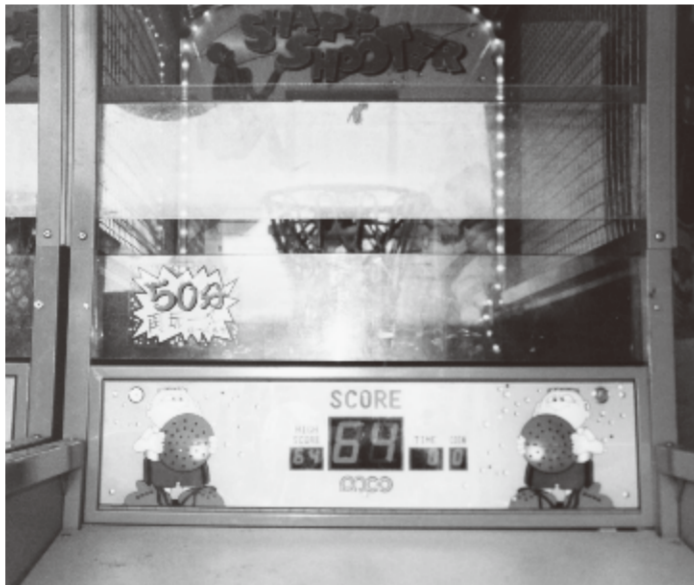
バスケット・ボールのシューティング・ゲーム、気になる得点は50球中…?

それから2ヵ月後、バスケのシューティング・ゲームの場所は、新しい店に変わっていた。