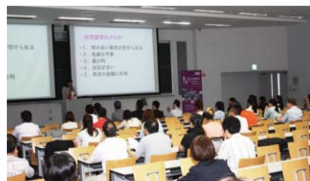
6月22日留学生説明会の様子

「淡江大学と協定を結んでいます。今回、初参加で戸惑いもありましたが、様々な大学の留学の様子も分かりましたし、学生にぜひ行って欲しいと思います。まずは、担当者の方と挨拶ができたのが一番の成果です(中央学院大学国際交流センター)。