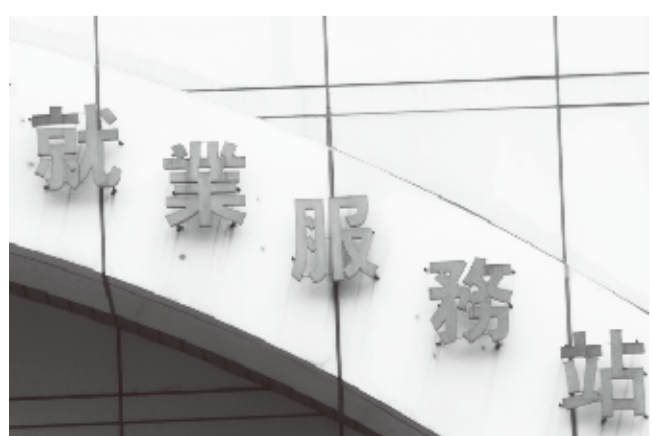
台湾ハローワーク

電(TSMC)・張忠謀会長は同日に開かれた株主総会で、第3四半期の産業界の景気は非常に上向き、今年の上半期より下半期が景気好調になるとした。また、張会長はタブレットPC端末やスマートフォンの市場は好調であり、今後携帯電話マーケットがさらに活況だとする同社をはじめ台湾の産業界の景気動向が明るい兆しであると発表した。 また、主計総局は4月22日、2月の平均基本給も発表した。それによると基本給の平均は37229円で、手当部分(賞与、報奨金、残業代等)は24065元となっており、昨年同月比7.10%の減少となった。また、今年の工業とサービス業の平均賞与(ボーナス)額は平均1.45カ月分と直近3カ月で最低だったとしている。