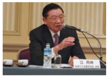
前海基會董事長、現任三三會會長江丙坤訪日

日本首相安倍上任後推出一連串的經濟振興政策,即所謂的安倍經濟學,江丙坤表示:安倍經濟學有其魅力,而安倍的領導力和執行力更是令人佩服,因此這其中有不少是台灣可以學習的地方。