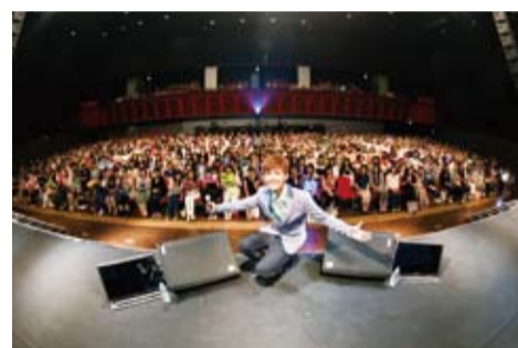
炎亞綸與日本粉絲合影，並在見面會上宣布將在日本開演唱會的計畫

將於今年秋天在東京都內舉辦2場演唱會，這對於每年只能在粉絲見面會上見到炎亞綸的日本歌迷來說，無疑是個大禮物，粉絲們也開始期待炎亞綸在演唱會上