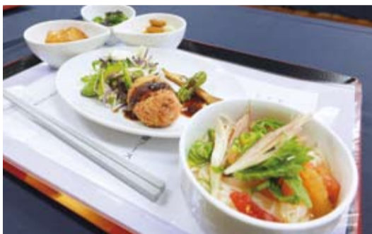
慈濟準備美味的素食料理，包括番茄牛蒡湯冷麵、紫蘇梅醃瓜等菜色