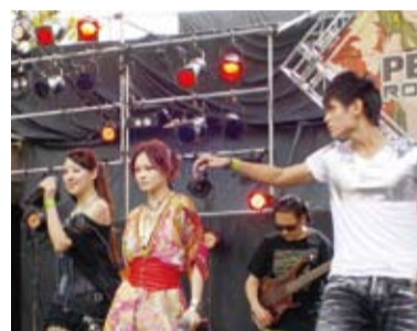
來自台灣的「Asian 4 Front」High翻會場

【本報訊】來自台灣的樂團「荒山亮+丰樂團」及「Asian 4 Front」，受到「Peaceful Love」搖滾音樂祭的邀請，於7月13日至14日參加在日本沖繩市野外科劇場舉行的搖滾音樂盛會。