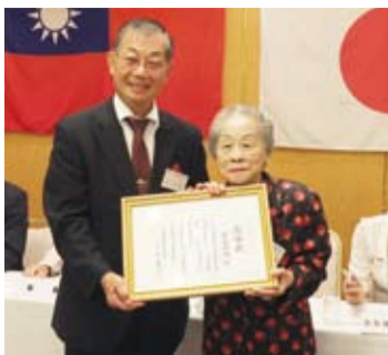
毛會長於34屆會員大會上頒發感謝狀給多位對會務盡心盡力的人士