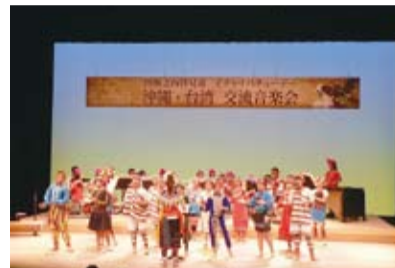
新北市丹鳳國小演唱原住民歌謠

壢國中則分別派出弦樂團和管樂團演奏優美曲目，精彩的演出贏得滿場熱烈的掌聲。此外，沖繩當地的GALAXY兒童舞蹈教室、屋宜小提琴教室、二胡團體及三味線演奏家等亦參與表演，長庚國小弦樂團更與屋宜小提琴教室共同合奏。透過此次音樂交流活動，除了可以增進台灣學生國際表演經驗之外，也能充分達到促進台灣與沖繩之間的文化交流效果。