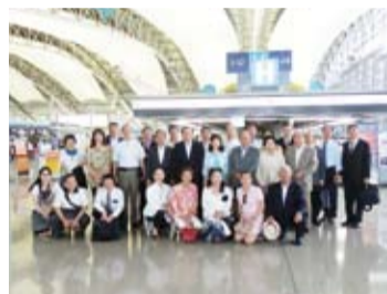
20 多位僑領與辦事處同仁前往機場送機

任期內著重推動觀光、經濟及文化交流，去年一年內，台日雙方往來觀光人數高達 299 萬人，其中大阪辦事處轄區從北陸、中部到四國廣島就有 100 萬人往來。台日間往返的班機，從關西國際機場與中部機場擴展到富山、小松、高松、岡山、廣島等地都有直飛航班。光是關西機場一天就有 15 個航班。文化交流方面，約 100 所大學、高中與台灣方面締結姊妹校，大學