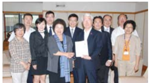
高雄市長陳菊一行人拜會神戶市市長矢田立郎

【綜合報導】高雄市政府為推動高雄港應轉朝多元化發展,由於高雄市與神戶市皆為港口城市,且與高雄與日本有深厚淵源,因此應加強交流,希望能汲取神戶市的經驗,建立友好互動的合作關係。同時,陳菊市長也呼應神戶市港灣局局長花木章的看法,認為雙方應結合台灣港務公司共同合作,向郵輪航商行銷,爭取開闢高雄—沖繩—神戶三地的定期郵輪航線,讓兩市的市民和國際遊客可以到高雄與神戶旅遊。