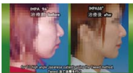
使用Tweed法的牙齒矯正前後比較，矯正前的下顎角度為94度(左)，矯正後為88度