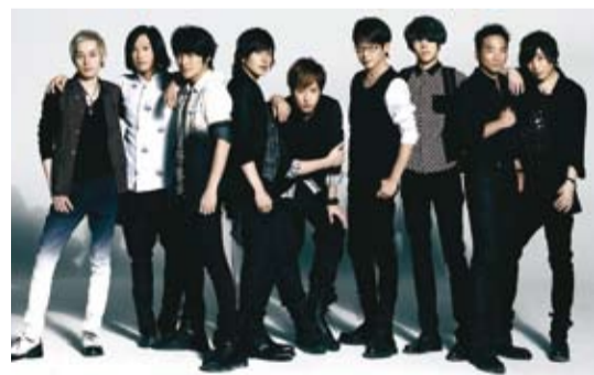
台灣搖滾天團五月天進軍日本，與日本搖滾樂團凡人譜（flumpool）合唱電影《阿信》主題曲