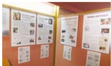
從展示資料中可以了解台灣幫助受害者對抗日本政府的過程，且有學者特別將日文資料翻譯成中文，希望可以讓更多民眾了解這段歷史

誠如戰爭與和平女性博物館館長池田惠理子在訪談中說到的，在面對國際化的現在，日本年輕人走出日本不管是面對整個亞洲或是世界各國的人，卻對自己國家的歷史不甚了解，真是情何以堪。希望一張張泛黃的歷史照片和文件，以及僅存的受害者們的聲音，可以被日本政府看見、聽見，讓他們漸漸正視這段他們不願提及的歷史真相。