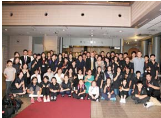
群馬台灣總會成員和參與演出的學生們合影

【本報訊】由群馬縣台灣總會所主辦的「日台學生交流演奏會 in 群馬」，於7月17日在群馬縣高崎市文化會館舉行，此次主辦單位邀請台北市介壽國中國樂團以及群馬縣立前橋東高校管樂團共同演出，希望透過音樂讓台日兩地學生進行文化交流。台北駐日經濟文化代表處代表沈斯淳、台北市議員王鴻薇、群馬縣日台議員連盟會長松本耕司、群馬縣副知事吉川浩民和群馬縣觀光物產國際協會專務山口章等人皆出席參加。