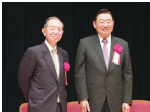
日本前駐中國大使丹羽宇一郎(左)與三三會會長江丙坤(右),一同為早稻田大學的學生上了一堂東亞和平發展課

【本報訊】前海基會董事長、現任三三企業交流會會長(簡稱三三會)江丙坤與日本前駐中國大使、早稻田大學特聘教授丹羽宇一郎,在早稻田大學的特別演講課中,以「追求東亞和平發展~從台日新視角提出建言」為題,分別發表台日經濟發展合作模式的優勢,以及目前日本與中國的關係現況。