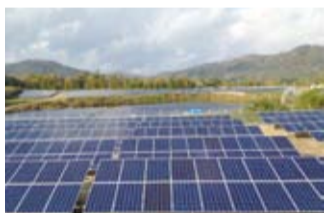
旭晶在廣島的電廠是台灣首家在日本正式完成併聯售電的業者，總面積達51,400.7平方公尺，裝置容量約1.5MW

而台灣方面政府雖有補助但稍嫌不足，像今年躉購費率也下修，再加上設置環境的限制，例如地狹人稠、可取得的土地面積有限等，都會影響業者投入太陽能資源開發的意願，因此，對能在起步階段的台灣太陽能市場，仍有許多待加強的部分。目前日本的總發電量中，再生能源占11%，但台灣的再生能源僅占總發電量的5%，這正也表示台灣仍有很大的空間，可以持續開發和經營再生能源，包括太陽能電廠的使用。