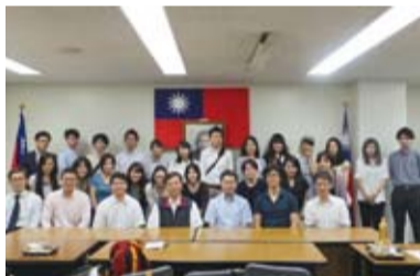
今年領取台灣獎學金和華語獎學金的學生們，參加行前說明會。

今年共有18位獲得台灣獎學金的留學生將前往台北、高雄等地就讀大學和研究所，另外有13位獲得華語文獎學金的學生將在台灣各地華語文教學中心學習中文。會上同學們針對關於領取獎學金的成績門檻或是生活面的疑慮等面向和學長們請教，而學長們也向大家表示在外留學等於是代表自己的國家，一定要注意言行表現，包括在課堂上的表現。