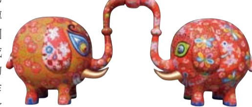
在雕刻之森的戶外展區展出的《分享象》，象徵的台日彼此分享幸福