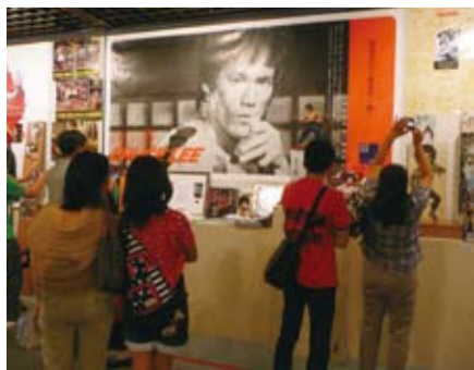
許多民眾駐足在大型海報前

和先驅者。日本尊稱「李小龍是亞洲人的驕傲」，透過電影成功地將中華武術文化、哲學思為傳播到全世界，扭轉60年代當時白人對亞洲人的歧視與優越感，也讓「功夫」一詞為世界所知。王石明說：「李小龍是全世界華人的驕傲」。他坦承自己的畫風、人生中遭遇困境時，受到李小龍求新、不拘泥於形式、逆境中求生存的精神啟發，希望將來能覓地成立「李振藩紀念資料館」，為後世保留、公開這位被美國《時代雜誌》所推選的20世紀百位英雄中，唯一的東方人「李小龍」相關文物。