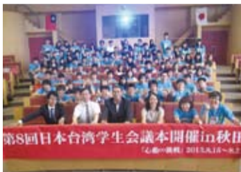
第8屆台日學生會議， 聚集台日近百位學生參加

台日學生於會議期間分別就教育、社會、國際、文化等領域做討論，此外也參訪秋田縣及岩手縣等著名文化觀景點和觀賞代表東北地區的「花輪祭」活動。