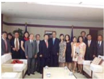
留日台灣同鄉會拜會代表