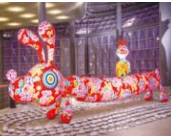
作品《拉長狗》(前)和《龍的傳人》(後)豐富的色彩花樣，衝擊觀賞者的視覺感官