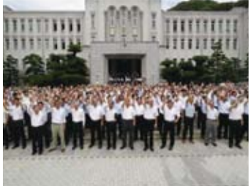
愛媛縣政府職員400人 歡迎台北市長等人到訪

【綜合報導】台北市松山機場將於今年10月11日起與日本愛媛縣松山機場對飛，創下全球第一個同名機場對飛的先例。