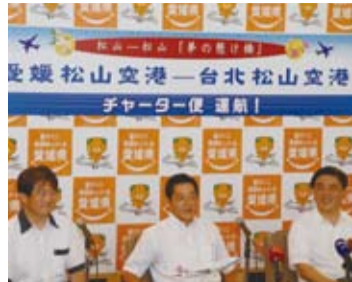
愛媛縣與台北市共同宣布松山包機 10月11日首航 (左起：松山市長野志克仁、 愛媛縣知事村中廣、台北市長郝龍斌)