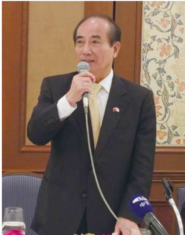
立法院長王金平表示故宮到日展覽可以使用「國立」兩字，是很大的突破

【本報訊】立法院長王金平率領跨黨派立委，自7月21日至25日到日本參訪，此行主要為訪問311災區，關心災區重建的進度之外，也包括前往宮城縣內女川核電廠聽取日方對於防災相關的報告，此外，也與日本核能規制委員會成員會面，了解日本對於目前停機的核電廠申請再啟動的規範和準則，王金平表示：希望能將此行獲得的訊息帶回台灣給相關單位作參考，希望日後台灣對於核電廠也能作出嚴厲的監督，而台灣是否要仿效日本設立核能規制委員會，則可在臨時會上另作討論。