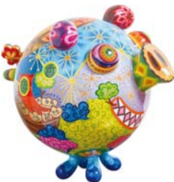
強調圓滾滾身軀的作品《圓豬》，帶著笑臉，展現作品擬人化的趣味性