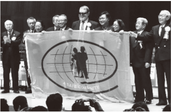
セーフコミュニティ認証式

Q認証を受けたが A豊島区は世界で296番目、国内では5番目のセーフコミュニティのメンバーとなりました。以後、多くの自治体が視察に訪れています。この認証は、ある基準をクリアしたからもらえるというのではなく、データに基づいて、継続的な予防活動に取り組んでいるか、その姿勢が常に評価され、5年に一回、再認証という形で更新されます。改善がなければ取り消しになります。そうした意味では認証取得はスタートラインであり、安全・安心のまちづくりはまだまだこれから目指す方向だと思います。