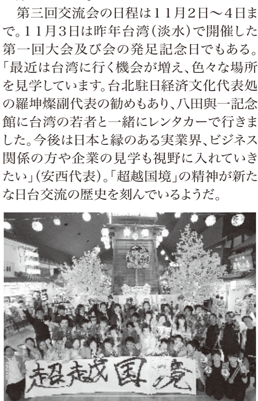
2013年5月11日日台若者交流会第二回大会