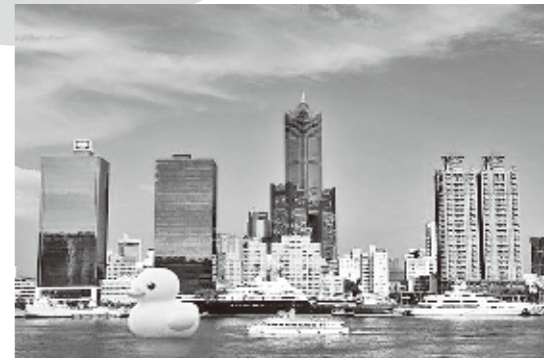
高雄での展示が決定したラバー・ダック(イメージ図)

高雄市政府は8月5日、アヒルの形をした巨大オブジェであるラバー・ダックを9月19日から10月20日まで、高雄市の光栄ふ頭で展示することを発表した。過去には阿姆斯特ダムやシドニー、香港、大阪などでも展示された世界的にも人気の作品で、台湾での展示は初めて。会期中には300万人の観衆と、10億元(約32億円)の経済効果を見込む。