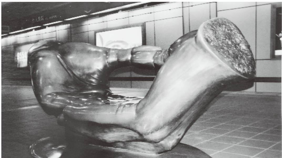
台北MRTのホームにもベンチ兼オブジェが設置されている

ガジュマルを街路樹に、熱帯花の咲きほこる中央分離帯には、ふと思いついたように、オブジェが、たまたまでいた。両脇を歩きかう車を尻目に。パブリック・アートたちは、この排気ガスの大通りに展示されることを、いまだ、とまどうようにも見える。決して大々的に自己主張することはなく、街角