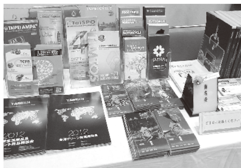
商談会の展示物(前回)