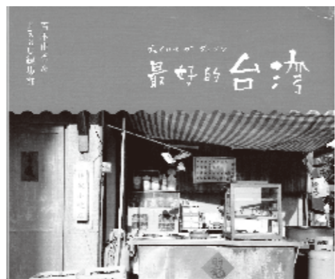
講談社の台湾ガイドブック「最好的台湾」

Q昨年も特集を組んだが、A台湾の方たちは気持ちが持続するとうか、愛情が長く続く人たちだなど行ってきて感じたので、ちょっと1回で終わらせたくないと思ってもう一度、台南を加えて、もっと台湾