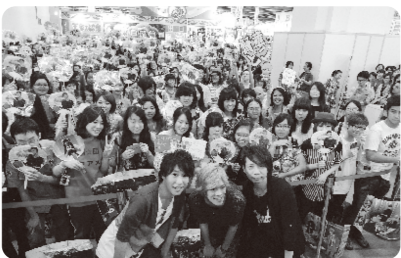
ファンと一緒に記念撮影

今年で14回目となる「2013年漫画博覧会」が8月15日から20日の日程で、世界貿易センター1館で行われた。会場には期間中の毎朝早くから入場を待つ長蛇の列で、初日と16日は平日にも関わらず合計19万人が来場した。17日午前には実施した人気マンガ、アニメ「黒子のバスケ」の声優小野賢章と諏訪部順一のサイン会では、熱心な女性ファンらが詰めかけ、台湾における日本アニメの絶大な人気を見せつけた。