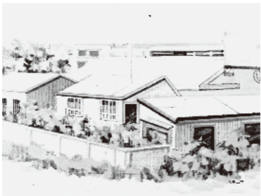
メンマの加工を担った丸松物産旧東京工場