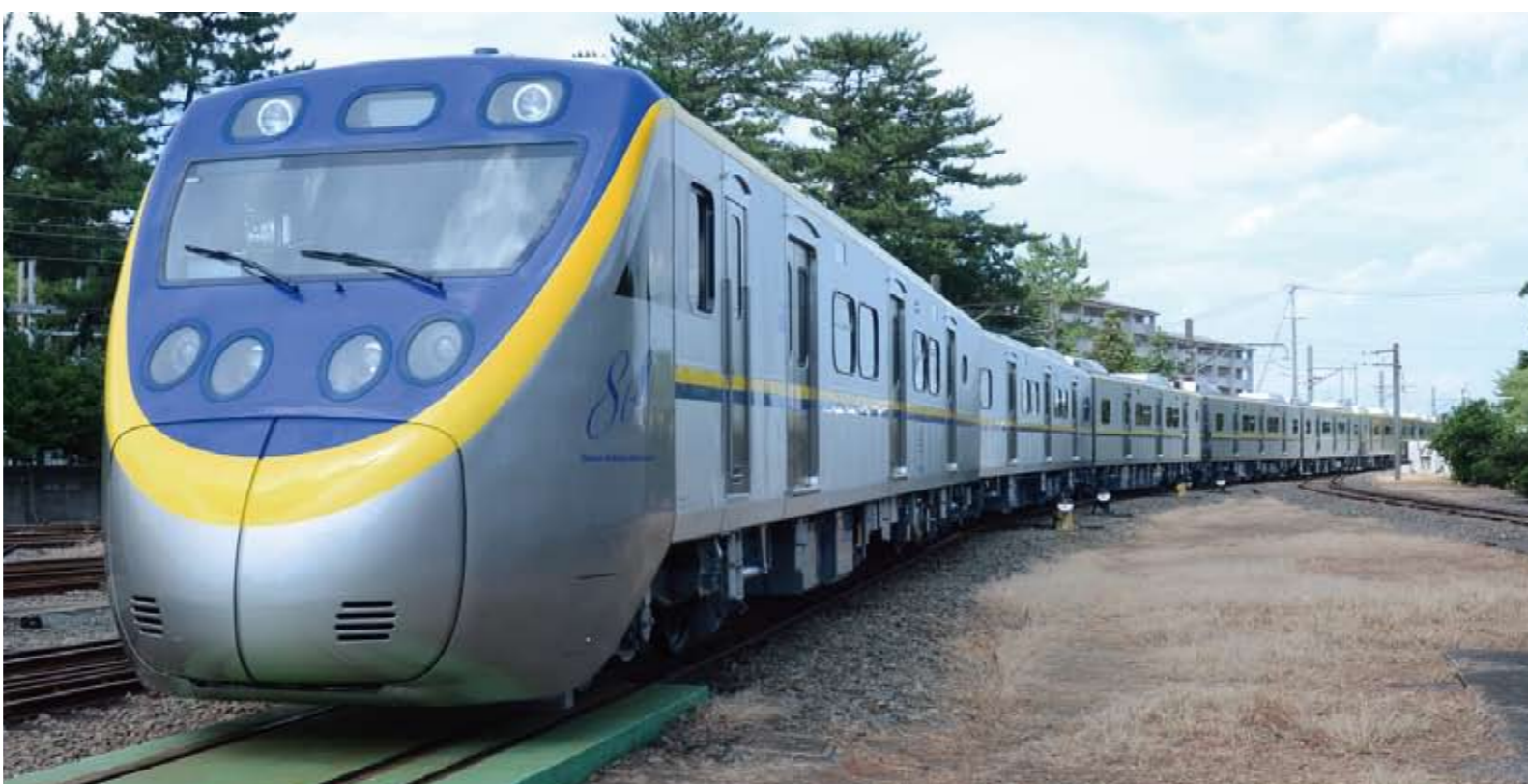
EMU800形電車外観

台鉄では近年、日本製車輈を積極的に導入している。現在、EMU700形電車のほかタロコ号の愛称で知られるTEMU1000形電車やブユマTEMU2000形電車が活躍している。