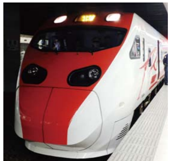
2月に営業投入されたTEMU2000形電車。EMU800とTEMU2000はツートップの位置付け