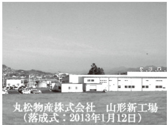
丸松物産株式会社 山形新工場(落成式:2013年1月12日)

A日本と台湾はもともと友好的です。距離も近いし、両国は50年間、ひとつの国で一緒でした。台湾の人々はもっと親密です。台湾で地震があったときは日本の方がすぐに救援にきてくれました。今回、東日本大震災では、台湾はすぐく寄附してくれて応援もしてくれて感謝したい。そんなわけで、日本と台湾との友好関係は本当に素晴らしいと実感しました。