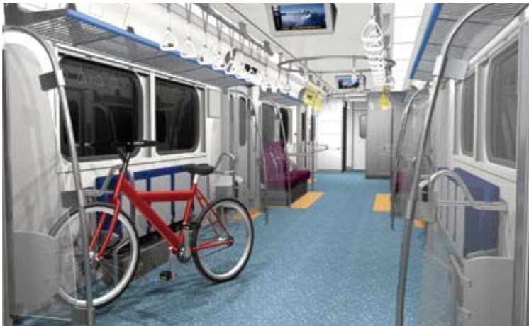
収納式座席で自転車の乗車も可能