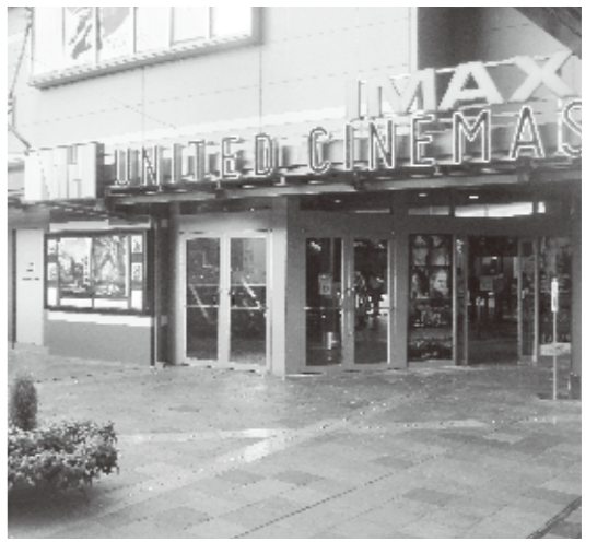
映画祭の舞台となる

アジアフォーカス・福岡国際映画祭 開催期間/9月13日(金)～9月23日(月) 開催場所/キャナルシティ博多(福岡市博多区住吉1-2)