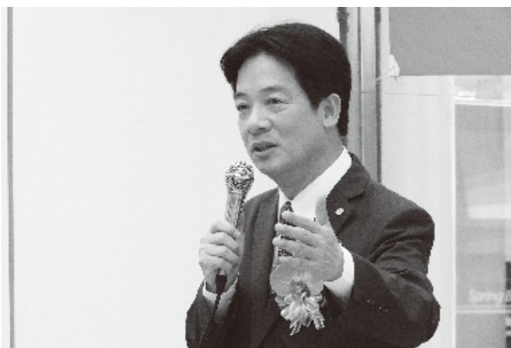
台南市頼清徳市長(資料写真)

台南市の頼清徳市長は8月7日に開かれた市政会議で、台南市の公的文書においては「日治(時代)」の名称使用に制限を設けな