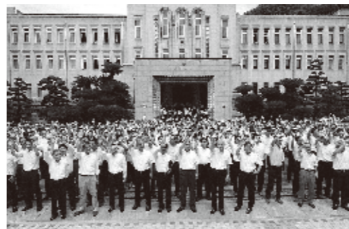
400人の愛媛県庁職員が台北市長らの訪問を歓迎。