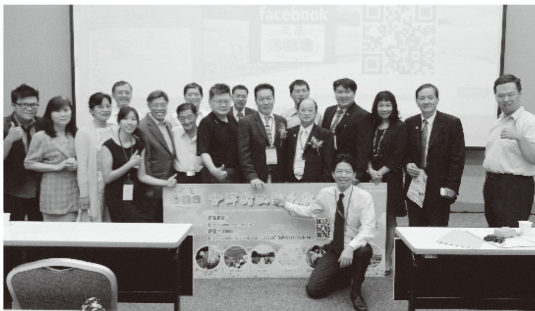
フォーラム参加者ら

中華垂太中小企業経済合作促進会(CTAPEC)は8月7日、中小企業を対象にした「交流および企業発展フォーラム」を開催した。これは中国大陸をはじめとする海外進出を検討する台湾の中小企業を対象に行われたもの。日本からも台湾での事業拡大を狙う企業が参加し、台湾企業との協力関係構築の可能性を探った。