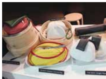
食物造型的包包配件，在展場中相當有人氣