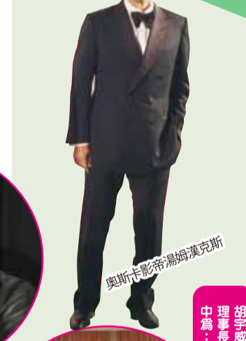
奧斯卡影帝易姆漢克斯