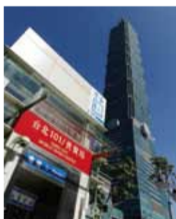
台北捷運信義線11月24日通車

加其他轉乘點，可藉此紓解板南線的尖峰人潮，而民眾搭乘其它捷運主線時，也只需一次轉乘就可到達信義商圈，屆時可望紓解信義區101大樓的跨年人潮。