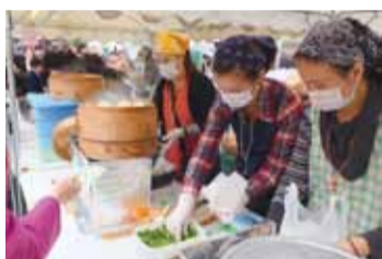
由學生家長準備的美食攤位，讓橫濱中華學校116周年校慶活動舉辦的相當成功