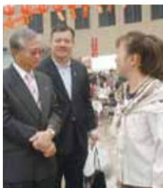
蔡處長到場慰勞學校老師

【大阪／採訪報導】為讓日本友人增進與華人的交流，對中華文化、美食、傳統藝術等有更深的了解與認識，由大阪難波地區經商的華人所發起的華友祭，於11月3日舉辦第10屆的活動，包括大阪中華總會青年部、欣華會、大阪佛光山會及大阪中華學校等單位皆應邀參加共襄盛舉。