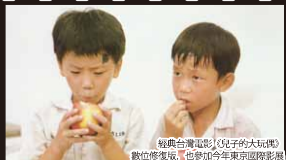
經典台灣電影《兒子的大玩偶》數位修復版，也參加今年東京國際影展