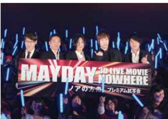
近距離看到五月天，歌迷都忍不住興奮了起來