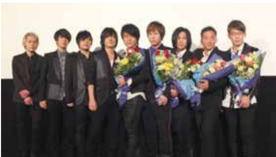
日本搖滾團體lumpool特別到場獻花致敬