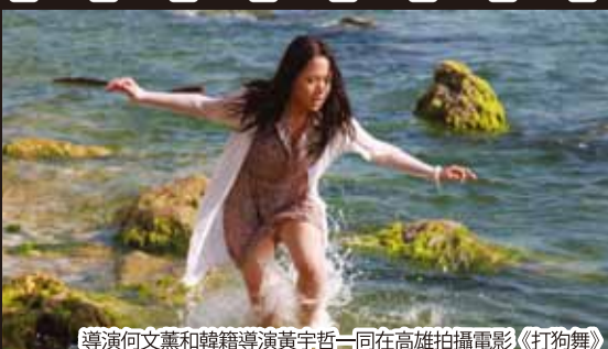
導演何文薰和韓籍導演黃宇哲一同在高雄拍攝電影《打狗舞》