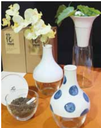
夕口設計推出的「花1/2多功能複合花器」

【東京／採訪報導】TOKYO DESIGNERS WEEK 2013於10月26日至11月4日，在東京明治神宮外苑繪畫館前廣場舉行，來自世界各地的設計好手和學子們，紛紛展出自己最獨特的設計和其他設計師一較究竟、相互切磋，而在這個設計圈交流的場合中，當然少不了近來推廣設計軟實力的台灣，不管在Design Next展、年輕設計師展(Young Creator EX)或是學校作品展(School EX)、專業展(Professional EX)等展場，都可見到台灣作品參展。