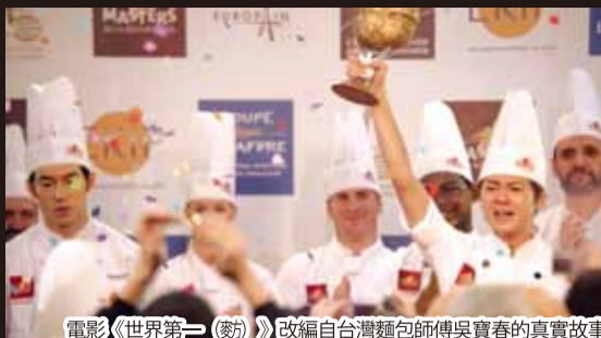
電影《世界第一(麩)》改編自台灣麵包師傅吳寶春的真实故事