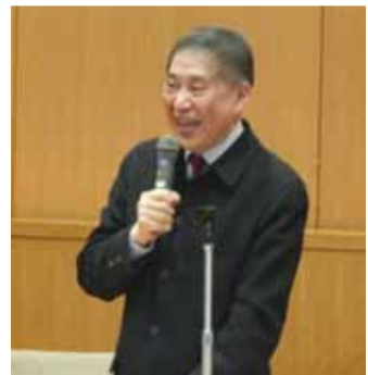
白先勇時隔13年再度到東京大學開講，暢談他在著作《台北人》中的歷史架構史聯繫在一起，白先勇則表示中國的歷史沿續性強，從西晉東遷，到北宋南渡，再到國民政府遷台，這些歷史是可以串聯在一起的。