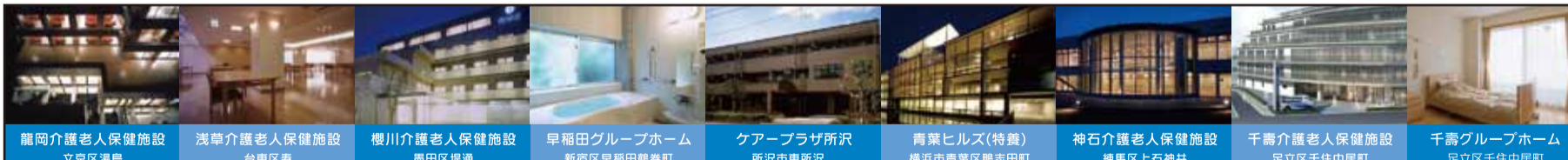
龍岡介護老人保健施設 文京区湯島