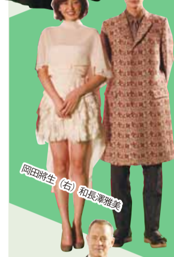
岡田將生(右)和長澤雅美