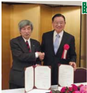
三三會和台日商務交流協進會會長江丙坤(右)和日本早稻田大學副校長橋本周司，簽署合作協定