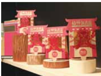
帶有台南特色的Q版神明造型書籤