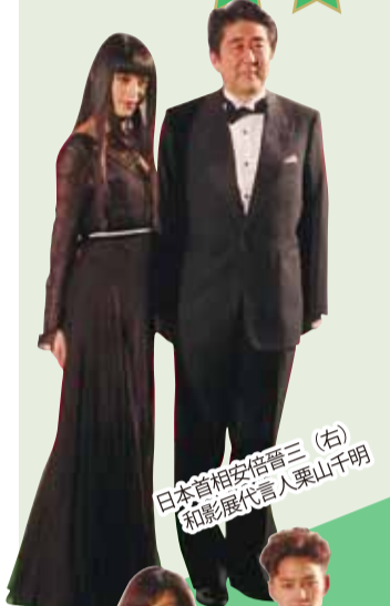
日本首相安倍晉三(右)和影展代言人栗山千明