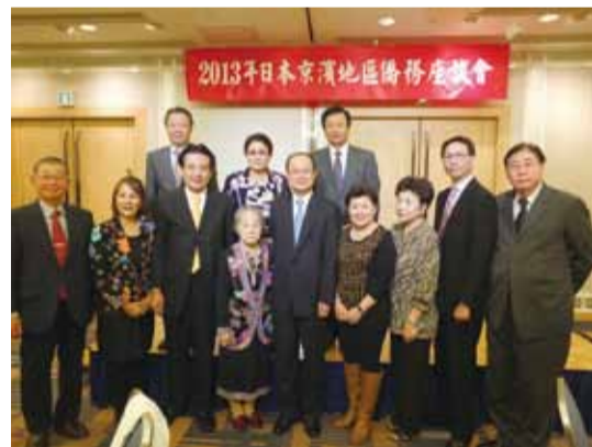
僑務委員與駐日代表沈斯淳（前排左5）、副代表陳調和（後排右）與僑務組長趙雲華（後排左）合影