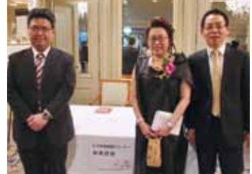
駐日代表處領務組在會場設攤服務民眾