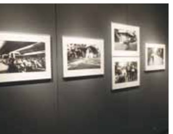
潮田展子用黑白照片記錄台北和台灣各地民眾的生活樣態