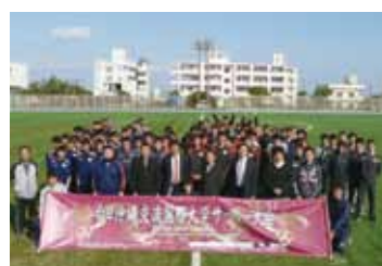
駐那霸辦事處處長蘇啟誠與國立台灣體育運動大學足球隊及參賽對伍合影

另外,新竹縣關西國小少棒隊則於3月29日和30日兩天在沖繩縣北谷町參加第4屆少男少女棒球營活動,和當地球隊切磋球技,主辦單位也於活動期間邀請活躍於日本職棒的退休選手為參加選手進行投球、打擊的技術指導,而參加選手皆表示受益良多。與會的日本職業運動退休人員聯盟代表理事田幡博表示,台灣職棒投手的投球實力在國際水準之上,但下半身體能訓練稍嫌不足,因此建議如能加強訓練,未來可在世界棒壇上有優異表現。