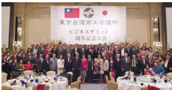
全體與會賓客合影