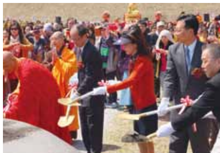
駐日代表沈斯淳伉儷(右起3、4)和彰化縣長卓伯源(右2)一起參加動土儀式

【群馬／採訪報導】日本佛光山總本山法水寺於4月13日舉行動土典禮,星雲大師、駐日代表處代表沈斯淳伉儷、彰化縣長卓伯源和群馬縣議會議員星名建市等人蒞臨以外,包括來自日本各地佛光山分院信眾與中國、比利時、捷克、法國和瑞士等國的信徒皆到場共襄盛舉,佛光會中華總會秘書長覺培法師表示應有超過千人參加這次的動土典禮。