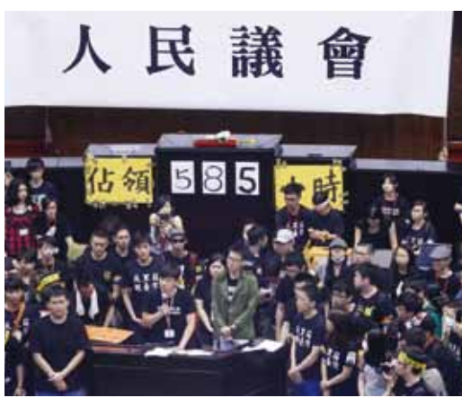
學生代表4月10日退出議場前在立法院內，掛上「人民議會」布幕，宣讀人民議會意見書並發表談話後步出議場。

【台北／綜合報導】以反對黑箱服貿為訴求的太陽花學運，自3月18日佔領立法院議場後，經過24天的抗爭，學生代表已於4月10日從立法院撤退，當天立法院外約有2萬名民眾聚集，迎接學生出關。學生代表也表示撤出立法院不是結束，而是希望