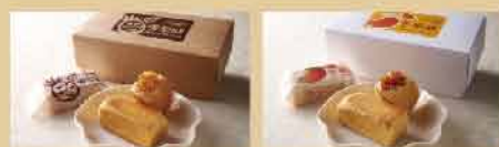
鳳梨酥八入/售價1429元/盒(不含消費稅) 芒果酥八入/售價1429元/盒(不含消費稅)

送禮，將滿滿的心意與好運送給您！ 楊家點心隆重推出超人氣伴手禮， 採台灣優質鳳梨及愛文芒果(與日本宮崎芒果同品種) 讓酸甜濃郁的果香在口中化開， 邀您親嚐陽光烘焙的熱帶滋味，分享給至親好友。