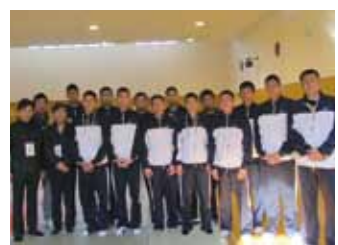
駐那霸辦事處處長蘇啟誠(前排左2)與能仁家商全體隊員合影

國立台灣體育運動大學足球隊是應沖繩縣足球協會邀請,於3月21日至26日到沖繩參加「台日沖繩交流國際大學足球賽」,和沖繩大學、沖繩國際大學、琉球大學及名櫻大學等對伍交流。沖繩縣足球協會表示會藉此交流機會,遴選優秀球員組隊參加今年夏天在台灣舉辦的台、中、韓、日及沖繩足球大賽。同時,能仁家商籃球隊也於21日至24日在沖繩參加「第13屆沖繩市長盃高中籃球賽」,與其他5支日本球隊一較高下。