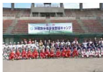
參與第4屆少男少女棒球營活動的選手和出席貴賓合影