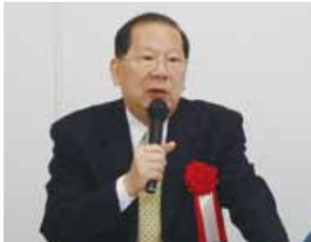
海外信保基金董事長薛盛華為京阪神地區的台僑商說明海外信保基金

【大阪／採訪報導】關西台商會於4月6日舉辦「信保基金對海外僑台商融資保證」講座暨春季懇親會，當天邀請海外信用保證基金董事長薛盛華和業務處長劉彩雲到場，為關西地區僑商、台商說明政府三大信用保證基金之一的海外信用保證基金，同時正在大阪進行訪問的立法委員呂學樟也到場和僑民交流。