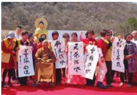
星雲大師與現場響應墨寶義賣的信徒合影