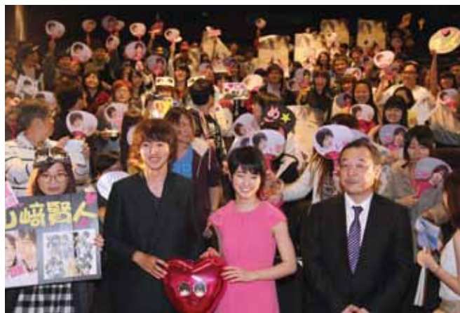
電影《鄰居·同居》在台舉辦世界首映見面會，男主角山崎賢人（前左）和女主角剛力彩芽（前中）及導演川村泰祐（前右）等人，特地出席和影迷互動

剛力彩芽等人隔天則在返日前參加電影首映會，剛力彩芽透露電影播放期間仔細觀察了台灣影迷，意外發現台灣觀眾和日本觀眾的笑點似乎不太一樣，讓她想直接問粉絲說