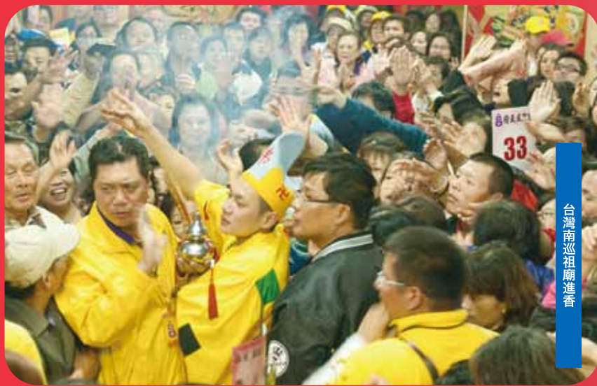
台灣南巡祖廟進香