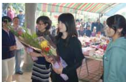
有客家血統的日本女星余貴美子(右2)日前和家人首次返台祭祖掃墓。東崇正會會長周子秋則表示對余貴美子的母親來說，一位82歲的客家媳婦，終於可以第一次在祖先前完成讓公公、婆婆落葉歸根的心願，必定讓她感觸良多，因此得以看見她眼淚直流的感人畫面。

中壢市郊的十二世祖曾應公派下祖塔掃墓，並循古禮進行燒香、請神和行三獻禮等祭掃儀式，她在現場也以客家話向大家問好，並表示可以第一次和宗親一起祭祖，感到很開心，她相信祖父必定會很高興，也希望明年能再回到家鄉和大家見面。稍後，一行人則前往新竹縣芎林鄉受余家麟堂兄弟的孫子午餐招待，余貴美子提到希望可以幫祖父設靈位的心願，取得宗親的同意後，再前往位在峨眉鄉的十三世祖慶芳公房祖塔報告，而期間一路隨行的日本關