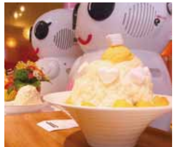
分量大的冰品適合多人分食