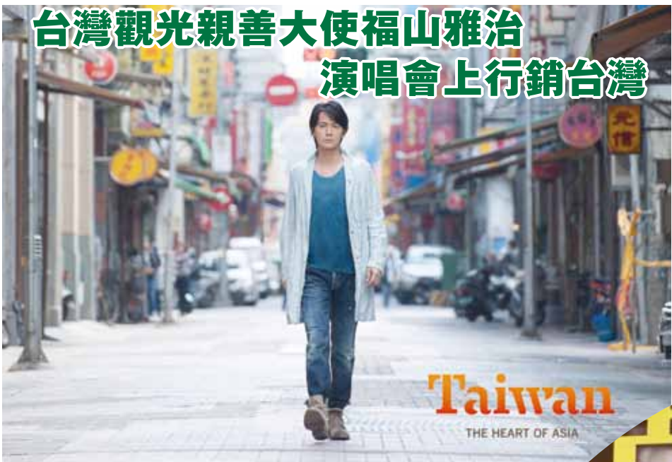
參加福山雅治日本巡迴演唱會的歌迷，都可獲得限量版的福山雅治明信片

【東京／綜合報導】受邀擔任台灣觀光親善大使的日本人氣偶像福山雅治，今年2月造訪台灣時，在台北大稻埕拍攝的觀光宣傳影片，於4月5日起跑的日本巡迴演唱會上首度曝光。根據觀光局表示，這段影片將會在福山雅治在日本舉行的14場巡迴演唱會開場前播放，此外，每位入場的歌迷也能拿到一張由福山參與企劃製作的限量版台灣明信片，觀光局希望藉此能吸引更多日客到台觀光。