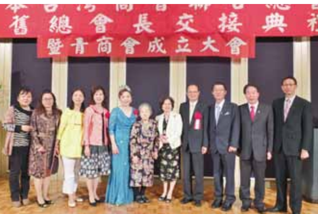
第2屆總會長與副總會長、幹部們與來賓合影

重要的一年，所以我們也很期待未來的一年，謝總會長可以帶領我們重回日本以前的榮光。