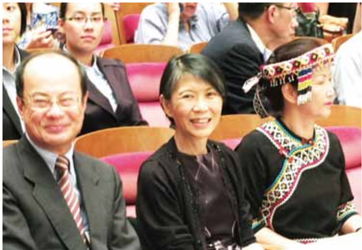
總統夫人周美青(中)和駐日代表沈斯淳(左)及台灣原聲音樂學校校長洪春滿(右)，一同在台下聆聽小朋友的演唱

【東京、橫濱／採訪報導】總統夫人周美青於7月31日率領台灣原聲童聲合唱團抵達日本東京，展開一連串的演出和親善訪問。擔任合唱團榮譽團長的周美青，由於是首度公開訪日，因此她的一舉一動格外受到注目，此行周美青除了在台下聆聽合唱團2場大型演出之外，也同行前往老人院訪問，並於8月4日出席故宮文物展換展活動，返台當天則到橫濱中華學院與僑生互動，藉由行動表達對僑教的關心。