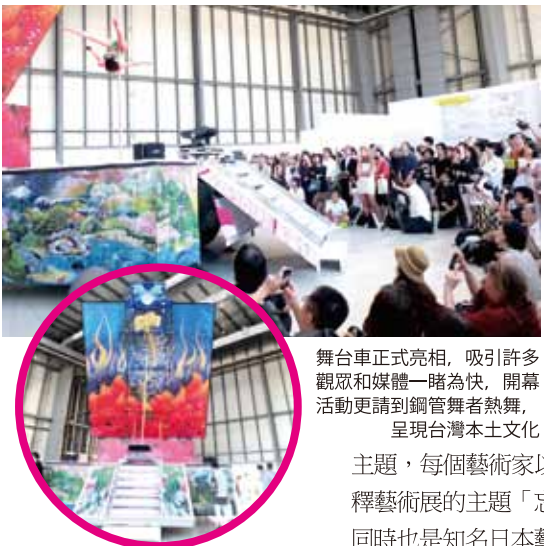
舞台車正式亮相，吸引許多觀眾和媒體一睹為快，開幕活動更請到鋼管舞者熱舞，呈現台灣本土文化

【橫濱／採訪報導】日本藝術家柳美和引進台灣移動式舞台車，做為她明年舞台劇《日輪之翼》巡迴公演之用，而這輛百分百台灣製造的舞台車，7月31日首度在橫濱三年展(Yokohama Triennale 2014)的開幕儀式中，正式在日本民眾前亮相。