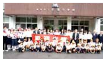
美彌市於福中學校歡迎駐福岡辦事處人員到訪

戎義俊在演講中介紹台日關係和歷史淵源，並以「讀萬卷書，行萬里路」勉勵現場學生養成閱讀與旅行習慣，進而增加人生經驗，此外，駐處人員則分享外交工作的甘苦談和解說台灣教育現