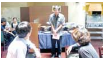
駐那霸辦事處處長蘇啟誠與留學生互動交流

【那霸／綜合報導】駐那霸辦事處為加強跟轄區內台灣留學生的交流，特別於8月9日邀請在沖繩的台灣留學生、交換留學生、語言班學生和早年留學台灣醫學