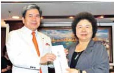
熊本縣知事浦島郁夫(左)拜會高雄市長，並捐贈在熊本縣內募得的800多萬日幣善款

「81石化氣爆」震驚全台，台灣企業、民眾也紛紛慷慨解囊，包括長榮、台塑、鴻海、宏達電、日月光和華碩等企業捐款逾億，同時在全家、OK超商、萊爾富等便利超商也啟動小額捐款代收，根據全家便利商店表示截至8月12日代收捐款截止前，透過該超商系統的小額捐款總額超過2億8千萬元。另外，演藝圈和電視台等單位也舉辦募款晚會，超過50位藝人接力為災民獻唱，替災區祈福打氣，旅