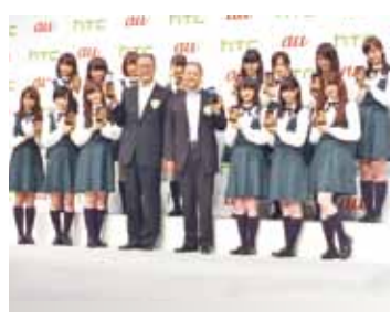
乃木坂46成員和HTC執行長周永明(前排右4)和KDDI社長田中孝司(前排右5)同台推銷第2代蝴蝶機