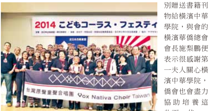
合唱團和榮譽團長周美青，及駐日代表沈斯淳伉儷在台上合影

周美青以說故事的方式向現場同學們介紹書法家王羲之、蘇東坡和現代書法家董陽孜，並提到僅有中文文字兼具藝術性的特色，她也提醒小朋友到東京國立博物館參觀目前正在舉行的故宮「神品至寶展」，一窺中華文化之奧妙，稍後則和同學們玩起問答遊戲，互動相當熟絡。此行，周美青也特別贈送書籍刊物給橫濱中華學院，與會的橫濱華僑總會會長施梨鵬便表示很感謝第一夫人關心橫濱中華學院，僑會也會盡力協助培養這些下一代。