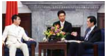
總統馬英九接見日本眾議員河井克行，並對日前廣島地區豪雨成災表達關切之意

行一入就經濟、觀光和文化領域的台日交流現況作說明，且提到希望台日雙方能持續推動洽簽《經濟夥伴協議》(EPA)及《避免雙重課稅協定》(DTA)，以促進台日貿易自由化，讓雙方經貿關係更上層樓。