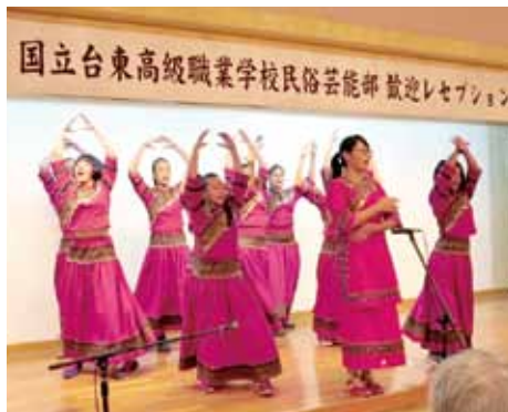
台東商職學生表演原住民舞蹈

晚會上，八重山台灣親善交流協會沖繩支部部長宮野照男表示，為感謝戰前台灣農業墾殖者嘉惠八重山地方農業，去年4月成立親善交流協會，隨後便組團前往彰化進行交流，因