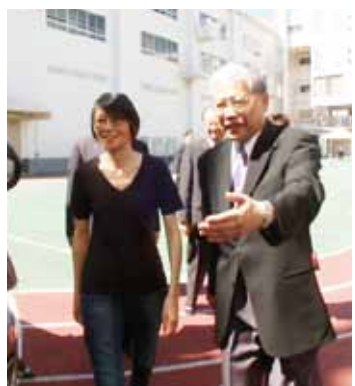
僑務委員長陳士魁(右)引導總統夫人周美青到場

總統夫人周美青訪日最後的行程是於5日一早，在僑委會委員長陳士魁、駐日代表沈斯淳伉儷及駐橫濱辦事處處長粘信士伉儷等人的陪同下，前往橫濱中華學院參訪，並以「周老師」的身分為正在上暑期班的同學們上一堂關於中華文化書法藝術的課程，用實際行動關心華僑教育。