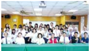
長野縣蓼科高校與高雄市鳳山商工師生合照

【高雄／綜合報導】日本學生趁暑假來台交流正夯，日前熊本縣青少年大使團與吉祥物「熊本熊」(KUMAMON)一同前往高雄進行5天的訪問，除了到竹圍國小與學生進行交流之外，也拜訪高雄市政府，另外來自長野縣的蓼科高校師生，同時也在高雄鳳山商工體驗當地文化。 前往高雄參訪的熊本縣青少年大使團，是由30名國小5年級到高中生所組成，他們將日本傳統遊戲翻花繩、劍玉和玩笑福神帶到竹圍國小與該校學生交流，竹圍國小的學生也演出皮影戲版的西遊記，並教導日本學生製作皮影戲偶。雖然雙方學生語言不通，但大家比手畫腳的，仍然玩得很開心。