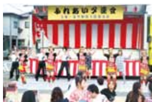
甲斐市的民眾邊享用美食邊觀賞台灣原住民舞蹈演出

民和台灣民眾在日急難救助外，也秉持推廣台日交流為宗旨，在日協助政府推行僑務政策並與駐日代表處配合，進而深化台日民眾的交流。