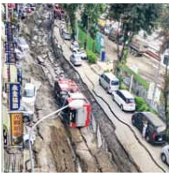
高雄發生大規模氣爆，一夜過後，凱旋三路滿目瘡痍

【高雄／綜合報導】台灣高雄7月31日深夜至8月1日凌晨發生一連串氣爆事件，導致30人死亡，300多人受傷，氣爆地點多在高雄市內主要幹道，包括三多一、二路和凱旋三路及一心一路等道路皆受到嚴重損壞，根據高雄市政府估計重建約需費時3個月，經費高達19億1千萬元左右，目前除了獲得中央政府補助之外，來自台灣各地和海外的捐款也不斷湧入高雄市政府設立的募款專戶，截至8月20日，高雄市政府社會局統計收到超過35億元的捐款，並表示陸續會將款項使用在各項重建計畫。