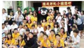
高雄市竹圍國小以皮影戲來歡迎熊本縣青少年大使團