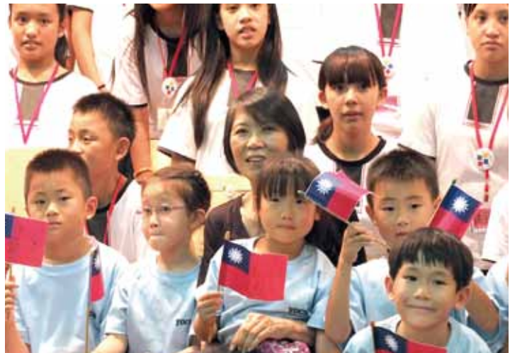
原聲童聲合唱團和橫濱中華學院小學生與周美青合影

此次周美青和原聲童聲合唱團訪日，有部分不公開行程，其中包括到老人院進行訪問，馬彼得透露小朋友與周美青訪問2家老人院，演唱《故鄉》和《紅蜻蜓》等日文歌，和院內老人家們一起進行交流，他也表示希望可以藉此讓小朋友們學會關懷。