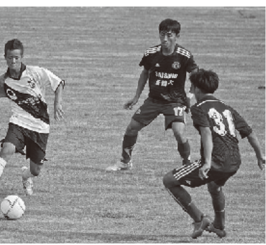
台中市FCと琉球代表の試合の様子

なお、8月7日に行われた決勝戦で琉球代表は、前半マカオにおされ、同大会初めての先制点を奪われたが、後半15分に同点ゴール。しかしその際、後半から入った琉球代表