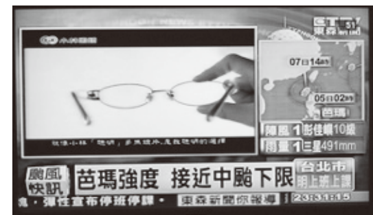
CM中も流れつづける台風のニュース

台湾では、政府の判断が当たる時もあれば外れることもしばしば。午前中は大雨強風だったのに、午後は青空が!みたいなこともあるわけです。政府の判断がはずれ、天気になると学生らは喜んで映画やショッピングに出掛けますが、大人たちは仕事があるのに出社できなかったわけですからそれは大変です。もっと慎重に判断を下してほしいといった意見も多く、以前より「台風休暇」は少なくなったようです。私が経験した「台風休暇」も半年に1回だけ。実はその日、気乗りのしないデートに誘われていて…。「台風休暇」がデートをお断りするちょうどいい理由になりました(笑)