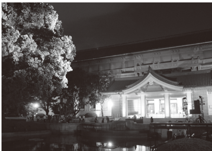
ライトアップされた東京国立博物館

東京国立博物館(以下:東博)で開催中の台北國立故宮博物院的特別展「神品至宝」でサポーターを務める歌手の一青窈さんが8月1日、鮮やかにライトアップされた東博本館前でミニライブを開催した。ライブでは同展のイメージソングとして一青窈さんが歌詞を書き下ろした新曲「LINE」や代表曲の「ハナミズキ」、「もらい泣き」を初披露した。会場に集まった7