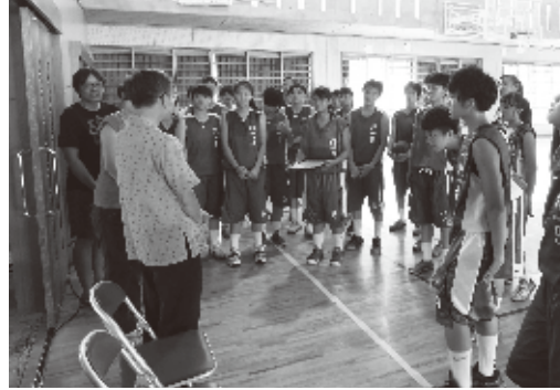
北一女女子バスケットチームを歓迎した蘇処長

国内の球場の設備は整っており、選手の水準もとても高く素晴らしい。来年もまた訪れたい」と話した。略コーチは「今回の沖縄合宿は訓練を通して、成果を出すことができた。爽り多い合宿となった。今後も、双方の交流を促進していきたい」と話していた。