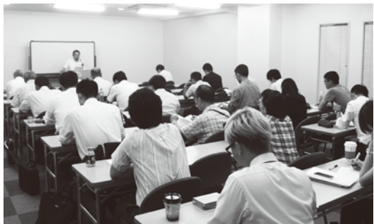
講演会は満席だった

権が支持されないところで、抜きん出て總統に相応しい候補者がいないというのが今の現状である。浅野教授は「11月の地方選挙、あるいは2016年の總統選挙に向けては政党支持の開きがほとんどない状態での選挙を迎えるだろう。つまり誰がでも可能性はあるということ。2008年總統選挙当時の馬英九ほどの人材がいらないのは明らかだ」と述べている。同会に参加した台湾人留学生は「台湾の若者が考えなければならないのは、国民党か民進党かといった党だけの話ではなく、台湾の未来にとってどのような政策が大切かということだと思います」と話した。 浅野教授のいう「11月の地方選挙」は、台湾では「九合一選挙」と呼ばれる大規模な選挙の事である。9種類の選挙が一斉に行われるが、なかでも1番の注目は6大都市市長選挙だ。この選挙は2016年の總統選に影響してくる。とりわけ台北市市長選挙は、次期總統の有力候補の1人となる可能性が高い。これまでの傾向として、總統を勤めた李登輝氏、陳水扁氏、そして現職の馬英九總統が台北市市長を務めた後に總統に当選していることがその要因に挙げられる。11月の九合一選挙で、彼らを超える次世代のスター誕生となるか、今後の台湾政治の動向に注目したい。