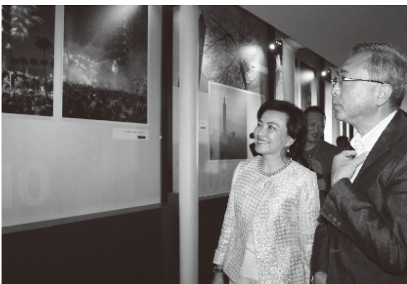
写真展見学の様子

東京スカイツリーは8月1日、台湾の高層ビル「台北101」から撮影した写真24点を展示した「Time For Taiwan-台北101開業10周年記念-台北101国際写真コンクールベストフォト写真展」を開催した。4日にはそれを祝した記念セレモニーも行われ、台湾から多くの報道陣も駆け付けた。