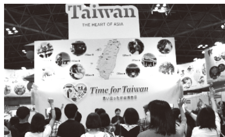
2013年JATA Tourism EXPO Japanの様子

フォーマンス、商談コーナー、伝統工芸体験コーナー、茶芸コーナーのほか、台湾観光PRイメージキャラクター「囍熊(オーション)」が登場するなど、台湾各地のパラダイスに富んだ魅力を紹介します。