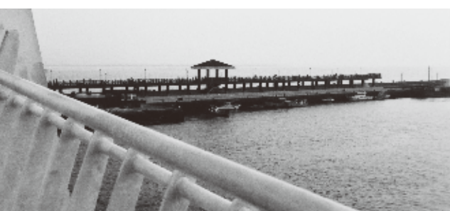
淡水の地は「夕焼けを見ずして淡水に来たというなかれ」と言われるほど、夕映えが美しい

て、ブーゲンビリアの街路樹を、くぐりぬけてゆく。棧橋の突端では、恋人たちが額をよせあう姿が次第にシルエットと化し、いれかわりに傍らのペットボトルが西日に透きとおりはじめ。——あなたがここにいないのではなく、どこかにきついているということ——ひとりきりで台湾の彼の訪れを待っていた。淡水河のほとりにて。 淡水河は台北の市街地を流れるさいにも、その静けさを失うことはない。なんと清浄な気に満ちあふれているのだろう、中国大陸の長江、韓国の漢江、タイのチャオプラヤ河、ミャンマーのイラワジ河と、これまでにいくつもの大河を目にしたけれども、これほどまでにいつ見ても変わることなく、瞑想にも似た静謐(せいひつ)さを、たたえた空間を目にしたことはない。そういえば1999年、台湾では「流浪到淡水」——淡水に流れていて、という歌が流行したと