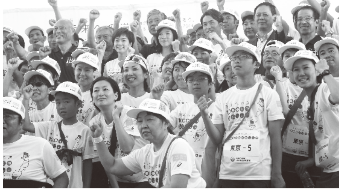
謝依旻さんが「未来への道1000キロ縦断リレー」に参加

東京都及び都スポーツ文化事業団が8月7日に開催した復興支援リレー「未来への道1000キロ縦断リレー」の最終区間に台湾出身の囲碁女流棋士・謝依旻さんがゲストランナーとして参加した。このイベントは東日本大震災の風化を防止し、全国と被災地の絆を深めるために企画された。