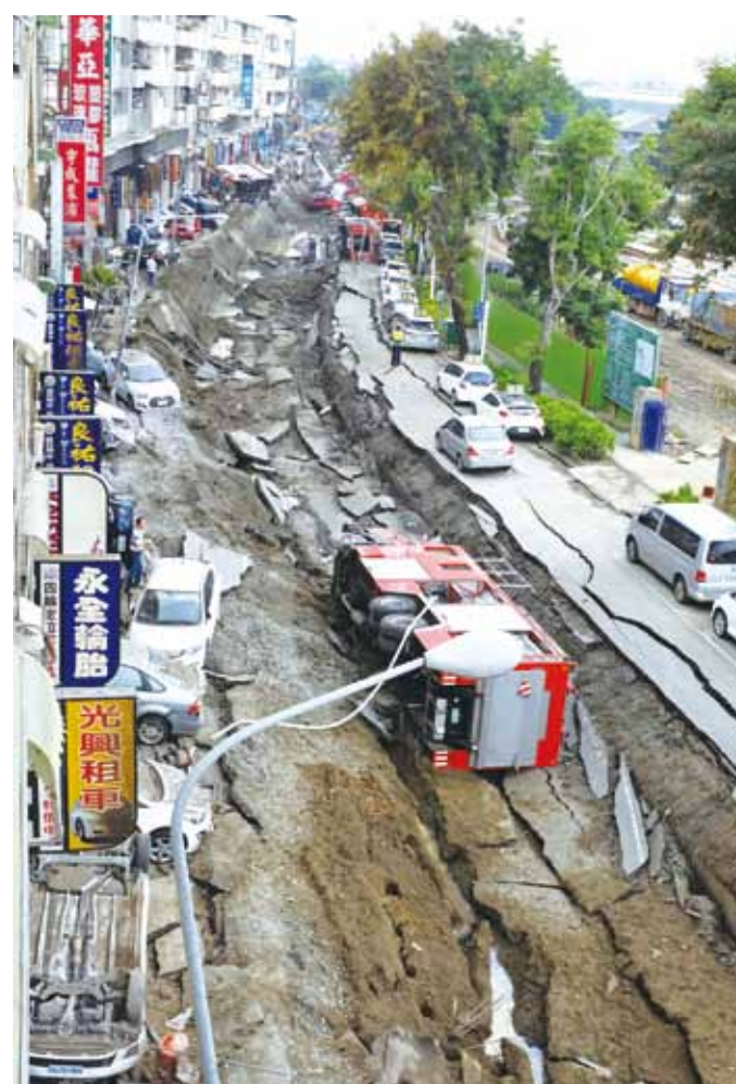
高雄大規模爆発による被害