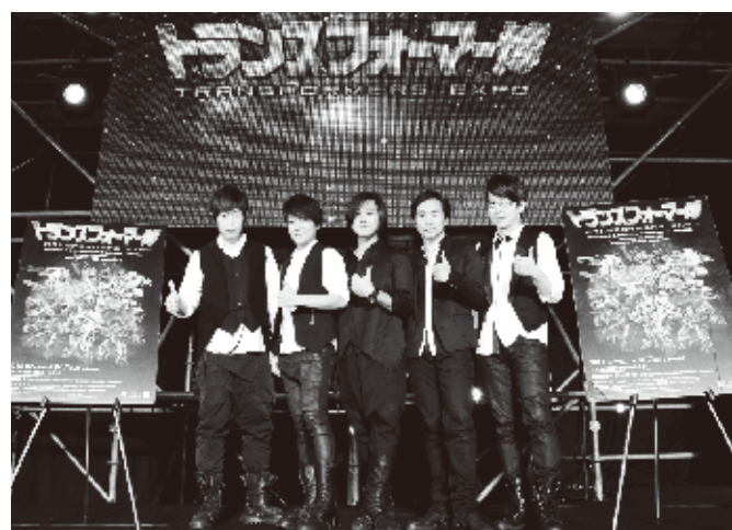
5人組ロックバンドのMayday

最近では日本ドラマの主題歌に選ばれるなど、日本での活動も増え続けているアジアで圧倒的な人気を誇る5人組ロックバンド「Mayday(五月天)」は8月15日、Maydayの「DNA」がテーマソングに起用されているトランスフォーマー博にスペシャルゲストとして参加し、トークイベントを行った。同イベントでは自身の紹介や、トランスフォーマーへの想いを語ったほか、抽選で選ばれた20人のファンとのフォトセッションで交流を図った。以前コンサートツアーで、タクシーがト