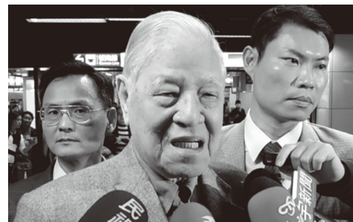
李登輝元總統

小和田会長は「去年5月にも李登輝元總統は高座会70周年記念大会に来ていただく予定であったが、体調の関係で中止となった経過がある。李登輝さんはもう91歳のため、おそらく今回が最後の訪日になるのではないかと述べた。また、同事務局の袖原正敬氏は「今までも2、3回体調不良が原因で訪日がキャンセルされているため、今回もひやひやしなご迎えの準備をしている。とにかく体調を崩されないように願っている状況だ」と述べた。 李氏の今回の訪日を実現すれば、2009年以来5年ぶり、總統退任後の2001年4月、2004年12月、2007年5月、2008年9月、2009年9月に続く6度目の訪日