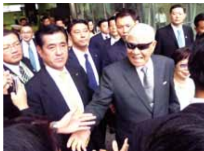
李登輝搭乘新幹線從大阪到東京時，一出車站便受到僑民和日本友人的歡迎

最後，李登輝呼籲民眾要對日本歷史和文化感到驕傲，恢復信心與自尊，其結果將為東亞地區帶來安定與和平，也將為日本和台灣帶來更良好的關係。日本和台灣是命運共同體，日本好則台灣好，反之亦然，衷心期許日本走向真正獨立自主的國家。與會出席大阪場演講的眾議員大