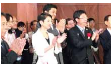
開幕典禮上包括參眾議員蓮舫和岸信夫(左4、3)等人皆出席參加

灣的藝術家們，在當時變動激烈的時代，經過國族認同和文化衝擊的歷練之下，用青春的生命完成一幅幅作品，成就他們的藝術生命，也奠定了台灣近代美術的基礎。她也提到這是第一次在國外有如此規模的展覽，呈現台灣近代美術的樣貌。賴清德則表示台南市政府為表彰陳澄波在美術及美術教育的貢獻，因此特別舉辦這個百二誕辰巡迴大展，第4站來到東京意義重大，因為展覽地點正是他的母校，而且是跟他13位前後期的同學一起展出，就像是同學會一樣，此外，賴清德也認為透過這樣的交流可讓台日之間交