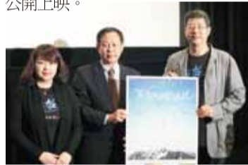
《看見台灣》一片導演齊柏林(右)和製片會瓊瑤(左)在東京出席特別試映會，與駐日代表處副代表徐瑞瑚合影