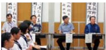
駐那霸辦事處處長蘇啟誠(右2)和沖繩縣教育長諸見里明(右1)等人，列席聽取學生發表作品

繼去年赴台交流成功，今年沖繩縣教育委員會再度甄選20位縣內高中生書法好手，於9月29日至10月4日抵台進行訪問，期間計劃與台北市第一女子高級中學和國立台灣師範大學附屬高中進行書法交流，並安排聽取書法大師張炳煌講授電子書法和對學生作品的講評。沖繩縣教育委員會於行前特別舉辦激勵壯行會，應邀出席的駐那霸辦事處處長蘇啟誠，談到沖繩當地書法教室林立，習字的風氣鼎盛，更盛於台灣，頗有「禮失求諸野」之感，蘇啟誠盼學生經由交流互相切磋精進，擴大國際視野，以達成縣廳培育次世代領導人的初衷。