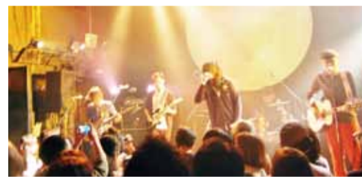
今年獲得金曲獎最佳樂團獎的麋先生，在東京的Livehouse開唱，驚艷日本歌迷

，並應要求演唱了多首安可歌曲，HIGH翻現場，也有不少觀眾表示可以認識新的台灣樂團感到很開心，更對於台灣的音樂文化感到驚艷，這也間接代表了麋先生成功地用音樂征服了日本歌迷。