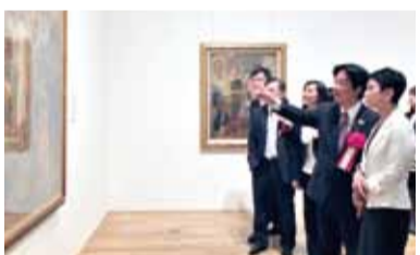
身為台南女兒的日本參議員蓮舫和台南市長賴清德一起觀看展覽

【東京／採訪報導】今年初從台灣台南開始起跑的「陳澄波百二誕辰東亞巡迴大展」，巡迴中國北京、上海後，接著來到日本東京，於即日起至10月26日在東京藝術大學大學美術館展出。由於東京藝術大學正是這些台灣第一代藝術家的母校，因此包括陳澄波等共14位藝術家的作品得以集結