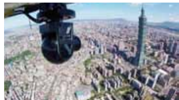
《看見台灣》帶領觀眾用不同的角度，重新認識台灣

【東京／採訪報導】全台首部空拍紀錄片《看見台灣》(日文片名：天空からの招待状)，去年在台灣上映創下突破2億新台幣的票房紀錄，更拿下第50屆金馬獎最佳紀錄片獎，為近年屢創佳績的台灣影視界再寫下歷史新頁。