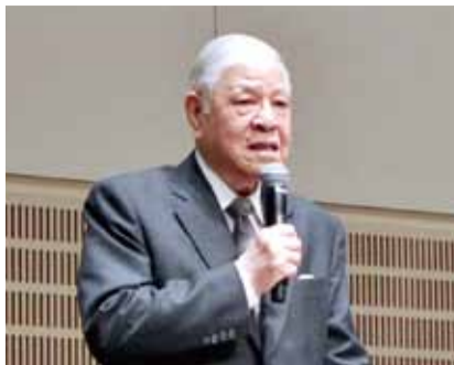
圖為9月21日李登輝出席東京演講時的場景

【大阪、東京／綜合採訪報導】前總統李登輝睽違5年第6度造訪日本，此次乃是應日本李登輝之友會的邀請前來，走訪大阪、東京和北海道等地。9月19日李登輝一行人抵達大阪後，便於下榻飯店舉行記者會，說明此行主要是視察中子線、重粒線等治療癌症的先進技術，希望能引進台灣造福民眾，並參訪神奈川縣川崎市的浮島太陽能