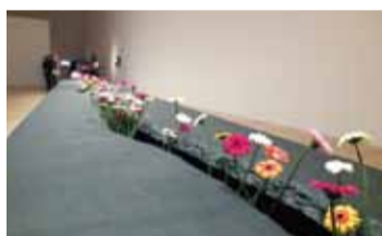
李明維的《移動花園》，觀展者可以從展場中取一朵花，送給陌生人，從中看「施與受」關係

李明維希望可以透過展覽和日本民眾分享「關係美學」的創作過程和其世界觀，而展覽中呈現的「關係美學」正是空間概念、日常生活進行式、歷史文化社會與個人記憶牽絆等內容，以一種「參加型」的藝術展方式來呈現，藝術家為觀展者縫衣服、一對一共进晚餐，或是提供鮮花，讓觀展者送花給陌生人等作品，使得原本陳列在展場的藝術作品因為有了觀展者的參與，才得與成為真正的作品，進而讓人思考現代的人際關係美學，正如李明維所說，「開幕時，展覽會的完成