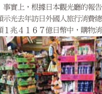
台灣旅客來日最愛採買的藥妝品自10月1日起也可免稅

【台北、東京／綜合報導】日本政府為提高外國旅客在日本消費的意願, 於今年10月1日起正式實施免稅新制, 未來在日本消費包括食品、藥妝、煙酒等消耗品, 只要每人在同一店家當天消費超過5000日幣以上, 便可辦理退稅, 退稅上限不可超過50萬日幣, 這對於許多喜愛到日本購買藥妝的台灣旅客來說是個好消息。