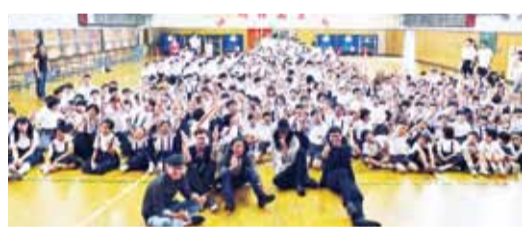
麋先生和學生們分享完自己的經驗後，特別跟全校學生一起合影