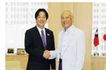
台南市長賴清德拜會東京都知事舩添要一

多多進行交流，賴清德則認為舩添以將東京都打造成「安全、福祉、領先」三個第一為目標，因此他也在現場邀請舩添到台南訪問，讓台南汲取東京的城市治理經驗，相信對台南未來的市政推行有莫大的幫助。