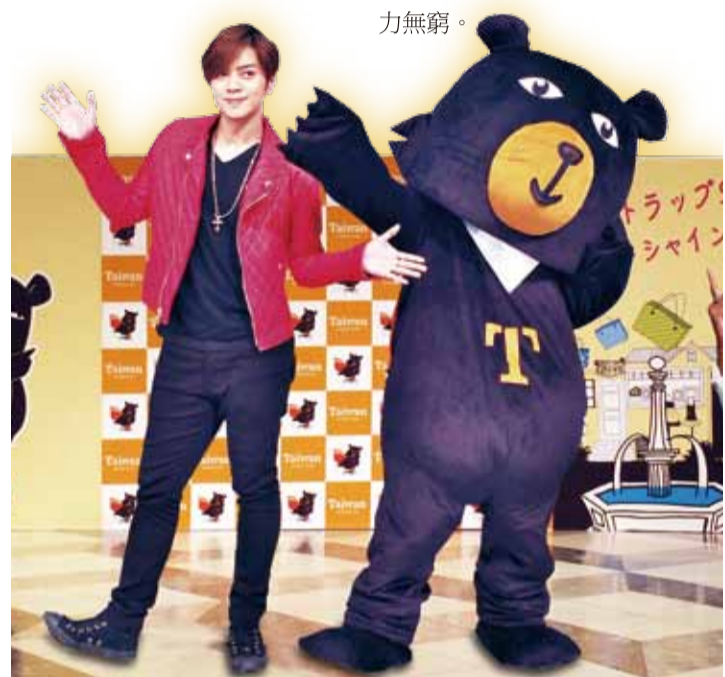
小豬和啞熊一起賣萌行銷台灣

現場有不少身穿「TAIWAN一番」T恤的日本粉絲，都是今年7月曾前往台北參加觀光局