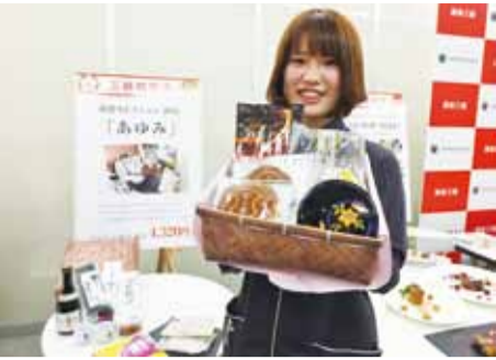
三越百貨銀座店則有「精選和食組合」福袋，征服外國客的味蕾，限量30組

【東京／綜合報導】時序接近年底，日本百貨業者紛紛公開「2015年福袋」商品，以吸引消費者的注意，今年包括日本三越伊勢丹控股公司和西武百貨池袋本店不約而同地推出以「享受未來」或以「未來」為主題的福袋商品，希望消費者可以感受幸福、享受日本文化和傳統工藝之美。