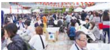
會場人潮絡繹不絕

欣華會和大阪佛光山寺與佛光會等僑團皆設攤販售茶葉蛋、刈包等家鄉口味和素食米粉與蘿蔔糕等餐點，大阪佛光山監寺永輪法師表示希望透過佛光會員的發心參與當地活動，推廣素食料理，與大眾結緣，讓大家可以有機會接觸佛教。另外，平常難得一見的豬腳、排骨、芒果冰和台灣啤酒等台灣美食、小吃應有盡有，各攤位前大排長龍，人潮絡繹不絕。