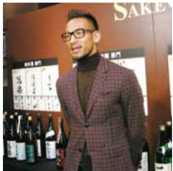
中田英壽出席日本酒大賽,盼透過大賽讓世界各地的人也能簡單認識日本酒

出席頒獎典禮的中田英壽表示,由於外國人不太認識日本酒,像「大吟釀」和「吟釀」之間的差異,是比較難解說的部份,所以藉