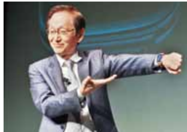
華碩董事長施崇棠在日本記者會上，正式宣布ZenWatch在日本首賣

【東京／採訪報導】台灣知名品牌華碩於10月28日，在日本東京舉辦首場手機發表會，會中宣布於11月8日正式在日本開賣ZenFone 5，而該品牌首款穿戴式通訊裝置ZenWatch則於11月下旬開賣。華碩董事長施崇棠表示因為看好日本消費者對高階通訊裝置的需求，因此將ZenWatch智慧手錶的首賣放在日本。