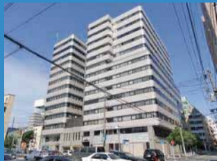
ストークタワー大通り公園iii 区分駐車場 1,650万円 20.03%