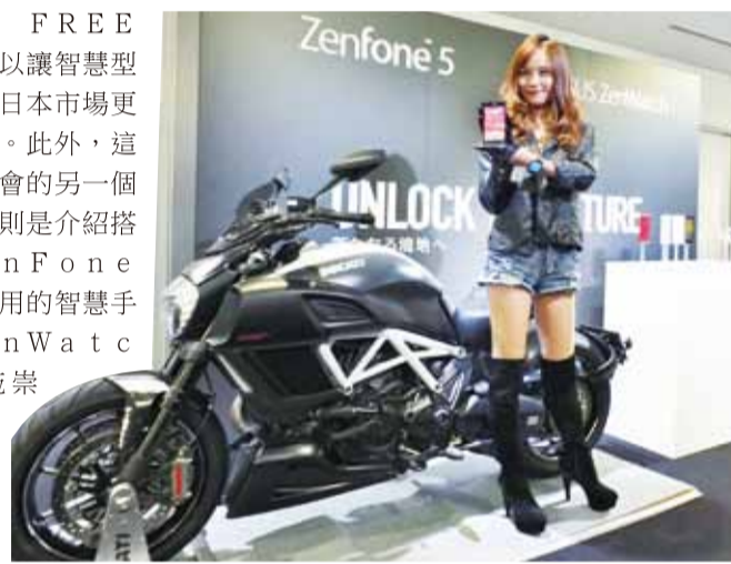
華碩在日本首次推出手機商品，便以ZenFone 5和ZenWatch迎戰日本市場

月下旬在日本首賣。價格上，華碩則延續在台灣和中國等地的低價策略，ZenFone 5在日本市場的建議售價16GB為2萬6800日幣，32GB為2萬9800日幣，ZenWatch的建議售價則為2萬9800日幣，為競爭激烈的日本通訊市場投下一顆震撼彈。