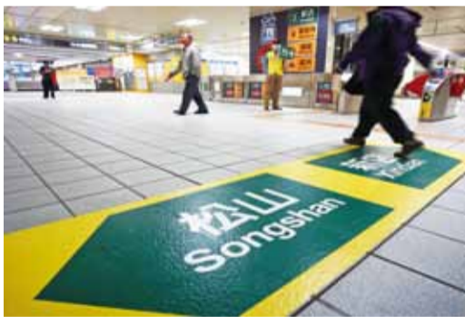
台北捷運松山線11月15日正式開通,首日便有34.5萬人次搭乘

【台北／綜合報導】台北捷運松山線於11月15日正式通車,這也使得台北捷運路網更加完整,不過隨著松山線的通車,以往大家熟悉的淡水—新店直通列車也隨之停駛,改以松山站連結至新店站,淡