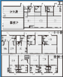
小金井駅 6,180万円 12.7%