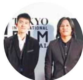
台灣導演張榮吉(右)和電影公司同事一同參加東京國際影展開幕影工作人員一同走上紅毯，成為此次影展中唯一的「台灣之光」。

此次受邀參加影展的台灣電影，僅有《逆光飛翔》導演張榮吉的最新作品《共犯》獲邀參加「世界焦點」部門，張榮吉和電