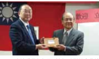
立法委員詹凱臣(左)致贈紀念品給大阪中華總會會長洪勝信

全球化的時代，台商早已遍及世界，其中以亞洲地區居多，而台商們在事業有成之餘，能積極融入當地社會並協助政府促進國民外交，期盼日本地區與東南亞各國台商僑民能齊心，成為政府推動外交的最大支柱。