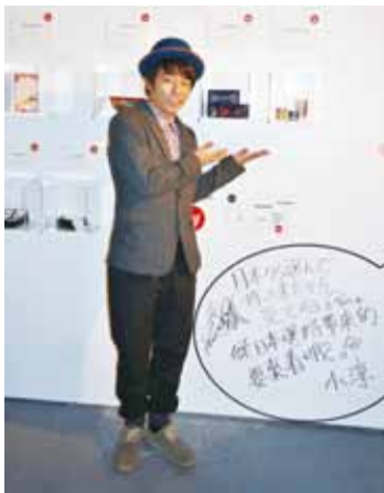
小淳精選幾款日本工藝品推薦給台灣民眾

【台北／採訪報導】日本搞笑組合「倫敦靴子」的成員田村淳(簡稱小淳),受邀出席11月6日至9日在台北松山文創園區舉辦的台北魅力展(Taipei In Style),小淳特地為首日登場的台灣設計師潘怡良與台灣愛普生科技(Epson),跨界合作的時裝秀「印紀」打頭陣走秀,輕鬆