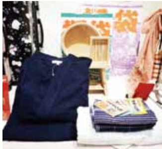
西武百貨池袋本店特別針對外國客推出限量5組的溫泉組合

西武百貨池袋本店則有內含日製雨傘、帽子、手套等配件的「Made in Japan」限定福袋，設計和風圖案吸引外國客購買，跟超人氣的Hello Kitty和美樂蒂的人氣商品直接裝入行李箱裡，讓消費者可以拉著限定「福箱」走。另外還有讓民眾在家也可以享受