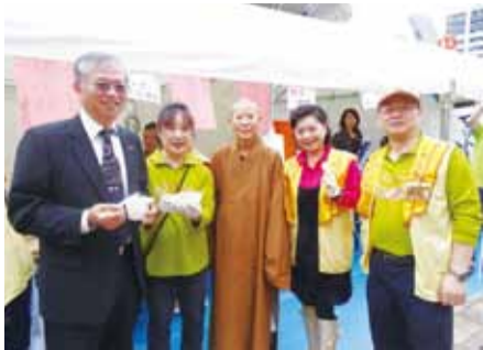
駐大阪辦事處處長蔡明耀(左1)到場問候僑胞

【大阪／採訪報導】第11屆華友祭於11月2日在大阪湊町河邊廣場盛大舉行，讓熱鬧的大阪市中心出現一日中華街，讓當地日本民眾有機會體驗中華文化的魅力。