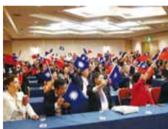
台商僑民齊聚為國民黨造勢

畫,和日本的「國家戰略特區」不謀而合,今年9月經濟部亦組團到神奈川縣進行投資招商說明,顯示台日經濟合作的潛在可能性,因而希望東京台灣商會可以進一步掌握商機。