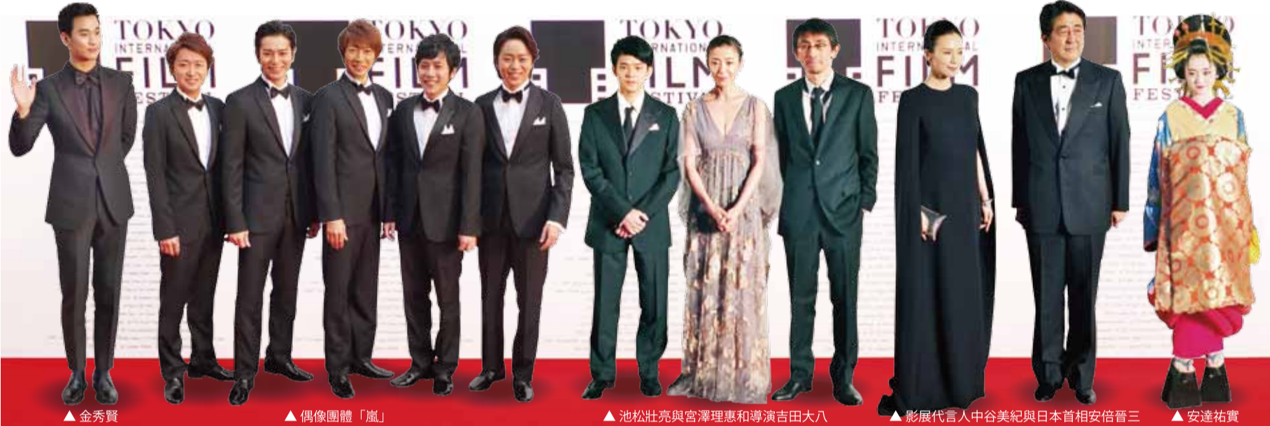
▲金秀賢 ▲偶像團體「嵐」 ▲池松壯亮與宮澤理惠和導演吉田大八 ▲影展代言人中谷美紀與日本首相安倍晉三 ▲安達祐實