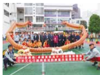
卓蘭高中師生與橫濱中華學院師生合影