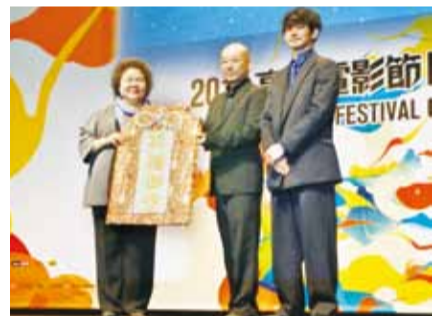
《真幌站前多田便利屋2》導演大森立嗣(中)和男星瑛太(右)特別贈送祈福御守給高雄市長陳菊(左)，為高雄市民打氣

瑛太和大森立嗣接受《台灣新聞》專訪時，透露這次訪台對台灣的好印象，讓他們興起和台灣合作拍片的想法，瑛太表示經過這次的經驗，讓他非常想看看台灣的電影作品，有機會可以合拍片的話應該會非常有