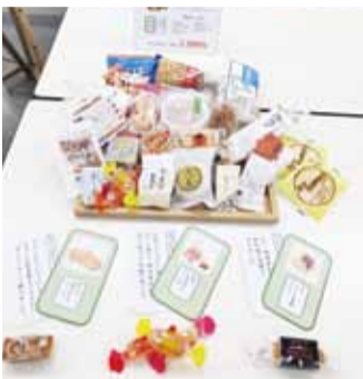
三越百貨銀座店另外推出日本47個都道府縣的點心組合，限量20組

在日本泡湯的限定福袋，包括木桶、肥皂盒、泡澡劑等商品應有盡有，即使回到台灣也可以回味在日本泡湯的趣味。