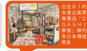
位在B1的日本復古風雜貨專賣店「DAGASHI 夢屋」陳列許多日本傳統的零食