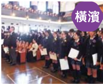
橫濱中華學院全體學生齊唱畢業歌及驪歌