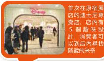
首次在原宿展店的迪士尼專賣店，店內有5個趣味設計，消費者可以到店內尋找隱藏的米奇

品之外，店內有5個地方分別有隱藏的米奇和藏在鏡子內的笑笑貓等設計，要讓迪士尼粉絲到店內消費之餘也可以享受尋找這些設計的樂趣。