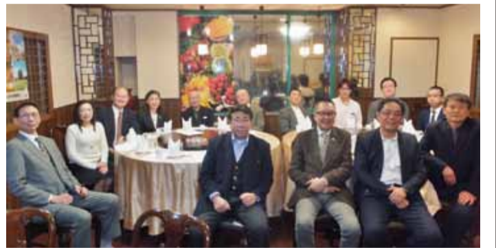
駐處處長粘信士伉儷和與會僑領合影

座談會中，部分僑領關心今年橫濱華僑總會會長選舉情形，認為該會會長改選動見觀瞻，盼能選出有領導能力，且足以代表橫濱對外關係的會長人選。另外，針對橫濱中華學校校舍改建一事，由於改建工程牽涉廣泛，因此與會僑領皆表示需要所有的僑領群策群力，才能完成這項計畫。