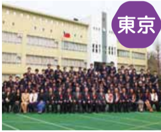
東京中華學校全體畢業生與賓客合影留念