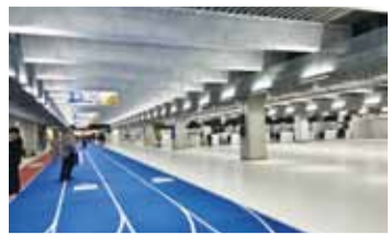
成田機場將於4月8日啟用廉價航空專用的第3航廈