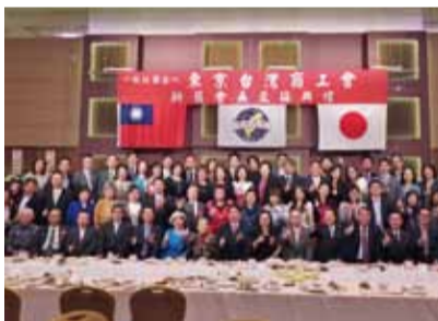
東京台灣商工會於3月28日舉行第1屆和第2屆會長交接，當天晚上有近百人出席與會