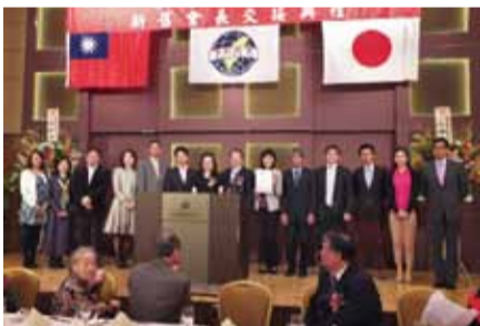
第1屆會長特別頒贈感謝狀給副會長和執行部成員，感謝他們在任期內的協助與服務