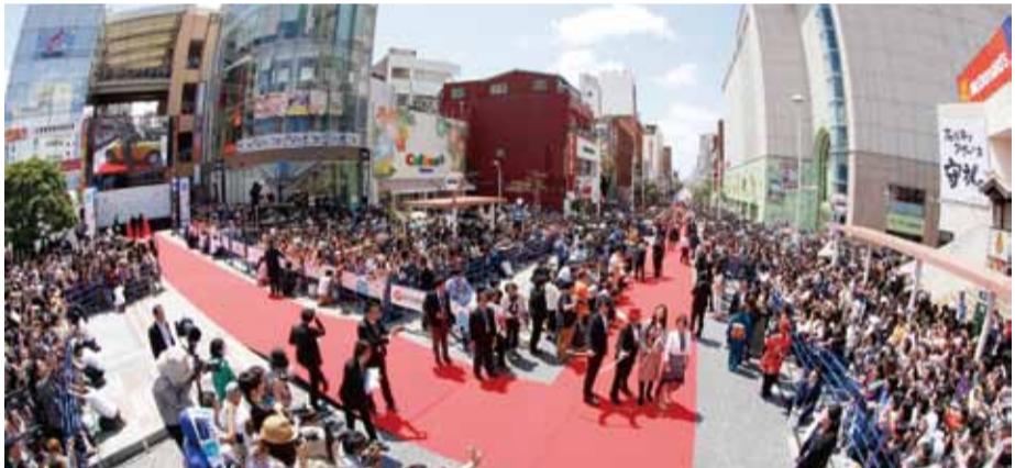
沖繩國際電影節於3月29日在國際通舉行閉幕星光大道，現場有近6萬人參加