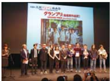
台灣電影《行動代號：孫中山》獲得大阪亞洲影展最佳影片獎

【大阪／綜合採訪報導】第10屆大阪亞洲影展於3月6日開幕，日前(3月15日)舉行閉幕，閉幕前夕主辦單位宣布此屆影展獲獎作品，台灣電影《行動代號：孫中山》同時獲得最佳影片獎和觀眾票選獎，成為最大贏家。