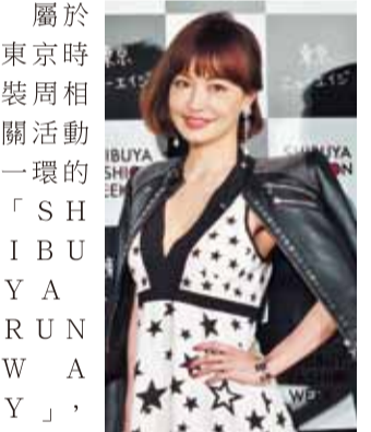
平子理沙笑說自己還是嬰兒時就愛逛渋谷了

【東京／採訪報導】第3屆「渋谷FASHION WEEK」於3月16日至29日,在渋谷地區盛大展開,「渋谷FASHION WEEK」的主要活動「SHIBUYA RUNWAY」則於3月21日在渋谷的金王八幡宮神社前的參道舉辦,是繼去年10月在渋谷封街辦秀以來另一創舉。擔任服裝秀特別嘉賓的模特兒平子理沙身穿星星圖案洋裝搭配黑色皮草騎士外套現身並表示,可以在神聖的神社前走秀,感覺很棒。此外,她還笑說自己從「嬰兒」時期就喜歡渋谷,也很常跟家族一起到渋谷用餐和逛街,展現對渋谷地區的喜愛。