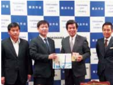
兩市議員姐妹會互贈紀念品

隨後參訪團一行人則拜會日華親善橫濱市議會議員聯盟，現場有橫濱市政府政策局長小林一美和經濟局長牧野孝一、港灣局長伊東慎介等人列席，日華親善橫濱市議會議員聯盟會長森