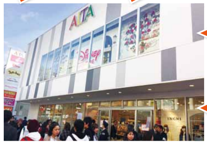
位於原宿竹下通內的原宿ALTA是日本全國第4家ALTA，主打年輕消費族群

另外，位在B1的大頭貼專門店「brooming」除了免費提供道具服裝拍攝之外，店內還有提供迷你3D雕像製作的服務，透過3D掃描機記錄頭部的立體影像後，再從店家提供的系統內挑選服裝和髮型，就可完成自己的3D雕像。店內完成掃描後，製作天數約需2~3周左右的時間，完成後可郵送到家，不過店員表示目前未提供海外郵送的服務，日後則視消費者需求會再行評估。