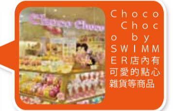
ChocoChoco by SWIMMER店內有可愛的點心雜貨等商品

另外，位在B1的大頭貼專門店「brooming」除了免費提供道具服裝拍攝之外，店內還有提供迷你3D雕像製作的服務，透過3D掃描機記錄頭部的立體影像後，再從店家提供的系統內挑選服裝和髮型，就可完成自己的3D雕像。店內完成掃描後，製作天數約需2~3周左右的時間，完成後可郵送到家，不過店員表示目前未提供海外郵送的服務，日後則視消費者需求會再行評估。