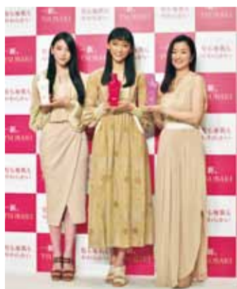
左起為三吉彩花、杏和鈴木京香，出席TSUBAKI新廣告發表記者會

【東京／採訪報導】日本化妝品大廠資生堂旗下的開架式髮妝品牌TSUBAKI(台灣譯為思波綺)，推出全新改版商品，並邀請歌手福山雅治演出新系列商品廣告，搭檔鈴木京香、杏和三吉彩花等人，成為第一位演