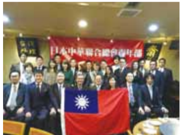
日本中華聯合總會青年部應邀與駐日代表沈斯淳進行交流