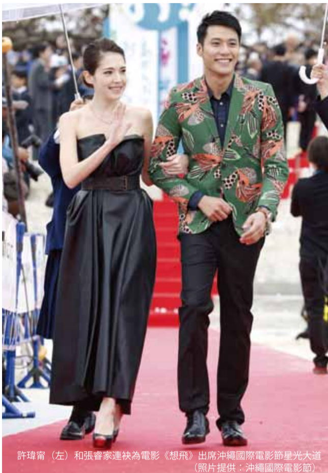
許瑋甯(左)和張睿家連袂為電影《想飛》出席沖繩國際電影節星光大道

25日開幕當天，在宜野灣展場中心旁的沙灘上，有超過3萬5000名觀眾聚集等著看藝人明星亮相走紅毯，包括總主持今田耕司、搞笑藝人組合「車庫拍賣」、「NON STYLE」、偶像團體NMB48、AMIAYA和韓國偶像團體超新星等人皆出席星光大道，另外，隨著電影版《五星級旅行社》一起參展的渡邊直美和山