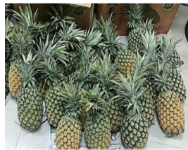
有「甜蜜蜜」之稱的台農16號鳳梨，果肉纖維細緻，酸甜適中