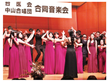
中山醫學大學合唱團演唱電影《不可能的任務》主題曲，俏皮的演出讓台下觀眾熱烈鼓掌

日本台醫人音樂會每年的音樂會活動是由高雄醫學大學、台北醫學大學、中山醫學大學和中國醫藥大學4校日本校友會輪流舉辦，自1996年開始舉辦音樂會以來，已有19年的歷史，今年負責主辦