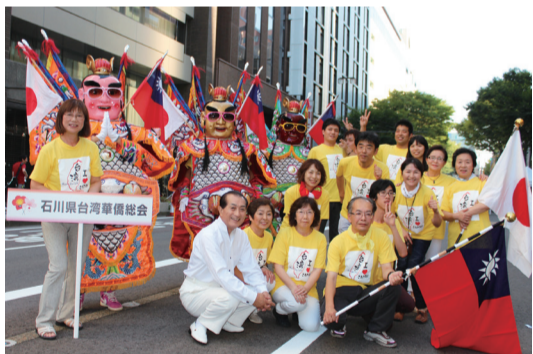
石川縣台灣華僑總會組隊參加金澤夢之街嘉年華會

參與演出的石川縣台灣華僑總會會員和留學生們，則自早上練習沿途歡跳至夜晚，該會表示看到觀眾們感動的淚水，覺得一切辛苦都值得了，今後也會繼續努力將台灣特有文化推向國際舞台，介紹給日本民眾認識。