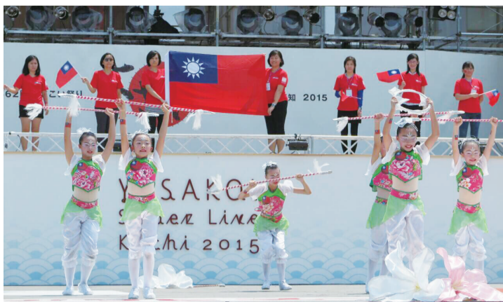
新竹縣十興國小啦啦舞社成員應邀在高知縣夜來祭演出，舞台上國旗飄揚

【高知／綜合報導】新竹縣十興國小啦啦舞社獲邀參加8月10日在高知縣舉辦的「夜來祭」，展現客家心，舞出台灣的熱情。