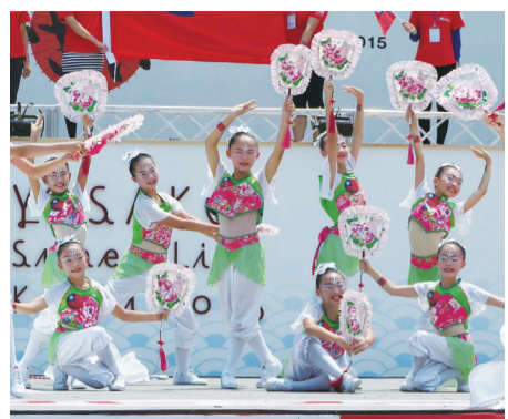
新竹縣十興國小啦啦舞社成員化身桐花仙子 舞出客家精神

當地華僑則熱烈歡迎並熱情招待台灣新竹縣團員，致贈當地特產、禮品，並介紹當地文化特色，僑民上島彩表示能在高知縣看到台灣同胞表演及國旗飄揚在國外，內心激動不已，感動到熱淚盈眶，希望每年都能來高知交流，促進雙方的發展。