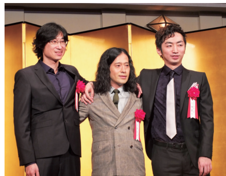
左起為獲得直木賞的旅日台灣作家王震緒，以及獲得芥川賞的又吉直樹和羽田圭介，三人出席第153屆芥川賞和直木賞的頒獎典禮