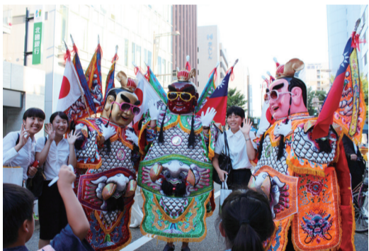
許多日本民眾搶著和電音三太子合影