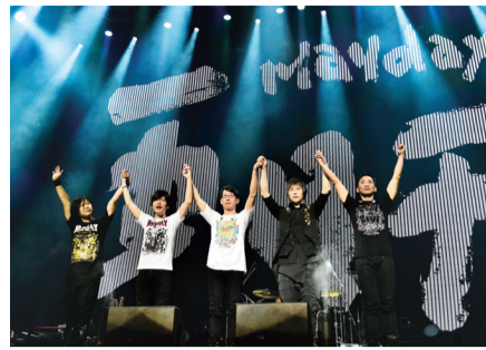
五月天首登武道館開唱，感謝歌迷支持，並宣告演出結束後，將閉關創作

【東京／採訪報導】台灣搖滾天團五月天於8月28日、29日登上有日本搖滾樂聖殿之稱的武道館，連續兩天開唱，成為華人樂團第一團，吸引包括日本、台灣、中國和香港等地的樂迷到場朝聖。