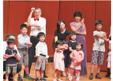
在台日醫人的第2代和第3代登台演出，讓台下觀眾直呼卡哇伊

的中山醫學大學適逢該校創辦人百歲冥誕，和創校55周年的紀念，因而到日演出別具意義。