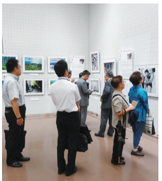
到場民眾細細品味展出作品

【大阪／採訪報導】「光影·敘事—台灣女性攝影家作品展」自去年開始陸續在日本各地展出後，於8月25日至30日再度回到大阪，於大阪市立美術館和IFA國際美術展聯合展出。25日的開幕儀式上，包括大阪市議會議長東貴之、副議長木下吉信和大阪市議員宮脇希等當地政要，