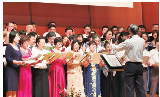
中山醫學大學校友會合唱團超過80位成員從台灣到日本參與演出，和在日校友會成員一起合唱《感念》

合唱團和校友會合唱團，演唱《朋友再見》和《感念》等曲目，跨世代、跨地域串連起校友們的情誼。