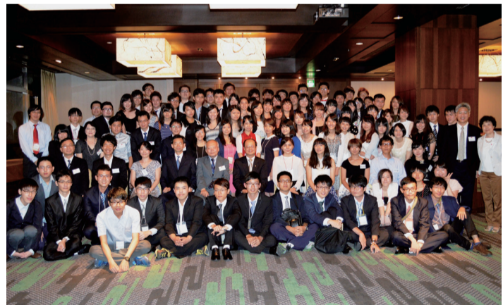
駐日代表處舉辦歡迎晚會，招待近百位參加第10屆台日學生會議活動學生

辦後，輪流在台日舉辦至今，10年來已有約千位台日學生互相交流，顯示台日學生間的交流情誼深厚。 駐日代表沈斯淳在會中便表示台日學生會議的各項研討交流活動，不僅建立起台日學生互相認識連繫的管道，同時也提供了台日學生深度接觸的機會，可以認識和關心彼此的歷史、文化、語言和生活經驗。 沈斯淳也提到近年台日之間在產業、教育、文化和科技等層面的交流及合作更加熱絡，營造出「特別夥伴關係」，日後代表處也將繼續深化和拓展新的合作及交流層面，盼年輕朋友可以為台日未來發展交流扮演橋梁角色。