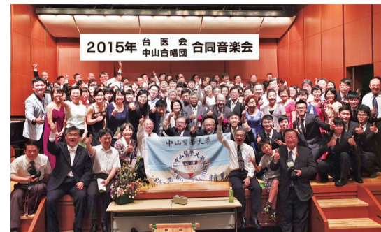
第19屆日本台醫人音樂會由中山醫學大學在日校友會承辦，加上來自台灣的校友，會場相當的熱鬧