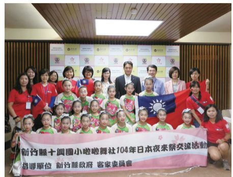
新竹縣十興國小啦啦舞社共18位學員應邀到高知縣參加夜來祭演出，並拜會高知縣知事尾崎正直 (後排右4)