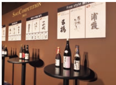
今年共有1028項酒品參加比賽,是世界最大規模的日本酒大賽的認知,相對地日本酒的入門並不會太難,他相信其他海外的市場應該也可以理解。

5年間走訪近250個酒藏的中田英壽表示,日本約有1200至1300個酒藏,希望有機會可以全部走訪一遍,再透過日本食文化的推廣結合日本酒,讓日本酒文化更加普及。此外,中田也提到過去旅居義大利期間,累積不少對葡萄酒的了解,也正因為有了對葡萄酒