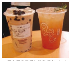
日本民眾最愛的珍珠奶茶(左)可依個人喜愛調整甜度和冰量(圖右為水果茶)

【東京／採訪報導】來自台灣台中的泡沫茶飲品牌「貢茶」，繼成功進軍中國和東南亞各地，東北亞在韓國展店之後，延伸事業版圖到日本，9月27日在原宿開設第一家店鋪，業者則提前於16和17日舉辦內覽會，吸引眾多對台灣茶飲好奇的日本媒體到場。 台灣泡沫茶飲除了珍珠奶茶之外，一般日本消費者所知不多，日本觀光客愛喝的珍珠奶茶，來日卻水土不服，好不容易打進市場的知名品牌，不見台灣的街頭庶民風格，改採高檔路線。這次貢茶以合作方式在日本由日本人用日式思維來出店，主打休閒感，而台灣流行的減糖、去冰等配合消費者需求客製化的作法也引進日本，株式會社貢茶日本營運