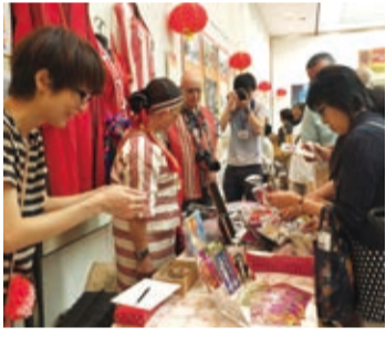
現場有販售像是原住民或是台灣创意设计的小物

當天的重頭戲則是下午舉辦的電影《KANO》放映會,主辦單位特別找來在片中飾演棒球教練的日