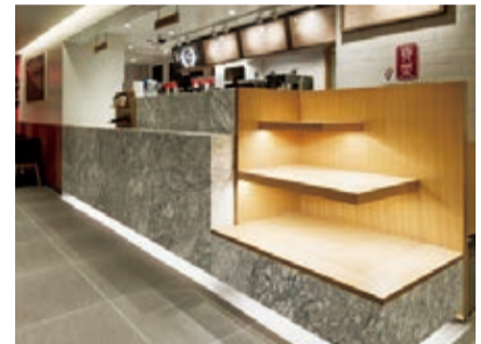
貢茶原宿店內設計以韓國店舖設計為基準

長葛目良輔便表示，雖然配合日本口味，日本店標準製程的甜度減低，但消費者依然可以根據自己的喜好，無糖、加甜度或減冰等，都能在現場提供服務。 店中使用的機材和原料都號稱是台灣原汁原味，唯獨裝潢以韓國店面為基準，呈現東北亞流行的雅痞風，在東京流行集地原宿來說顯得獨樹一格。除了茶葉以外，在美式咖啡連鎖店才會販賣的隨行杯，以及貢茶獨有的泡茶杯等，都是東京店才有的周邊商品。來自台灣的茶葉和珍珠，混上東京味能展現出什麼不一樣的風貌，也令人期待。