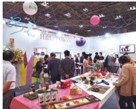
客家委員會首度以「Hakka TAIWAN」主題館參加東京國際禮品展