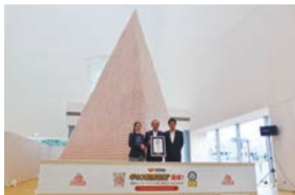
日清食品為慶祝合味道杯麵上市44周年,以5萬7155碗合味道杯麵堆疊金字塔,獲金氏世界紀錄認證

【橫濱/採訪報導】日清食品為慶祝該公司推出的日清合味道杯麵上市44周年紀念,在位於橫濱的「安藤百福發明紀念館」內以合味道杯麵堆疊金字塔,挑戰世界最大的商品金字塔的金氏世界紀錄。