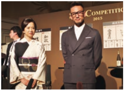
中田英壽(右)和女星和久井映見(左)一同出席日本酒大賽頒獎典禮,努力推廣日本酒文化

【東京/採訪報導】對日本酒相當有研究的前日本足球國家代表隊選手中田英壽,和女星和久井映見,