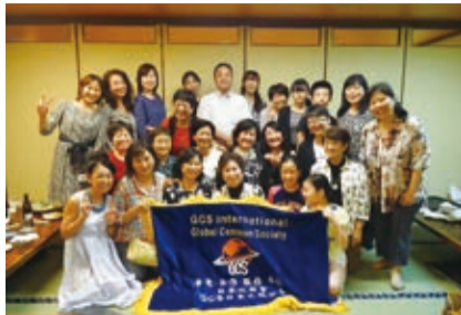
欣華會中秋聚餐全體合影