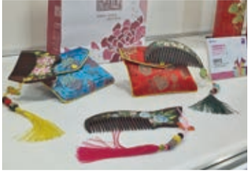
天象國際有限公司推出結合客家花卉彩繪的「紫檀彩繪木梳」