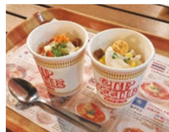
今年夏天麵條街推出合味道杯麵冰淇淋,有原味(右)和咖哩(左)兩種口味

達5000人次,自2011年開幕至今已突破400萬人次,其中不乏許多來自台灣、中國和歐美等地的旅客。館內除了展示速食麵的發展歷史和創意發想等主題之外,也有陳列日本和世界各國的泡麵,讓不少人驚艷世界各地泡麵種類的多元與豐富性。紀念館4樓的「麵條街」則有義大利、韓國、越南和泰國等8國的麵食料理可品嚐,今年夏天開始推出合味道杯麵口味的冰淇淋,以合味道杯麵經典的原味醬油口味和咖哩口味冰淇淋,加上杯麵實際使用的乾燥蔬菜,口味相當獨特,因而吸引不少民眾到場嘗鮮,有機會到安藤百福發明紀念館一遊的民眾不妨也試試看這個新奇的杯麵冰淇淋。