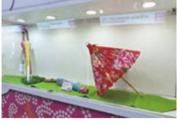
美濃李家傘工場的客家花布傘也在會場中展出