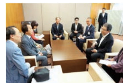
台北市副市長林欽榮率市府團隊拜會橫濱市政府。

【橫濱／綜合報導】台北市副市長林欽榮日前率領該市府資訊局和地政局等一級主管到日本參訪，9月7日一行人在駐橫濱辦事處處長粘信士等人的陪同下，前往橫濱市政府參訪，和該市副市長渡邊巧教等人交換意見。