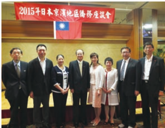
駐日代表沈斯淳伉儷(右4、5)出席懇親會，與現任僑務委員合影

【東京／採訪報導】日本京濱地區僑務座談會於9月17日在東京都內登場，由駐日副代表陳調和偕同僑務組組長王東生、秘書宋惠芸以及證照組組長陳振宗等人出席，和京濱地區僑務榮譽職身分的僑界人士交換意見。稍晚，駐日代表沈斯淳伉儷則出席懇親餐會，進行交流。