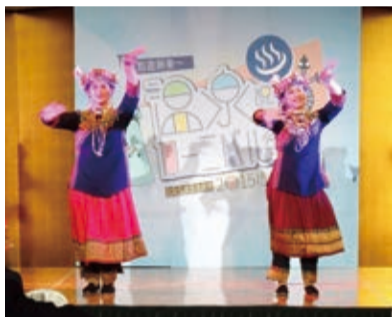
排灣族舞蹈為晚會揭幕。