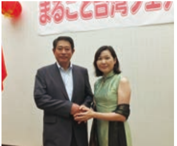
杉並區區長田中良(左)和駐日代表處政務組長張淑玲(右)出席活動剪綵儀式並提到很懷念在台灣吃到滷肉飯的味道,希望有機會再到台灣品嚐美食。

現場販售台灣美食和食材的攤位前,總是有絡繹不絕的民眾排隊採購,就有曾到台灣旅遊的民眾為了一嘗道地的滷肉飯而到現場排隊,