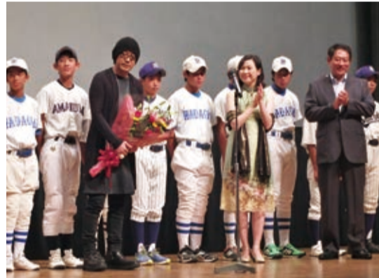
永瀨正敏(前排左1)出席杉並區台灣市集活動的電影映前會,為棒球小將加油打氣

【東京／採訪報導】東京都杉並區交流協會於9月13日在「Session杉並」舉辦第3屆的「台灣