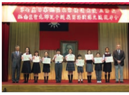
第7屆日本地區三僑校國語演講觀摩交流會於9月26日在東京中華學校舉辦，駐日副代表陳調和(左1)到場鼓勵學生

此次演講觀摩交流會，小學組、中學組和高中組分別以「學校的一天」、「求學的目的」和「如何節能減排維護環境」為題發表，學生們字正腔圓的演說，不時以手勢強調演說重點，或是添加表演元素，不僅展現學生們深厚的中文底子，也讓人感受到僑校學生們的活力。代表學校演講的同學皆獲頒獎狀和圖書禮卷以茲鼓勵，另外，活動中也有安排東京中華學校小學一年級到三年級的學生表演弟子規朗誦和新詩朗讀，活潑可愛的模樣引起全場熱烈的掌聲，也讓人見識到未來的華語人才潛力。