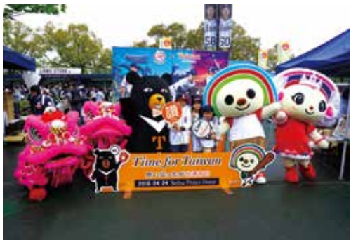
観光ブース横で台湾キャラクターたちと記念撮影

抽選で台湾デーオリジナルタンブラーや台湾お茶パックなどが当たるスタンプラリーや、1組2人に台湾旅行(3泊4日間)が当たる抽選会、写真撮影が可能な台湾観光名所及び台湾出身3選手がデザインされたパネルの設置、同じく台湾出身3選手の出身地の観光名所がデザインされたクリアファイルの配布を行った。また、ドーム前広場では、本格的な台湾の味が楽しめるグルメワゴンや、郭俊麟投手おすすめの魯肉飯販売も行われ、どちらも長蛇の列が出来るほど大人気だった。