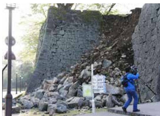
熊本城の城壁崩壊

ここ数年、地震などの天災が多発している日本と台湾。大きな被害がでる度に、日台間で救い合いの連鎖が起きている。熊本県で4月14日夜に最大震度7を記録した大地震発生後も、熊本県を中心に余震が相次いでいる事や被害の苛酷さを受け、台湾からの支援の動きが広がった。