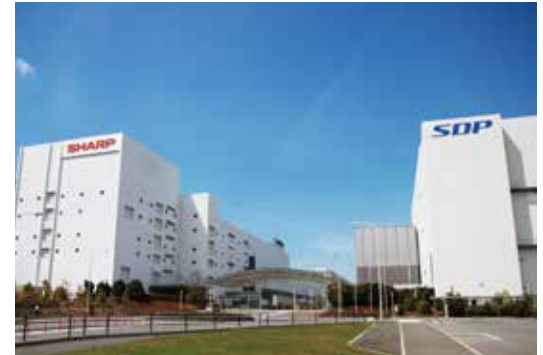
調印式と記者会見は鴻海とシャープが共同経営する堺工場が開かれた