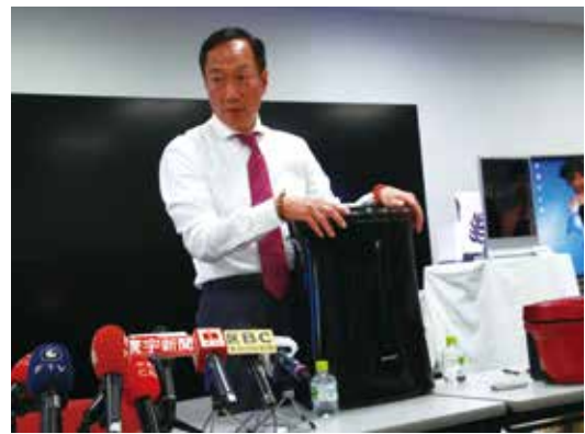
シャープの白物家電を説明する郭董事長

郭董事長は最初に、「シャープが持つIGZO技術は、テレビやスマートフォンの高画質と薄型化を実現できる次世代の表示装置