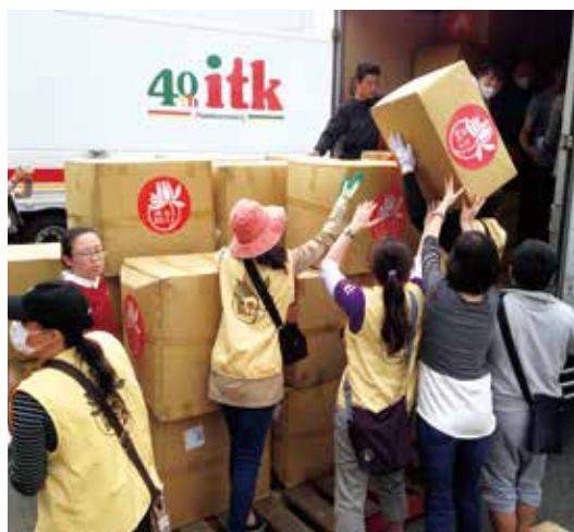
物資は信者の手で手際よく積み込まれた

熊本地震の「本震」とされた4月16日から僅か4日後の20日、台湾から大量の支援物資が被害の大きかった益城町に届け、被災者を大いに勇気づけた。