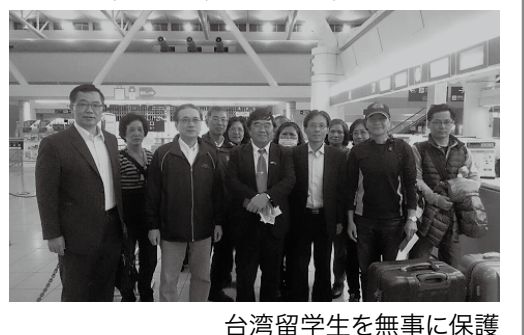
台湾留学生を無事に保護

外交部は4月17日、熊本地域で発生した大地震の影響で台湾の留学生28人が孤立状態となっていたが、台北駐大阪経済文化弁事処福岡分処が車両を手配して全員を救助したと発表した。外交部によると、同14日夜に熊本県で発生した大地震により、同県内では多くの地域で断水や停電などが続き、生活機能に深刻な影響が出ている。福岡分処は直ちに緊急対応チームを組織し、全職員及びその家族を動員して被災地に住む台湾出身者及び台湾の留学生の安否確認を行った。現在までに台湾出身者や留学生たちは全員の無事が確認されている。福岡分処は同16日以降、絶えず情報を提供するとともに、熊本市内で足止めされて