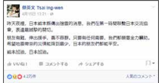
蔡英文氏も真っ先にFacebookでメッセージを送った

なお、華僑界としては、在日台湾不動産協会が100万円、日本台湾商會連合総会が200万円、媽祖廟が226万円の義援金をそれぞれ熊本に寄付した。(元=ニュー台湾ドル)