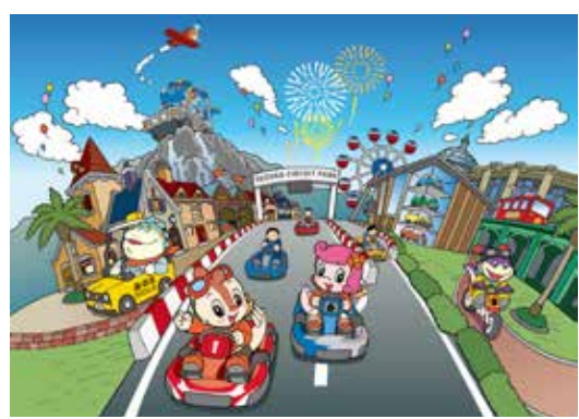
日本と同じくコチラファミリーも登場

同ショッピングモールは、高雄国際空港から地下鉄(高雄 MRT)で1駅の草衙駅に近接し、最寄り的高速道路出口からは250mと、公共交通機関、マイカーともにアクセスの良いエリアに位置する。台北駅から台湾高速鉄道を利用すると90分と、内外から多数の乗客に期待が寄せられている。