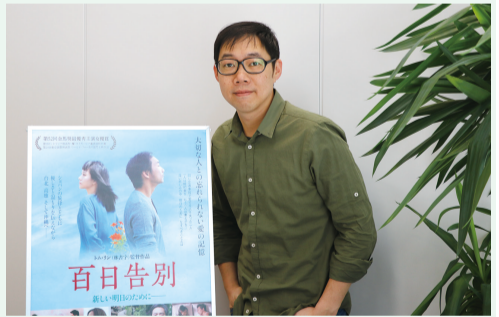
林書宇在《百日告別》拍攝過程中有很多即興創作

作品時隔一年半在日本上映，林書宇的感受和首次在台灣上映時大有不同，由於電影的題材並不輕鬆，讓他當時在面對觀眾的時候也比較謹慎，而現在他已經開始新的創作，將自己投入新的故事中，和這部片產生了距離，對上映反而充滿期待。