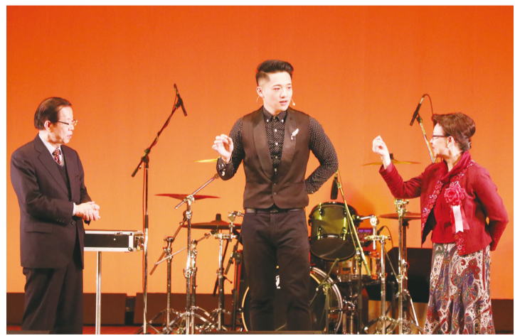
簡銘宜邀請謝長廷伉儷協助魔術表演

【東京／採訪報導】由僑務委員會春節文化訪問團執行委員會主辦的2017春節訪問文化團，第一站就來到日本，2月3日在淺草公會堂正式開演。台北駐日經濟文化代表處代表謝長廷伉儷、副代表郭仲熙