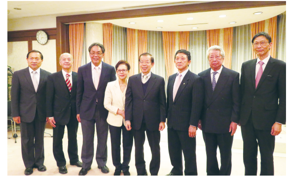
駐日代表謝長廷與橫濱地區僑領合照

【東京／採訪報導】台北駐日經濟文化代表處於2月10日晚間舉行新年會，邀請東京、橫濱地區的僑務諮詢委員、僑務委員、僑會及僑校負責人等出席新春餐會，包括遠道而來的山梨台灣總會幹部，約4、50位僑界先進出席。 駐日代表謝長廷先和大家拜晚年，他特別提到，近來台灣媒體報導有台灣遊客在日本旅遊景點做出大聲講話、未經同意隨意拍照等失禮行為，因此謝長廷希望政府宣傳旅客出國遵守基本禮儀，讓台灣人成為有禮貌、品性高，受世界歡迎的國家。 僑務委員黃宗敏代表僑界感謝代表處