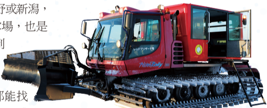
▲搭乘雪地車約20分鐘可以到達山頂

對於家族旅行或是中高龄者，若不想從事滑雪活動，也可以選擇山頂之旅。在清晨時分搭乘雪地車，約20分鐘就能抵達山頂，欣賞樹冰和霧冰，也可從高處眺望風景。下山的時候，可以選擇繼續搭乘雪地車，或是以滑雪板從高處滑下，體驗奔馳的快感。