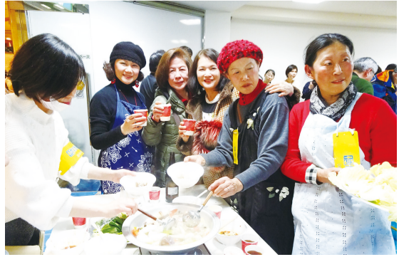
僑胞開心圍爐共享水餃火鍋

示，水餃不但好吃，又可以與大家交流，已經連續多年參加。水餃火鍋大會不僅撫慰了異鄉遊子的心，也成了文化交流的重要場合。