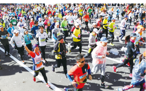
出發通過都廳前的台灣參賽選手，高舉起雙手

2017年東京馬拉松於2月26日上午9點在東京都廳前正式起跑，今年共有選手3萬6千位跑者參加，其中台灣選手1348名，是這次外國參賽選手人數最多的。