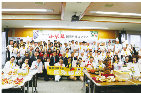
台韓日三國選手、來賓與主辦單位大合照

【山梨／採訪報導】第一屆國際藝術大賽於2月9日在山梨正式登場，邀請了來自台、日、韓三國共72位選手同場較勁，以山梨著名的農產品入菜。來自台灣的45位選手團是這次比賽最大贏家，總共奪得了43個獎項，其中包括3個特金獎。