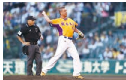
郭李建夫回到久違的甲子園球場開球

【神戶／採訪報導】阪神甲子園球場於6月14日、15日阪神虎隊與西武獅隊的兩場比賽中，與台灣虎航及台灣觀光協會大阪事務所共同舉辦「台灣日」，首日特別邀請棒球名將郭李建夫開球。活動期間