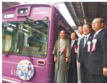
來賓和高捷運號合照

【京都／綜合報導】繼去年6月8日和關東地區的著名觀光鐵道「江之島電鐵」簽署觀光合作協議後，高雄捷運今年與關西地區京福電氣