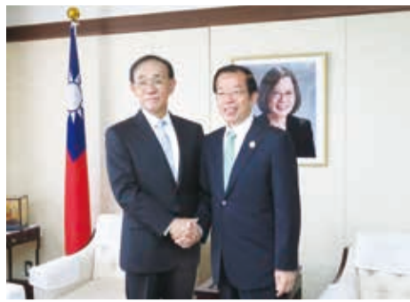
駐日代表謝長廷(左)與新任日本台灣交流協會理事長谷崎泰明(右)合影。

【東京／採訪報導】日本台灣交流協會新任理事長谷崎泰明，於6月22日暨前任理事長今井正和總務部長柿澤未知，前往台北駐日經濟文化代表處拜會駐日代表謝長廷，雙方就今後台日關係發展交換