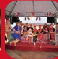
中華原郷生活美学協会