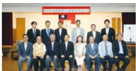
橫濱華僑總會新任幹部與駐橫濱辦事處處長陳桎宏(前排左4)合照