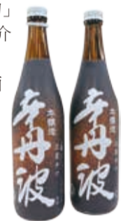
來自大關株式會社的「辛丹波 本釀造」。大關清酒在台灣相當受到歡迎

獲得2016年諾貝爾生理學、醫學獎的東京工業大學榮譽教授大隅良典，受邀以「來自酵母的啟示和禮物」為題，向大家介紹「細胞自噬」的研究內容。酒類綜合研究所理事長後藤奈美，也親自向大家介紹「全國新酒評鑑會」，以及品嚐日本酒的正確方式。