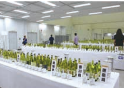
來自日本全國各地的400多種日本酒

【東京／採訪報導】2017日本酒FAIR於6月17日在東京池袋太陽城隆重登場，這個全世界最大的日本酒活動，今年已邁入第11屆，活動包含「第105屆2016年酒造年度全國新酒評鑑會公開試飲會」和「第11屆全國