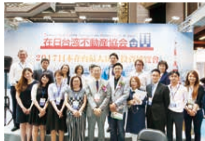
在日台灣不動產協會率7家廠商回台參展

【台北／採訪報導】全台灣最大的不動產展銷平台「TIEE台灣國際房地產暨理財投資展」於6月9日至12日在臺灣世貿一館登場，在日台灣不動產協會率領Alliance Realtor、K.R.IDEL、吉屋不動產、三富和新富、磐石亞日Milestone不動產和大三元等7家日本不動產業展回台參展，希望推廣日本不動產的魅力及正確交易知識。