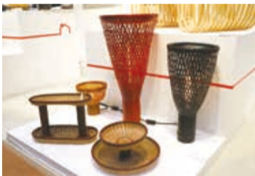
「格子設計」作品，保留竹管，四周再加上竹編