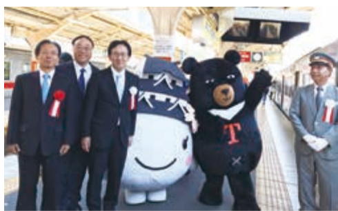
Meet Colors! 台灣號於6月5日起每日10個班次往來姬路和大阪

【大阪／綜合報導】由交通部觀光局和日本山陽電氣鐵道株式會社合作的首輛列車「Meet Colors! 台灣號」，於6月5日起正式上路，未來一年間將行駛於大阪和姬路之間，向乘客宣傳台灣旅遊魅力。