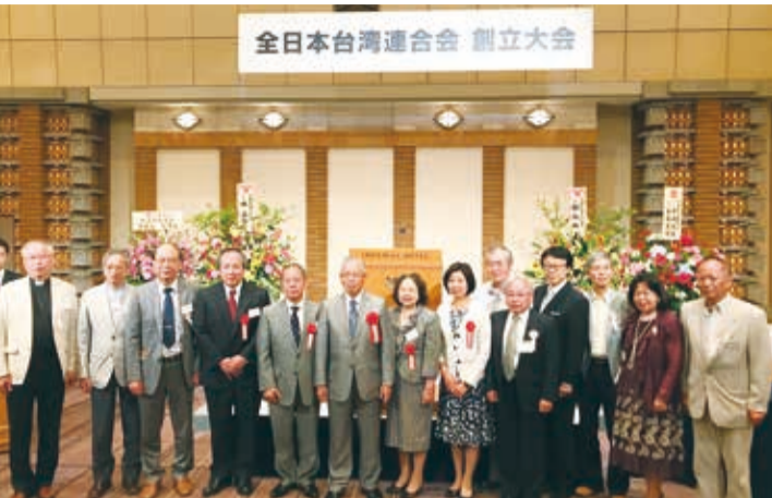
全日本台灣連合會幹部合影

訂閱方法僅需將姓名、地址、連絡電話等資料傳至 TEL: 03-5917-0045 FAX: 03-5917-0047 E-MAIL: info@taiwannews.jp