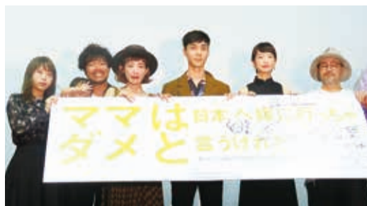
《雖然媽媽說我不可以嫁去日本》男女主角、導演和茂木全家福出席首映會