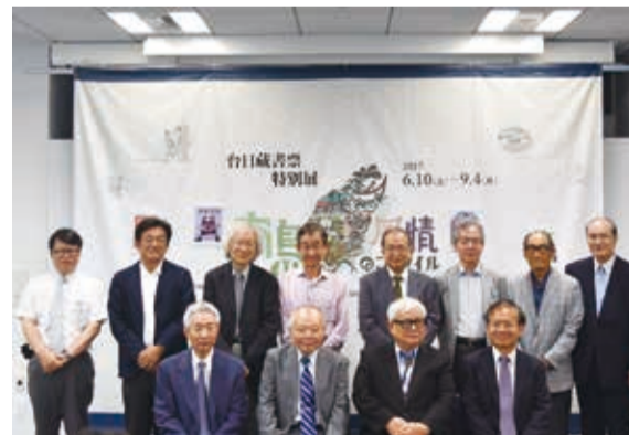
「南島風情—台日藏書票特展」開幕典禮與會來賓合照

【東京／綜合報導】由國立台灣文學館和台灣文化中心共同舉辦的「南島風情—台日藏書票特展」於6月10日開展，於在東京虎之門台灣文化中心展出43件日治時期的老藏書票和台灣當代藏書票藝術家作品，其中也包含日本文學家西川滿所珍藏的老藏書票。主辦單位希望透過藏書票展行銷台灣，達到台日交流目的。