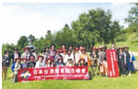
參訪團參觀南投景點

【南投／採訪報導】為了促進台日交流，了解南投當地特色和產業，日本台灣商會聯合總會南投縣參訪團一行30人於6月5日到7日參觀南投各地，並前往拜會南投縣政府縣長林明濤和集集鎮鎮長陳紀衡。