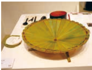
為日本市場而創作的菊花型果盤《圓滿》

擔任此次台灣工藝研究發展中心參展廠商評選的工業設計協會理事長林磐聳，自行來日看展，希望了解台灣和其他的展場有什麼差異。他表示，東京國際家居生活設計展是商展性質，重要的是工藝品要能獲得買家青睞。他也提到日本的设计非常精巧，又讓人驚艷，台灣可以學習日本發展軟實力，並創作出與日本不同的設計。