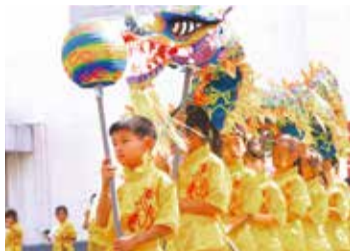
橫濱中華學院學生在國慶日所表演的舞龍

橫濱中華學院原名中西學校，是國父孫中山於1897年來到日本時所倡議創辦的第一所華僑學校，而後逐步增設幼稚部、中學部和高