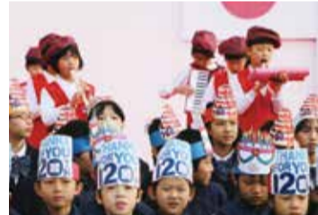
橫濱中華學院師生歡慶120週年校慶