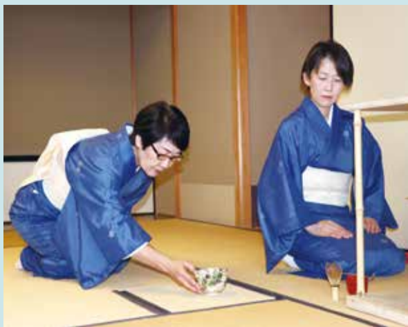
開光庵茶室中兩位茶道老師示範茶道禮儀