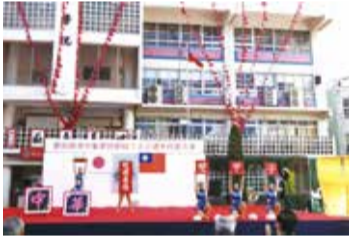
銘傳大學啦啦隊以熱力舞蹈祝賀橫濱中華學院