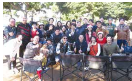
留日台灣同鄉會舉辦BBQ大會，逾120位僑民和日本友人參加

【東京／採訪報導】為了在日台灣鄉親聯同樂，也有全家大小一同前來參加，大人享受美食，小孩在戶外自由跑跳。手藝好的媽媽們負責燒烤，年輕人擔當助手，現場香味四溢，烤出來的美食很快就被大家一掃而空。坐在冬陽下，一邊喝著台灣飲品，一邊品嚐台灣烤肉滋味，僑界友人閒話家常，度過難得的周末午後。