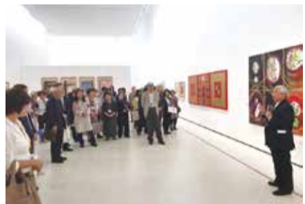
沖繩縣立博物館·美術館為紀念開館10周年，展出多位台灣藝術家作品

11月1日開幕式中，沖繩縣翁長雄志知事、臺灣美術院院長廖修平、副院長江明賢、執行長鍾有輝、台灣藝術大學前校