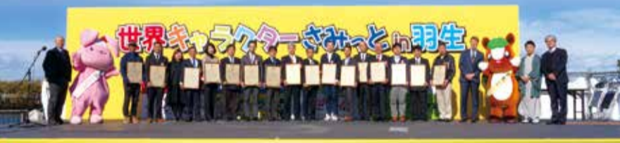
COOL JAPAN AWARD 2017 頒獎儀式在11月25日舉行

【京都／綜合報導】2017年COOL JAPAN AWARD得獎名單在11月25日公佈，經過來自世界各國的100位外國評審審查後，從今年報名的104件作品中選出26件最能代表日本文化的商品或文化活動。