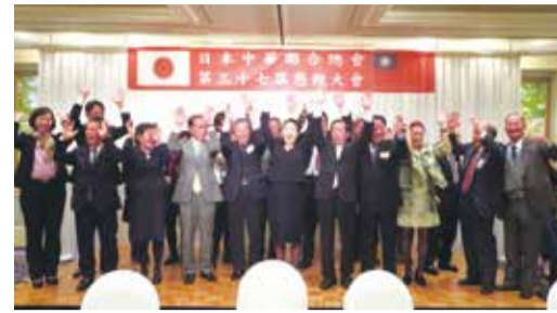
全體來賓同呼口號，祝賀晚會圓滿成功

日本台灣商會聯合總會此次與千葉縣館山市合作，移師當地舉行理監事會，獲得會員一致的好評，也為台商與日本地方交流打下基礎。會員也期盼能有更多機會與日本地方互動，不但能深耕日本市場，也能讓日本友人更了解台灣。