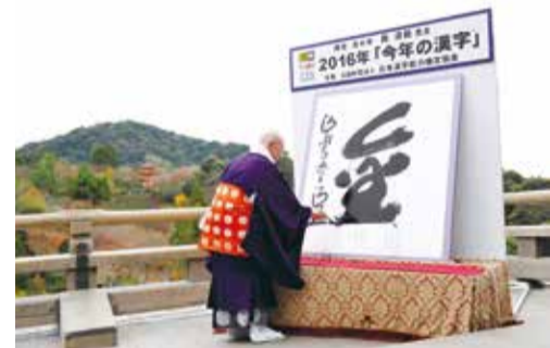
2016年漢字之日公佈當年度漢字為「金」

如果錯過了往年的漢字發表也沒關係，京都漢字博物館目前正舉辦「今年的漢字」特展，展期到2018年2月12日為止，過去22年所發表的年度漢字以及相關影像資料，都可以在特展中一飽眼福。