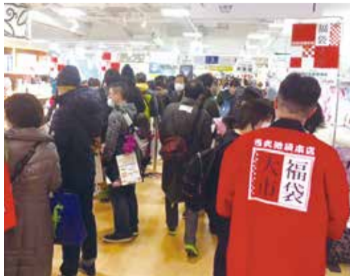
2016年西武百貨兒童服飾福袋吸引許多人潮