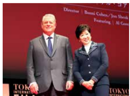
前美國副總統高爾(左)和東京都知事小池百合子

東京都知事小池百合子則表示東京都正在準備2020年奧運和帕奧，正好是一個向世界傳達保護地球的好機會。在奧運和帕奧閉幕式舉行時，將使用排汙交易系統，使這四天成為無二氧化碳排放日。