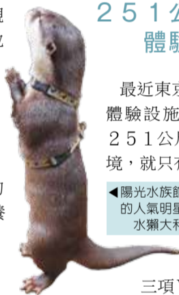
陽光水族館的人氣明星水獺大和

除了VR設施之外，這座「體驗型瞭望台」還有多項利用高科技的體驗項目，以光和鏡子打造的隧道「無限空間」，讓你彷彿走進萬花筒；想要像科幻片中人物徒手發出雷電不再是夢，只要透過這裡的互動式大螢幕，你也可以辦得到。