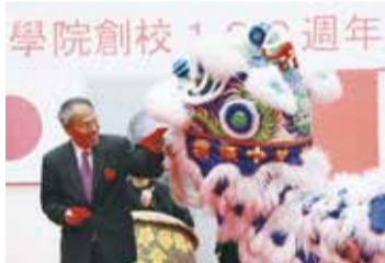
僑務委員長吳新興親自來日祝賀