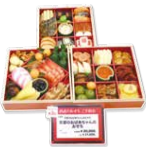
▲價格在2萬元左右的御節料理相當受到歡迎