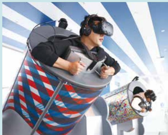
到SKY CIRCUS瞭望台體驗VR設施

【東京／採訪報導】說到高樓大廈，不免俗的會想到欣賞夜景，但是在這裡要向各位讀者介紹的，是日本東京首都圈高樓新玩法，不但可以看夜景、眺望遠方景色，還可以品茶、逛水族館和體驗VR設施。