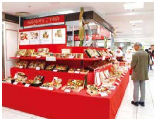
西武池袋本店御節料理販售專區，提供各式選擇

御節料理的每道菜都具有祝賀之意，蝦子、甜黑豆、鮭魚卵等都是常見的菜色。石澤係長說，每款御節料理內容大不相同，選擇自己喜歡的料理外，也可以挑選在家不易烹煮的菜色。