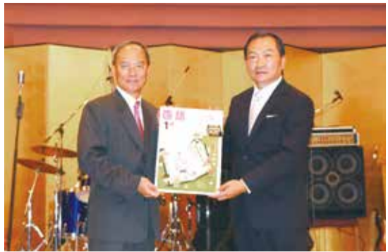
僑務委員長吳新興(左)頒贈橫濱中華學院《親子共學華語父母手冊》

為了改善校舍老舊問題，在僑會和橫濱市等多方協助下，橫濱中華學院開始進行校舍改建工程計畫。目前由橫濱中華保育會經營的立案保育園，將和橫濱中華學院幼稚園合併，成為新的幼保複合立案幼兒園，希望延續橫濱市政府所提倡的零待機兒童政策。