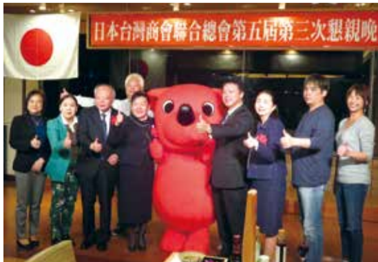
日本台灣商會聯合總會舉行第5屆第3次理監事會，懇親會中駐日副代表郭仲熙(左3)和日本中華聯合總會會長新垣句子(右3)也受邀出席

【千葉／採訪報導】日本台灣商會聯合總會在11月19日於千葉館山市召開第5屆第3次理監事聯席會議，在日本台灣商會聯合總會會長林裕玲安排下，特別前往有日本夏威夷之稱的館山市舉行，越南台商總會會長許玉林和來自日本各地的台商會會長和理監事等70多人出席。晚間所舉辦的懇親會並邀請駐日副代表郭仲熙、千葉縣知事森田健作、館山市市長金丸謙一、當地民意代表和台商會會員等百餘人與會，