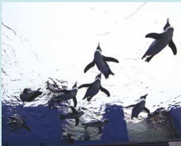
陽光水族館的新展區「天空企鵝」