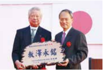
僑務委員長吳新興(右)頒發「教澤永銘」匾額給橫濱中華學院

吳委員長此行除了到橫濱參加中華學院校慶外，也先前往沖繩石垣島、福岡市和名古屋等地與僑胞交流。他特別感謝在日僑胞，除了對日本社會作出貢獻外，也協助促進台日關係。