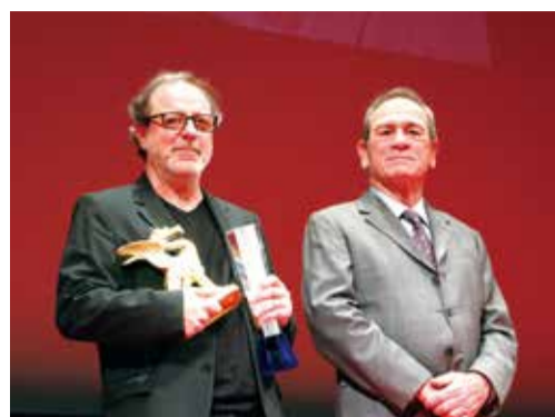
國際評審團主席湯米李瓊斯(右)與今年東京大獎得主土耳其導演Semih Kaplanoglu

【東京／採訪報導】第30屆東京國際影展在11月3日閉幕典禮，今年度東京大獎暨東京都知事獎由土耳其導演Semih Kaplanoglu的作品《Grain》獲得。閉幕片則為前美國副總統高爾所執導的紀錄片《不願面對的真相2》，高爾也在閉幕式中到場致意。