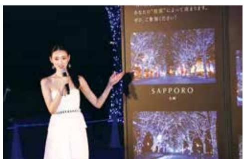
栗山千明出席青色洞窟點燈儀式