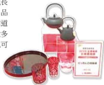
目標海外顧客，強調Made in Japan的「技」福袋

近年各大百貨紛紛推出不同的「體驗型福袋」，西武百貨在2018年推出可以包下西武車廂舉行婚禮，以及在八岳高原音樂堂聆聽東儀秀樹30分鐘私人音樂會等特別企劃，數量限定還需經過抽選，藉此吸引顧客消費意願。